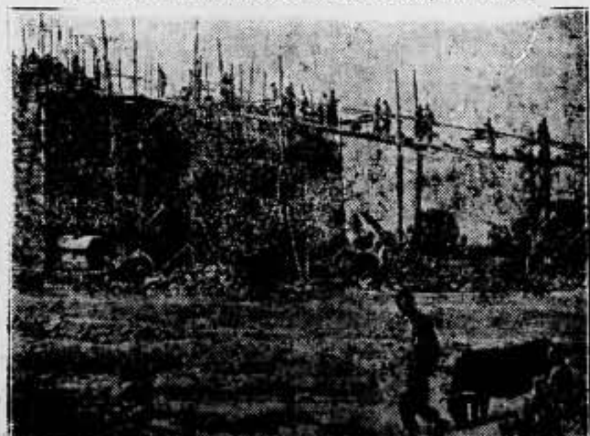
Construcción de murallas en Kansu (China Occidental), según se dice para evitar la amenaza comunista.