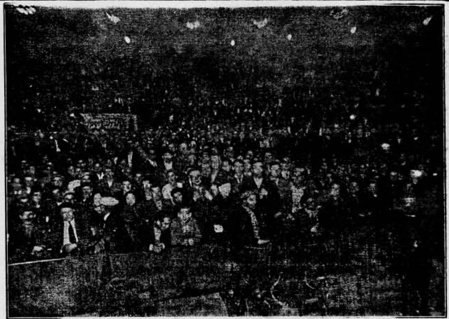
Un aspecto parcial de la Asamblea realizada por los huelguistas metalúrgicos, el sábado, en el Olympia.