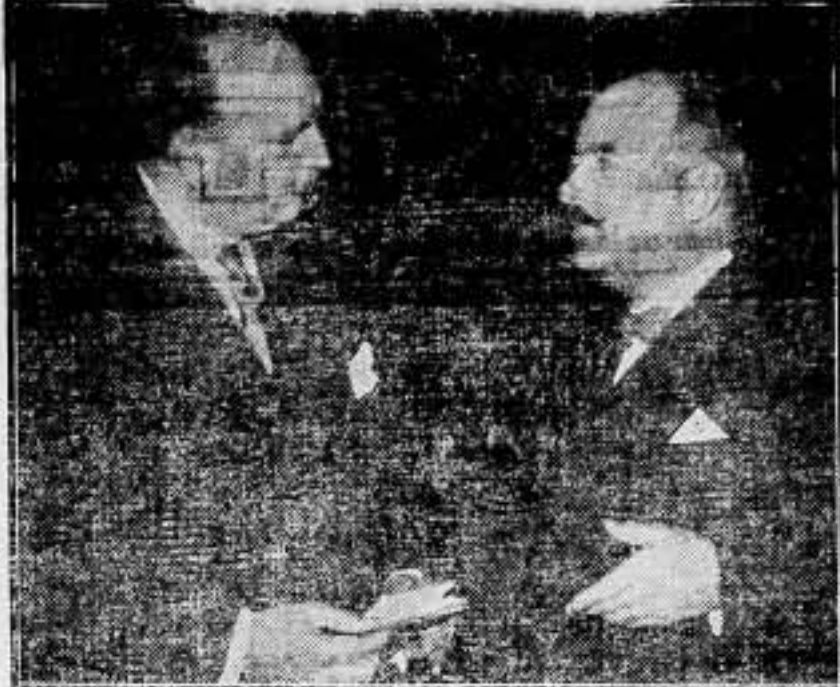
Flandin ha convocado una conferencia de embajadores. Mr. Flandin conversando con Francois Poncet, embajador de Francia en Berlin.