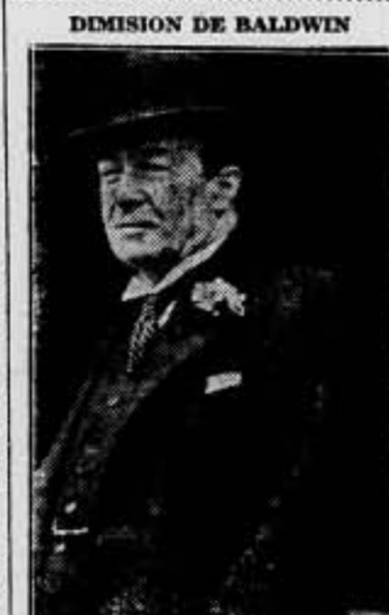
DIMISION DE BALDWIN Se corren insistentes rumores sobre la dimisión de Baldwin. ¿Será verdad?

subsistencias, que van por las nubes, las alcanzamos menos. Vamos, señores, más lógica y menos egotismo. Si la democracia es comer unos para que los otros ayunen, a otro con ese hueso. ¡Vamos! Geófilo