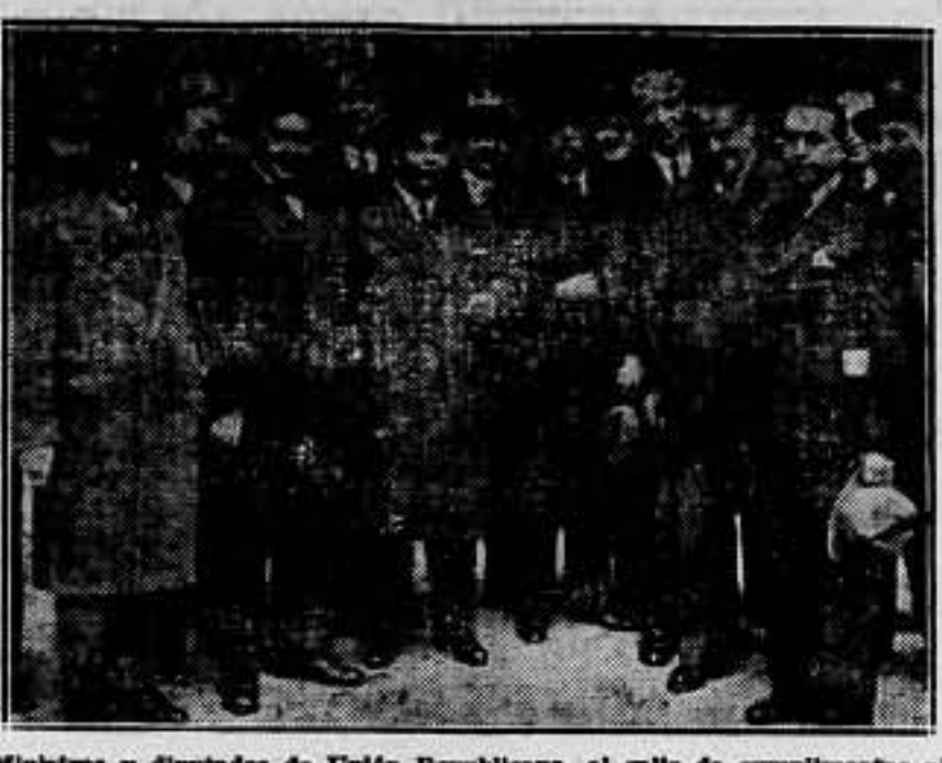
Ministros y diputados de Unión Republicana, al salir de cumplimentar al nuevo jefe de Estado.