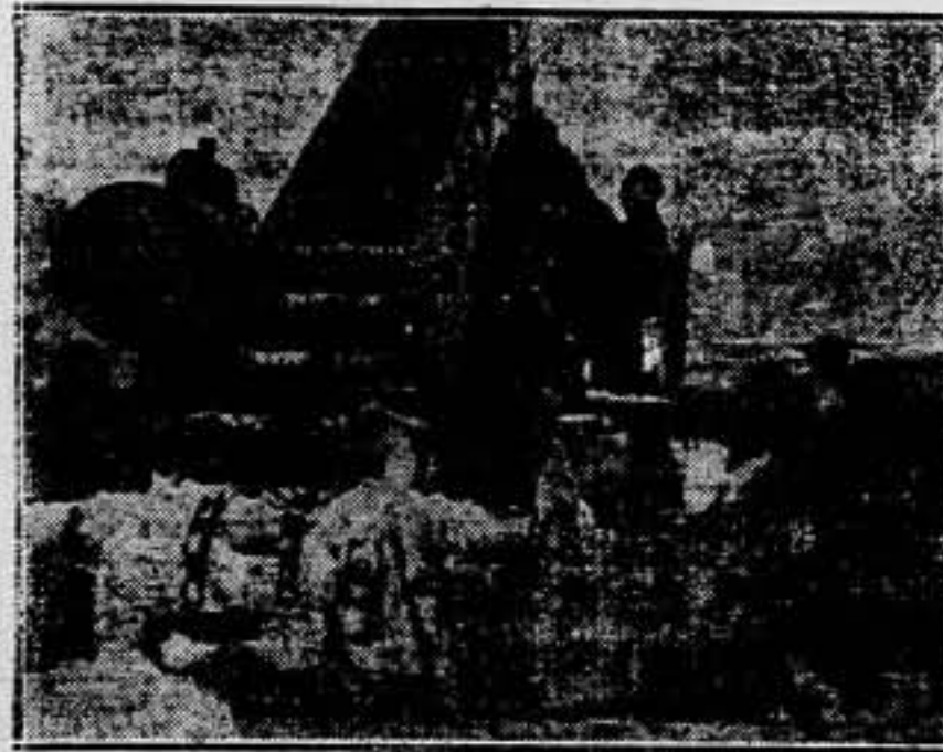
Una draga limpiando la Plaza Eoja, de Moscú, de las nieves amontonadas.