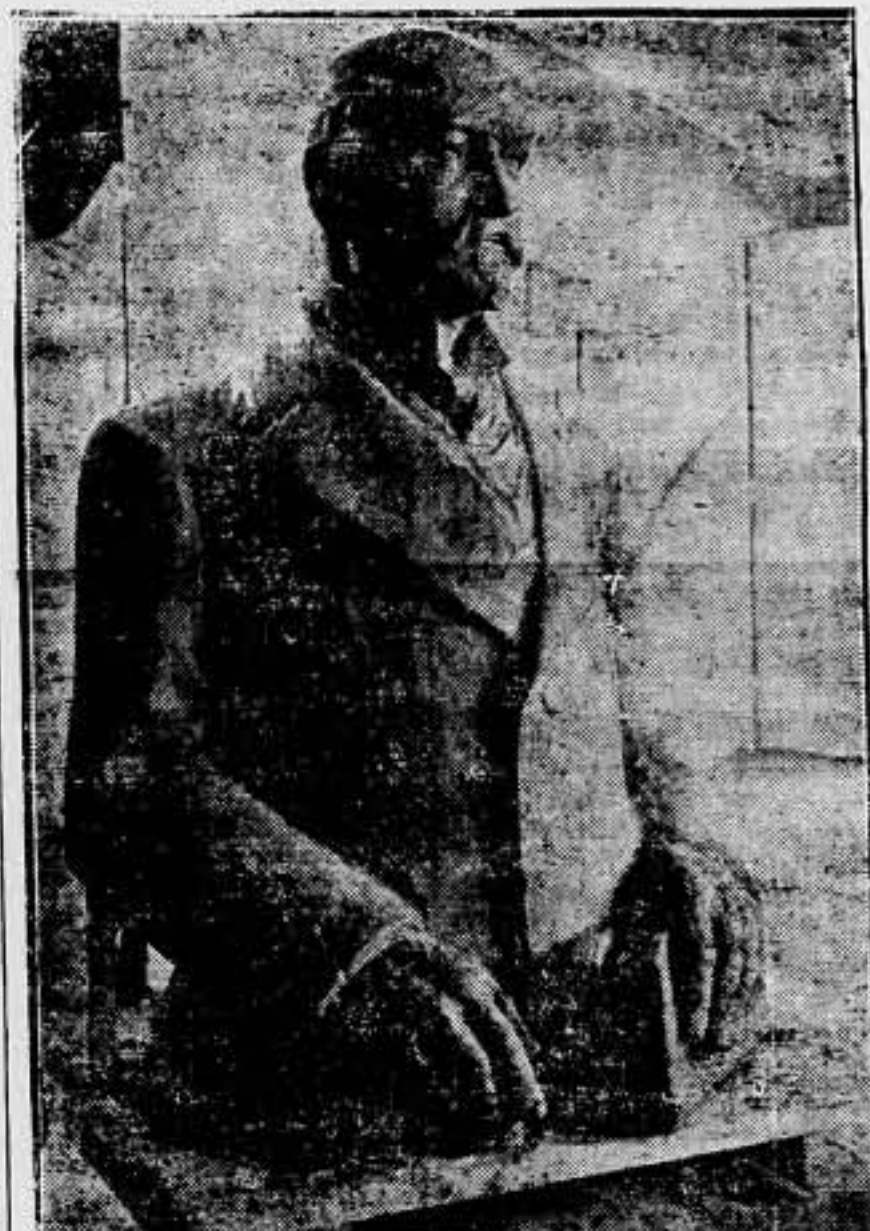
Busto de Ferrer que coronará el monumento que piensa erigir en su memoria el Ayuntamiento de Mor., Ostrava (Checoeslovaquia)

1909. Barcelona vive un instante de inspiración. El pueblo está en la calle. Las llamas purifican el firmamento catalán. Las descargas de fusilería resuenan con ritmo alocado. Maura y La Cierva inundan de sangre la Región Catalana. Los piquetes de tropa ejecutan las decisiones capitales. Un gobernador cristiano vela por su cumplimiento. En el foso de Montjuich cae un hombre. Su muerte es ejemplar. Hasta el postrer minuto no pierde el control de sus actos. Al grito de viva la Anarquía besa la tierra que ha de cobijarle por toda una eternidad. Fue la víctima propiciatoria de las hordas jesuíticas. La reacción necesitaba una cabeza visible. Escogió a Francisco Ferrer. El fundador de la Escuela sin Dios pagó con su vida tamaña osadía. La religión no toleró que el racionalismo se acercase a los niños para moldearlos como a hombres. Este fue el crimen de Ferrer. De los hechos de 1909 no conocía nada. Este asesinato debilitó enormemente a la dinastía de los Borbones que se han empapado con la sangre del pueblo español. En el mundo entero se levantó una oleada de indignación. Las multitudes vociferaban contra los asesinos de Ferrer. En los umbrales de los Consulados españoles se apiñaba la clase obrera que no se cibe en los lindes geográficos. Rugió el Universo. Y la sangre de Ferrer cayó de lleno sobre las hienas ensotanadas y sobre las cabezas de los gobernantes que inmolaron en los fosos de la fortaleza que se asoma en el horizonte barcelonés a un inocente.