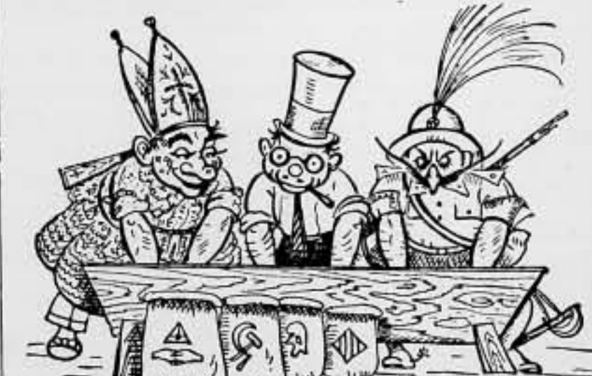
¿Qué lástima que no se deje amasar con esta mezcla de especies la C. N. T.!