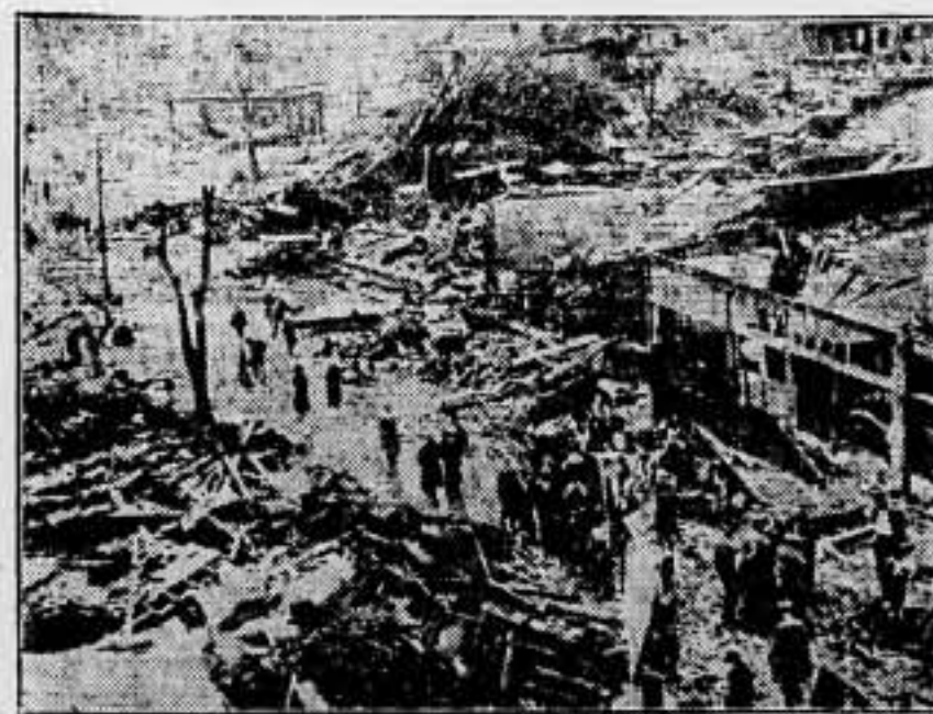
Un aspecto de la villa de Gainsville después de un furioso ciclón. En esta localidad hubo 175 muertos y más de 1,000 heridos. Las pérdidas materiales ascienden a más de cinco millones de dólares