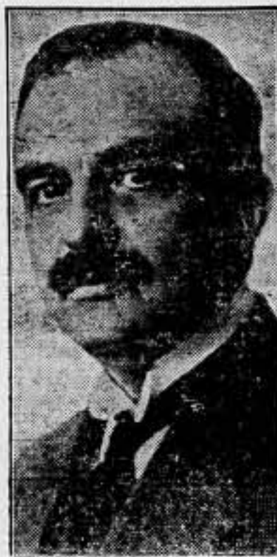
El general Motaxas, nuevo presidente del Consejo de ministros de Grecia y ministro de Negocios Extranjeros

Estas palabras, de un sentido profundamente nacionalista, han sido publicadas en "L'Humanité". Vemos por ella que ya no es "L'Action Française", y si "L'Humanité", el órgano del nacionalismo integral. Comunistas y socialistas siguen hoy los mismos métodos que en 1914.