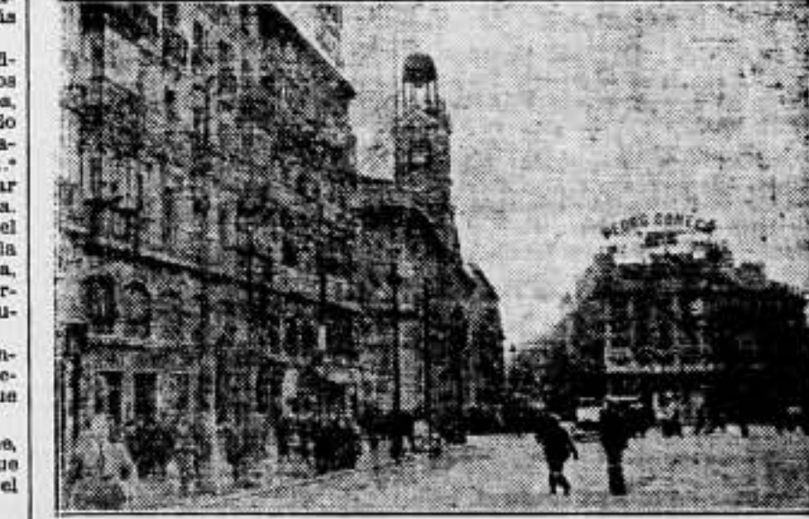
La Fuera del Sol ofrece este desolador aspecto por la falta de taxis.