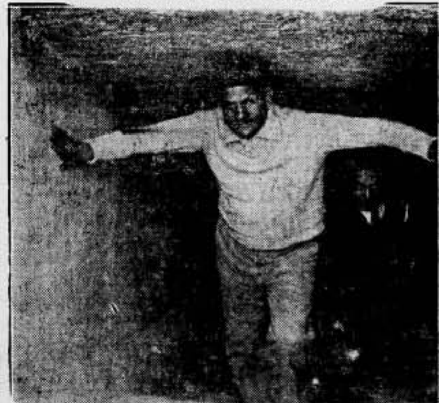
En Sakkará, diez millas al Sud de El Cairo, cerca de la farruca pirámide Step, se ha encontrado una tumba que tiene de cuatro a cinco mil años de existencia, según se cree.