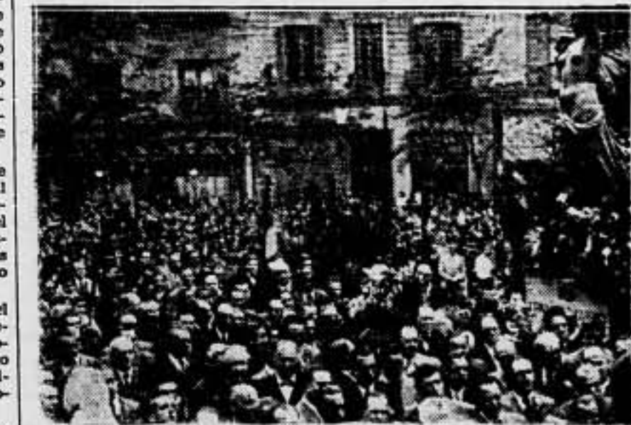
Un aspecto de la multitud congregada frente a la estatua, en la mañana del domingo.