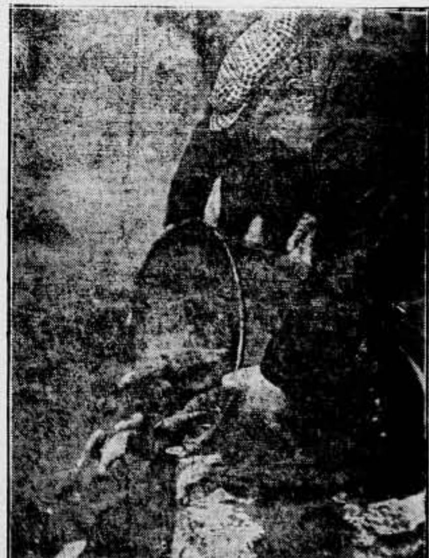
LA RECRÍA DE PECES EN EL CANAL DE LOUBOG

Con objeto de fomentar la cría de peces, la Administración de Aguas hace lanzar miles de peces al canal, para que no se extinga la pesca. Es una manera muy "elegante" de crear "víctimas" para que el hombre se divierta.