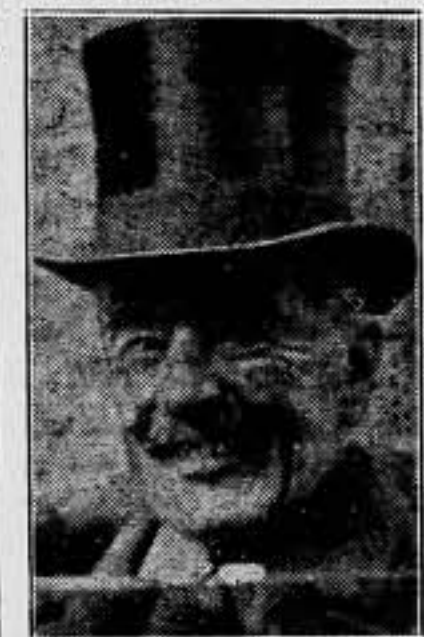
El señor Neville Chamberlain expuso a la Cámara sus nuevos proyectos de Hacienda en un discurso de dos horas y media

El Anarquismo no podía faltar en esta manifestación cultural. "Tierra y Libertad" se ha plantado en la Rambla. Su Stand es la demostración ostentosa de que la F. A. I. tiene ambiente callejero.