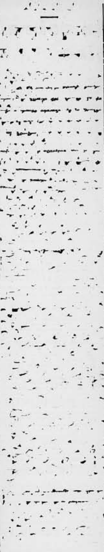
LAS TROPAS ITALIANAS SE APROXIMAN A ADDIS ABEBA