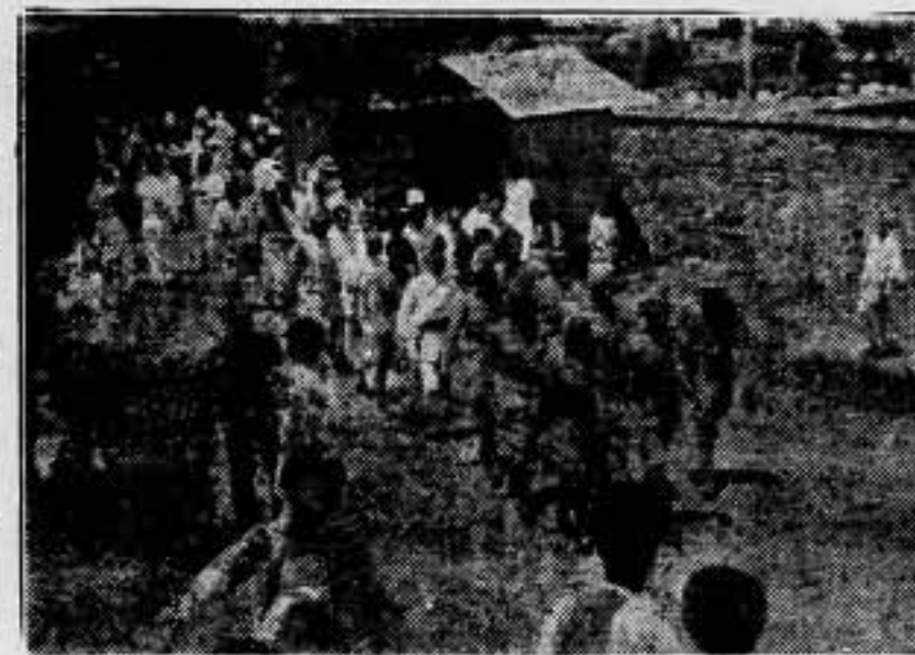
Ante las severas batallas que, según se dice, se están librando cerca de Addis Abeba, la población de esta capital ha empezado su éxodo hacia lugares más seguros, y la ciudad se halla casi desierta. Esta fotografía es una demostración gráfica de la situación de alarma en Addis Abeba en el presente momento. Destacamentos de tropas saliendo de la capital para efectuar reconocimientos y proteger a los civiles.