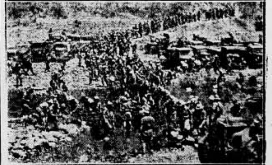
He aquí la columna ligera motorizada del general Starace, que avanza hacia la ribera del lago Tana.