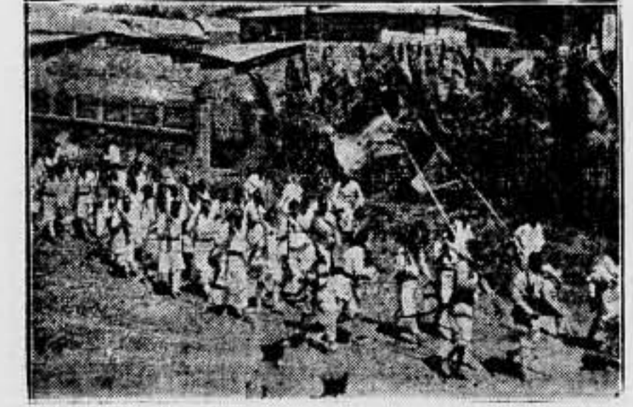
Mientras las tropas de la Guardia Imperial tratan de cortar el camino a las tropas italianas, que avanzan continuamente sobre la capital, en Addis Abeba se están rápidamente formando contingentes armados para la defensa de la capital. He aquí un grupo de guerreros abisinios, dispóniéndose a salir a los alrededores de Addis Abeba, para defender la capital.