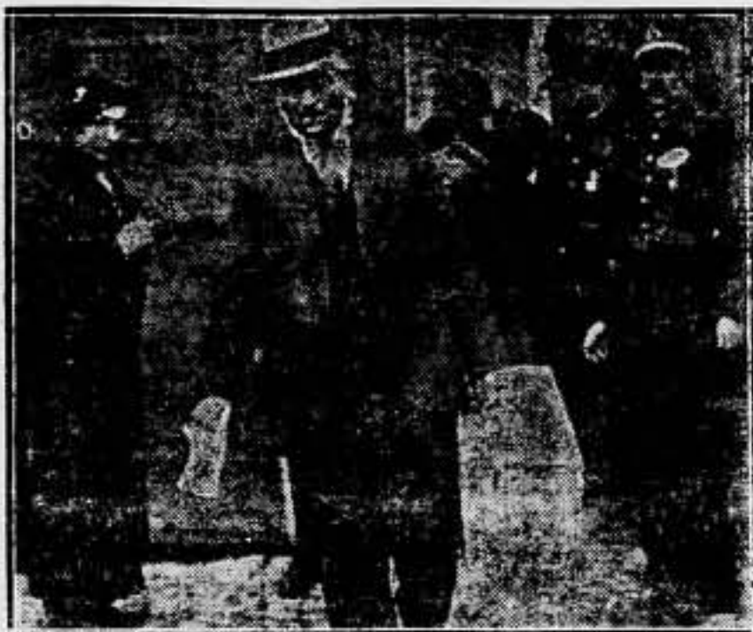
A causa de una epidemia que se desarrolla en la cárcel de Vacarestia, cerca de Bukarest, los presos salen de ella para reponerse en su casa.