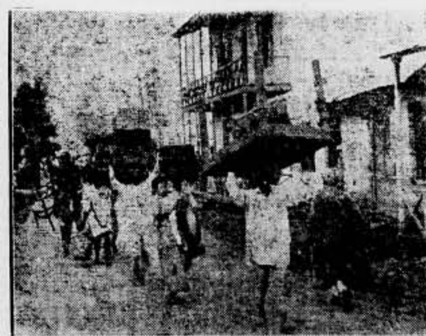
Familias abisinias, debido a los sucesos desarrollados en Addis Abeba, y ante la inminente ocupación de esta plaza, huyen, con sus muebles, de la capital.