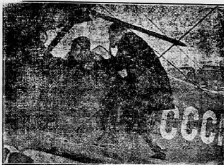
Los aviadores rusos emplean máscaras contra el gas en sus vuelos.

Esa actitud de rebeldía es todo un sintoma. Cuando los obreros se rebelan, las autoridades disponen de una solución muy bonita: la cárcel. Cuando se rebelan los patronos, el problema varía de aspecto: se at-