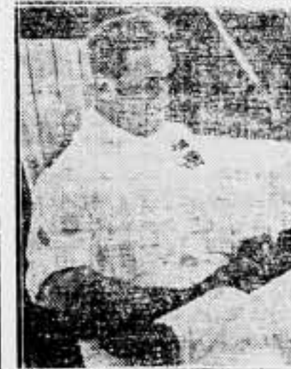
He aquí al general Graziani en su cuartel general, a retaguardia del ejército