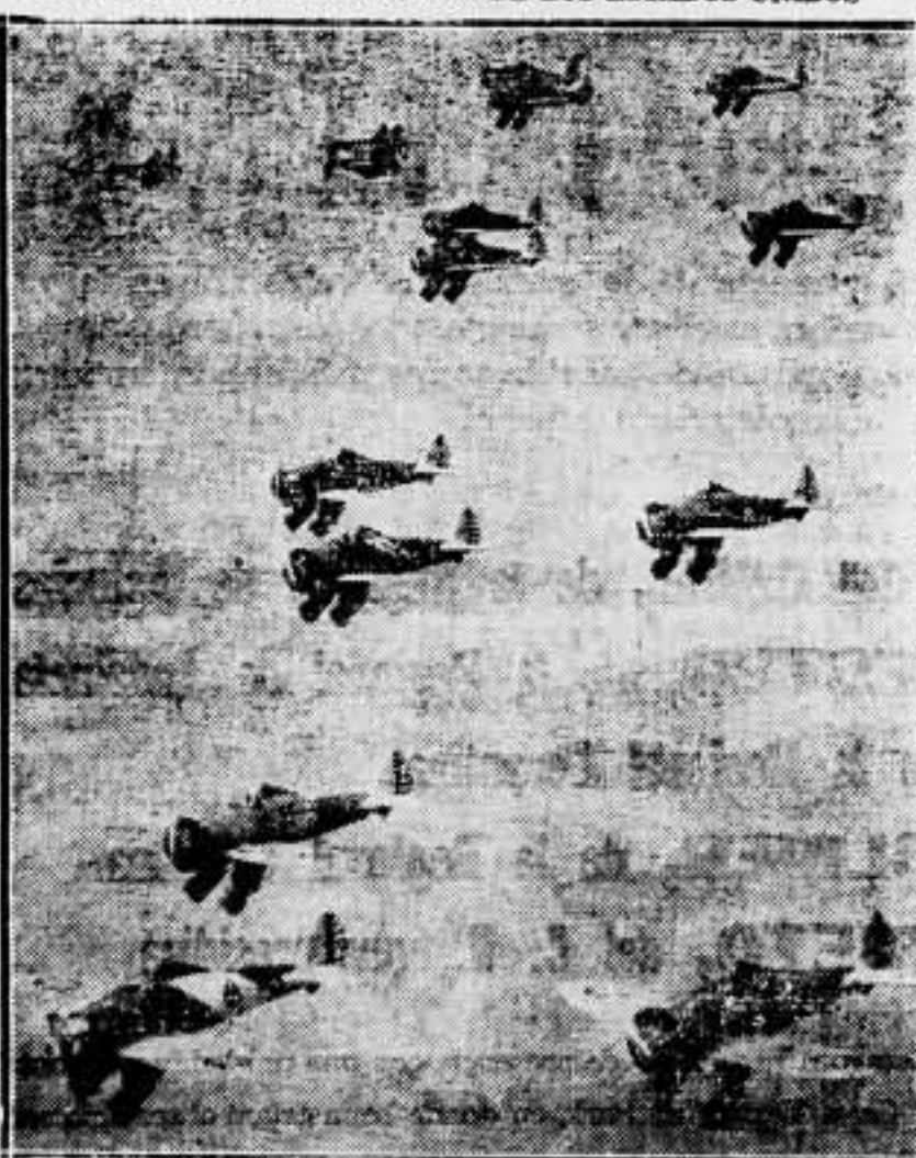
Una flotilla de los más potentes aviones de bombardeo, durante manobras.