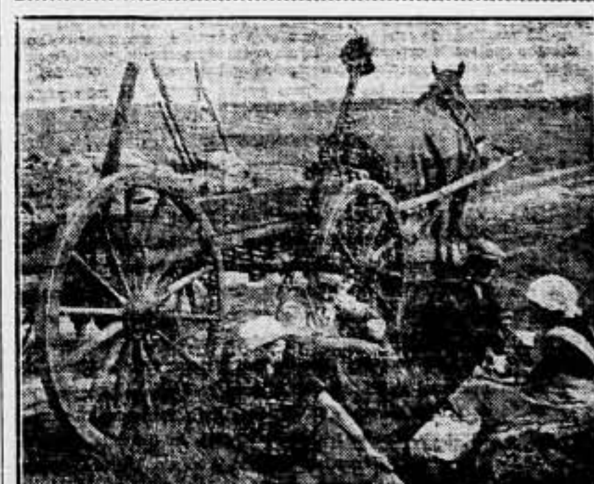
Después de la jornada, el cansa, un rato de descanso.