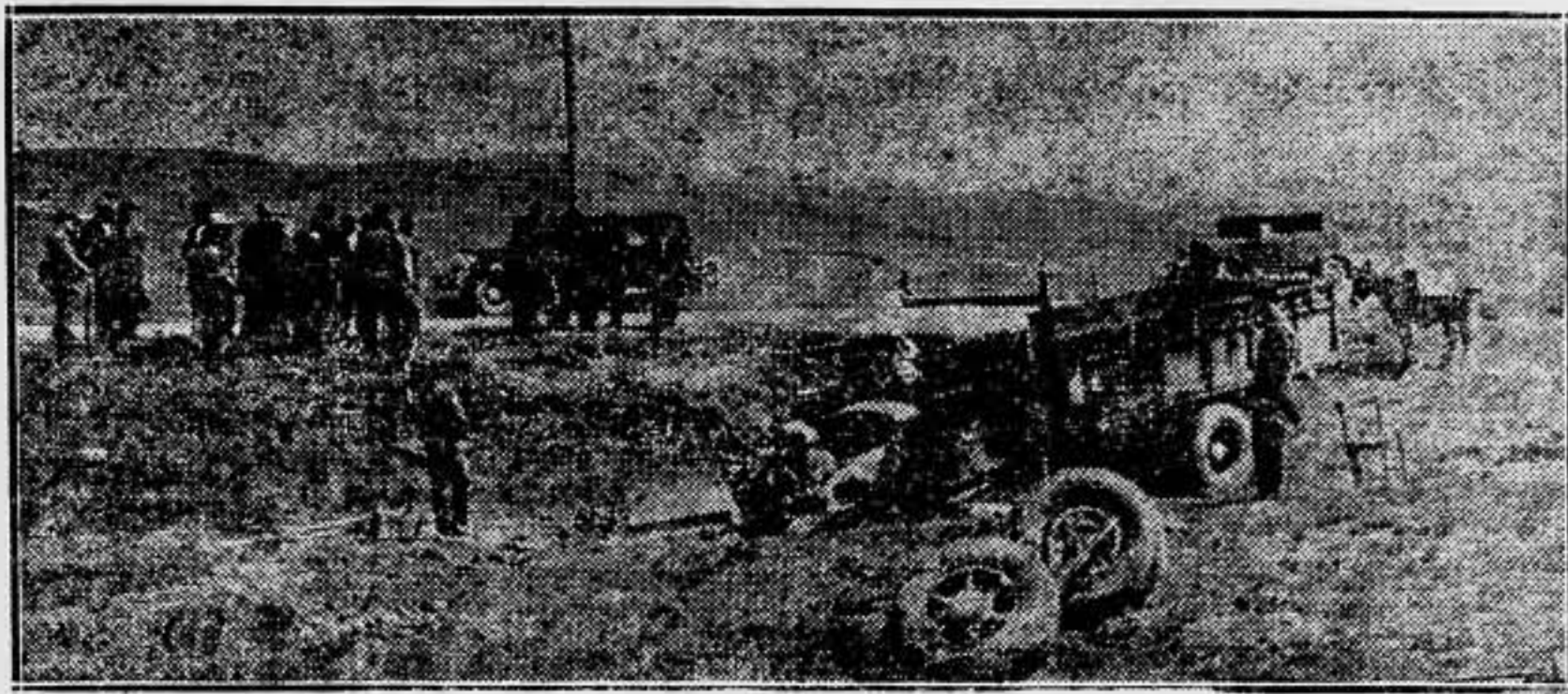
Lugar donde se produjo el accidente, y estado en que quedó la camioneta.

Después de conversar brevemente con los heridos, a los que no queremos molestar en ese momento doloroso para ellos por la propia desgracia y por la muerte de compañeros a quien les une amistad y comunidad de ideas, nos trasladamos al lugar del suceso. Distaba unos cuantos kilómetros de Carifena, en pleno puerto Paniza. Nuestro auto evolucionó en las curvas de la montaña donde poco antes tuvo lugar la sensible desgracia. El camión no se ha precipitado en ningún barranco. Ha ido a destrozarse justamente en uno de los puntos más peligrosos del puerto. La carretera se alza escarpadamente a dos metros de altura sobre unos pequeños prados, donde ha caído el camión dando tumbos. Difícil imaginar una