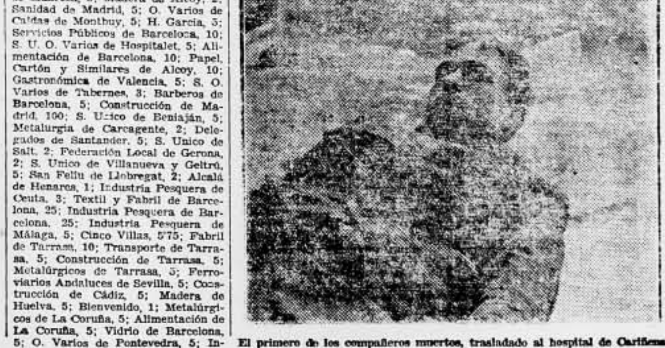
El primero de los compañeros muertos, trasladado al hospital de Carifena.

Cuanto más se digan sobre una necesidad cualquiera, por más bellas que sean las frases empleadas en su descripción, nunca podrán compararse en utilidad a la que representa el dar plena satisfacción a esta misma necesidad. En el caso que nos ocupa, que en concreción se refiere a la expansión de la cultura, podemos decir que la Federación Estudiantil de Conciencias Libres ha empezado una labor intensamente provechosa. Hemos oído frases dignas en verdad de ser tenidas en cuenta, glorificando la enorme necesidad de que los conocimientos culturales sean compartidos entre los obreros incultos, y preferiblemente los campesinos, a quienes la enseñanza primaria apenas les llega en una mínima parte. Hemos leído libros y folletos que resultan con