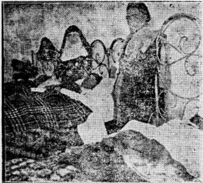
Aspecto de una de las habitaciones del pequeño hospital de Carifena.