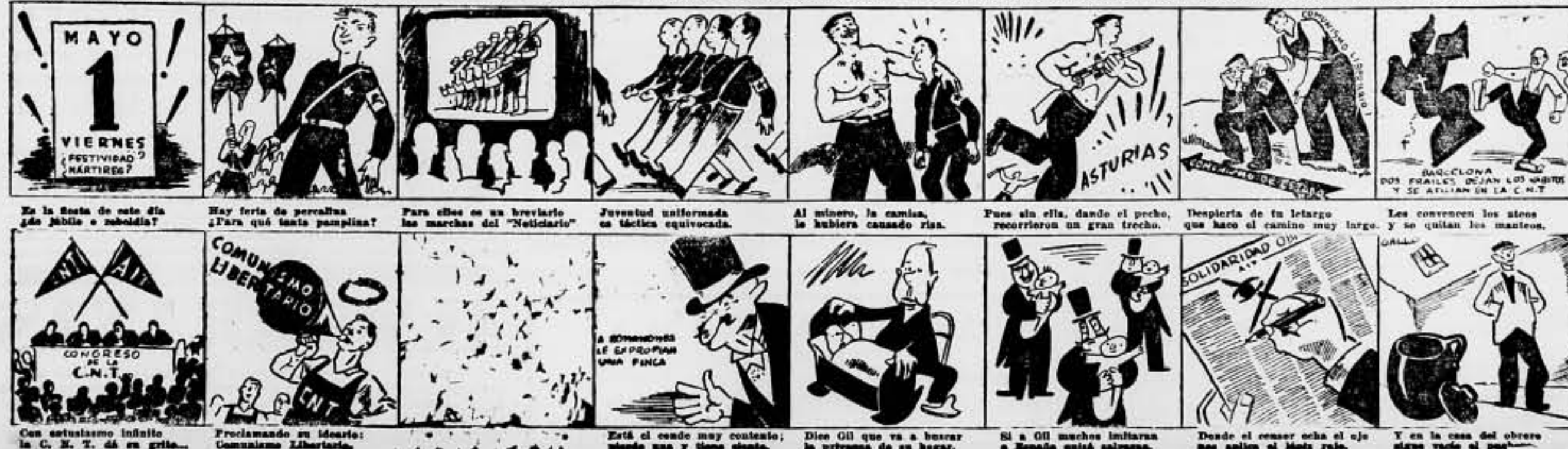
En la fiesta de este día ¿de júbilo o rebeldía? Hay feria de perrallas ¿Para qué tanta pampina? Para ellos es un brevario las marchas del "Noticiero" Juventud uniformada es táctica equivocada. Al mismo, la camisa, le hubiera causado risa. Pues sin ella, dando el pecho, recorrieron un gran trecho. Despierta de su letargo que hace el camino muy largo, y se quitan los mantos. Les convienen los atenos, y se quitan los mantos. Con actualismo infinito la C. N. T. dá en grito... Proclamando su ideal: Comunismo Libertario. Está el condé muy contento; günde una y tiene alente. Dice Gil que va a beber la primavera de su hogar. Si a Gil muchos militares a España quitá salamos. Desde el comer oche el ojo nos aplica el lápiz rojo. Y en la casa del obrero sigue vació el pué.

Lamentamos el percance. Pero el infortunado vendedor ha estado de desgracia. Contaría con la mala fortuna, y en cambio, le ha caído el gorro. Con toda seguridad que le perdirá la mala estrella.