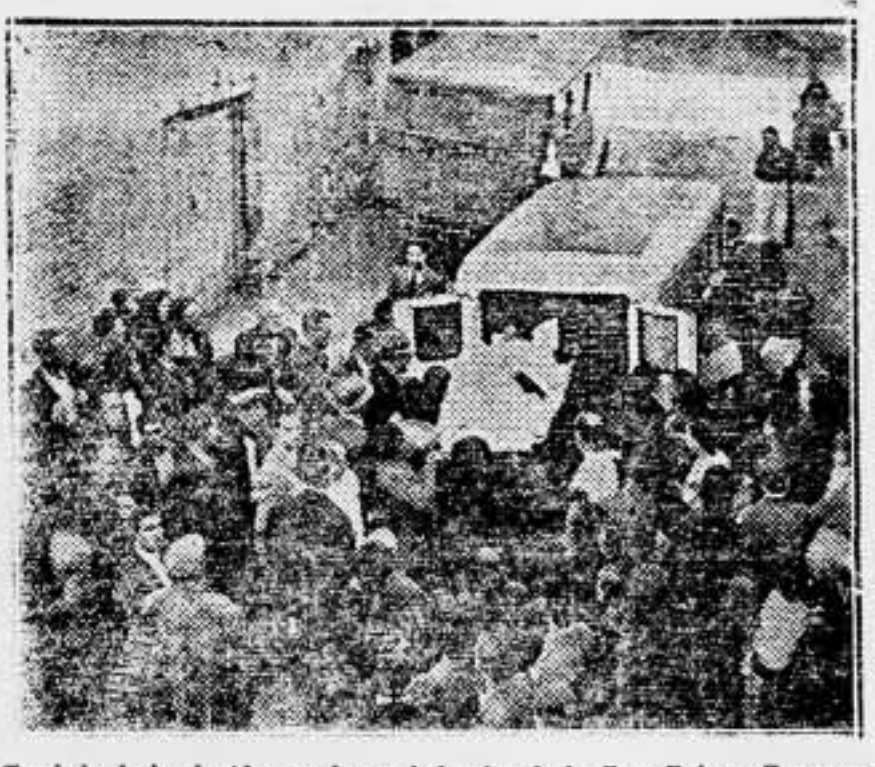
Traslado de los heridos, en las ambulancias de la Cruz Roja, a Zaragoza.

5; Una compañera, 1; Germinal Caste, Dilo, Riotinto, 1; S. Transporte de Madrid, 10; Viticultores de Jerez, 2; Construcción de Jerez, 2; Otro compañero, 1; Artes Gráficas de Zaragoza, 2; Sociedad "Progreso Obrero", P. de Gandia, 5; Sociedad Obrera Marítima, P. de Gandia, 5; Metalúrgicos de Zaragoza, 5; S. U. y Ferrovios de Reus, 5; Transporte de Huelva, 5; Transporte de Barcelona, 25; S. G. de Trabajadores de Lugo, 5; Comarcal de Noya, 10; Comarcal de Navarra, 5; Sindicato de Molinos de Rey, 5; Comarcal Bajo Llobregat, 5; S. U. Metalúrgic de Sevi-