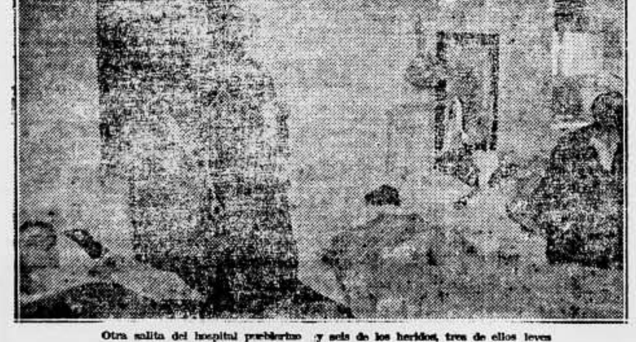
Otra salida del hospital prebitero y seis de los heridos, tres de ellos leves

Puerto Sagunto, 5; Comité Regional de Levante, 200; O. Varios de Petrel, 5; O. Varios de Villajoyosa, 5; Comarcal de Terreses, 5; Camareros de San Sebastián, 2; S. Unico de Lajona, 5; P. Local de Madrid, 50; S. Unico de Monovar, 5; Alimentación de Sevilla, 5; Gastronomía de Málaga, 5; Construcción de Valencia, 10; Madera de Valencia, 5; Artes Gráficas de Valencia, 5; Ferrovios de Valencia, 10; S. O. Varios de Carlet, 5; Delegación de Badalona, 5; S. de la Piel de Barcelona, 2.