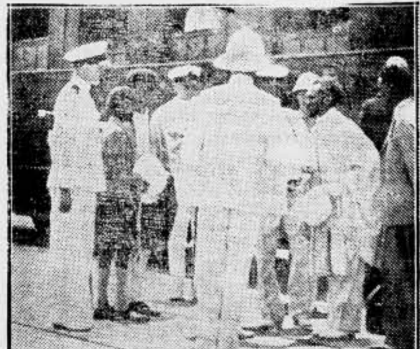
El Negus de Abisinia llegó a Haifa, procedente de Djibuti, a bordo del crucero británico «Enterprise», en compañía de su familia y de su séquito. El emperador se despidió de algunos de los oficiales del crucero, antes de partir en el tren que lo condujo a Jerusalén.