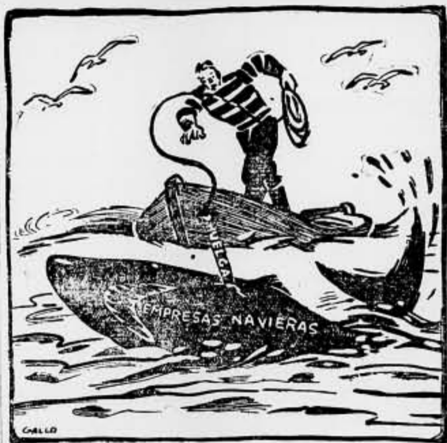
El marino mercante clavó su arpón.