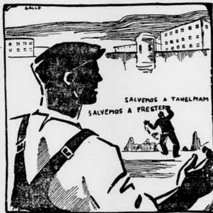
—De nuestros Juanes Españoles, no se acuerdan.

POR EL COMITE REGIONAL DE CATALUÑA, EL SECRETARIO