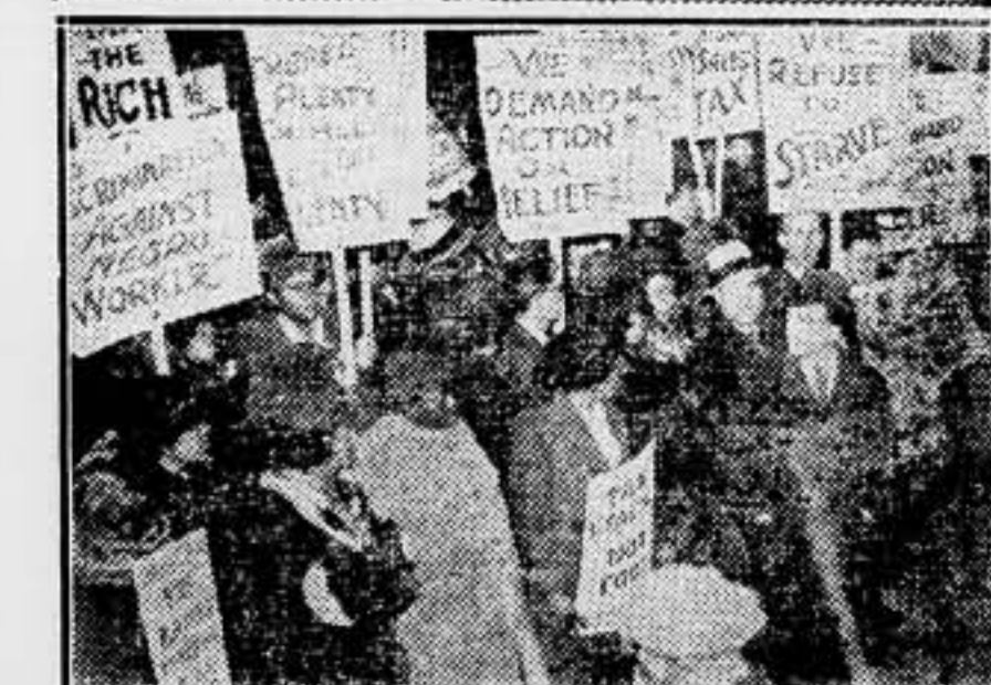
Manifestación de los obreros y empleados parados delante del Gobierno de Nueva Jersey (Estados Unidos). Los manifestantes llevan carteles con varias inscripciones pidiendo el aumento de salarios.

Marcelino Domingo es un completo fracasado. En todos los cargos ha dejado sentada su escusa encefálica. Su verdadero cliché es el del año 1917. Lo detuvieron debajo de una cama. ¡Vivan los hombres valientes!