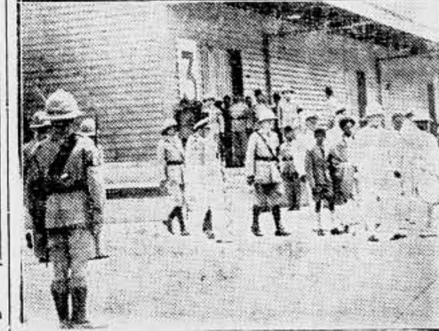
El Negus, a su llegada a Haifa, es acogido por las autoridades del puerto.