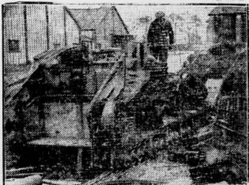
Con la reconstrucción del Ejército, están desguazándose los tanques viejos, sustituyéndolos por otros nuevos, en el depósito de tanques de Farnborough, Hampshire.