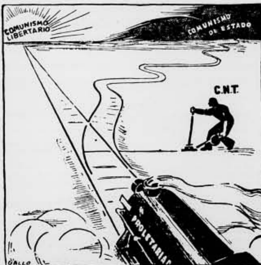
La misión a cumplir por la Confederación Nacional del Trabajo.