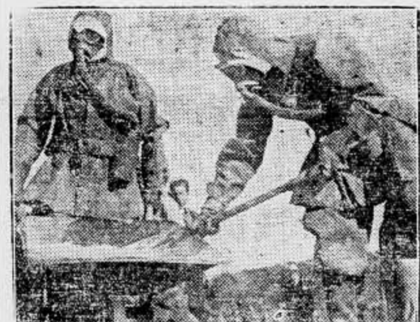
En presencia del rey Gustavo de Suecia y de 25.000 espectadores, tuvo efecto en Gardet, cerca de Estocolmo, una gran manifestación de ejercicios anti-aéreos. Soldados provistos de equipos contra los gases, limpiando el terreno de supuestos gases lanzados por aviones enemigos.

Y ahora que hablen de paz, de orden, de sentido conservador de la sociedad y de igualdad ante la ley.