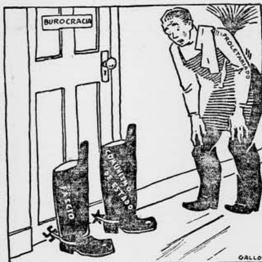
El proletariado repara en detalles.