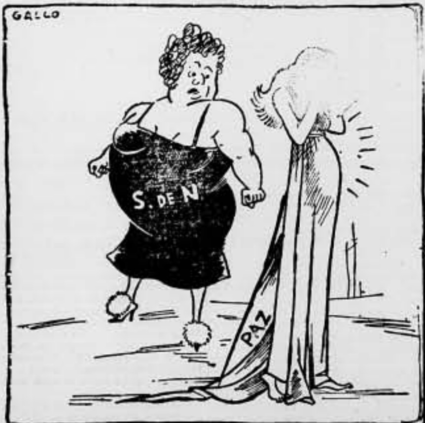
—¡Dime, hija mía! ¿Quién ha sido? —Mussolini... y... Hitler.