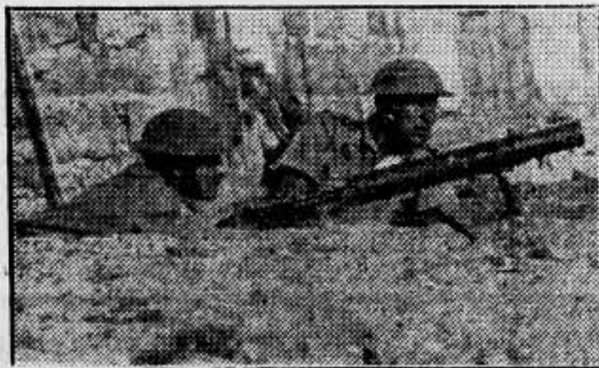
Tropas británicas, provistas de cascos de acero y ametralladoras Lewis, en guardia en una calle de Tel Aviv, lugar en donde han ocurrido los más serios sucesos de los combates entre árabes y judíos.

ULTIMA FOTOGRAFIA DE LOS DISTURBIOS DE PALESTINA