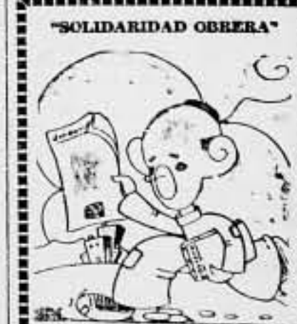
Camaradas: ¡Leed y propagad nuestro diario! SOLIDARIDAD OBRERA es el diario de los trabajadores. Cada camarada debe ser un propagador del mismo.