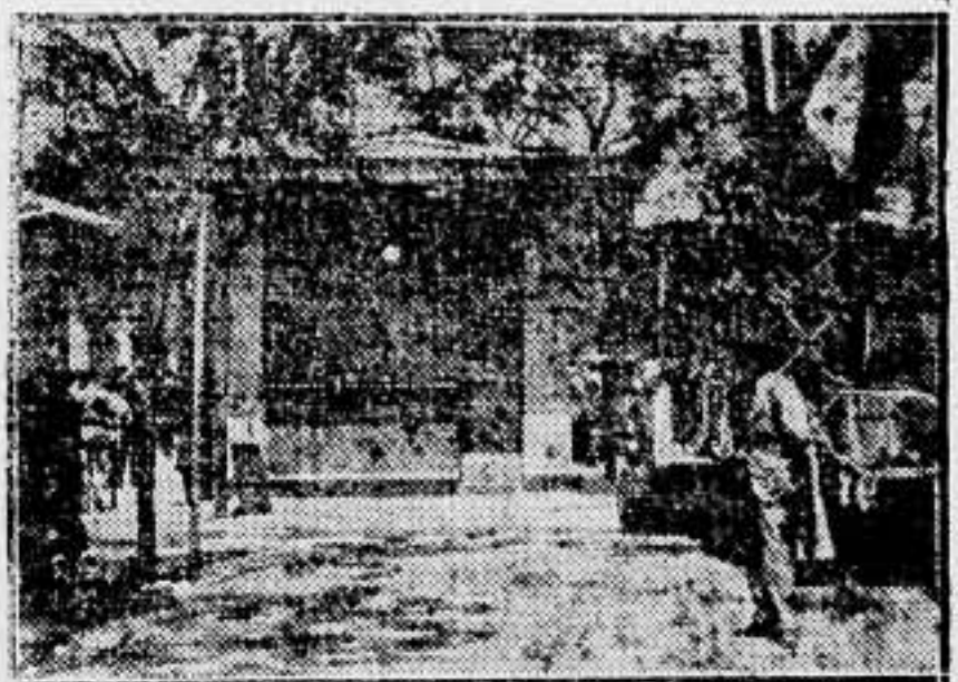
Un aspecto del paro, que ha sido general, con cierre de establecimientos.