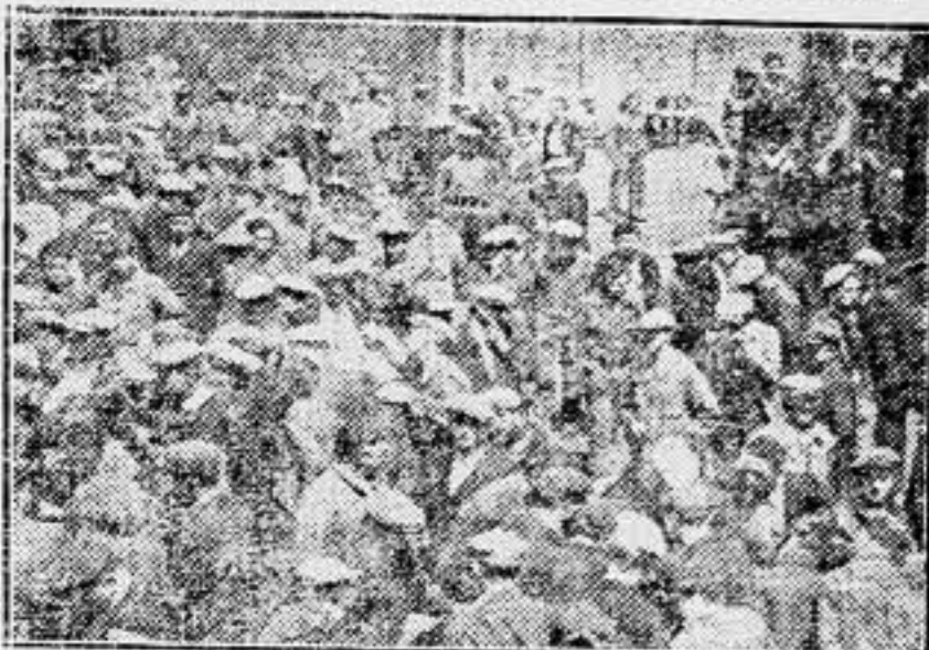
He aquí la fábrica Renault, paralizada. Los huelguistas comentan el curso de la huelga.