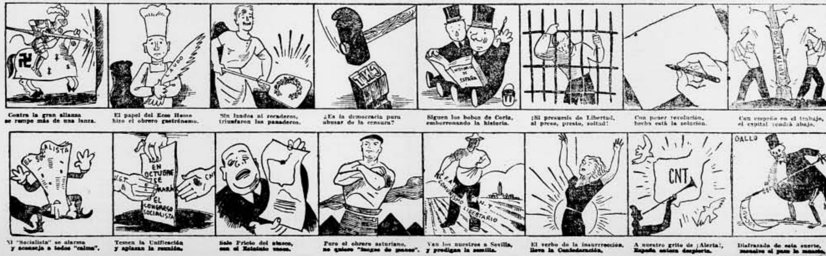
Contra la gran alianza se rompe más de una lanza. El papel del Eco Herra hizo el obrero gastrónomo. Sin fondos ni recaderos, transfirieron los panaderos. ¿Es la democracia pura abusar de la censura? Siguen los bobos de Coria, emborronando la historia. ¡Ni presunción de Libertad, al preso, presto, soltad! Con poner revolución, hecha está la solución. Con ruego en el trabajo, el capital vendrá abajo. El «Socialista» se alarma y aconseja a todos «calma». Temen la Unificación y aplazan la reunión. Sale Prieto del abasco, con el Estatuto vases. Pero el obrero asturiano, no quiere «juego de poner». Van los nuestros a Sevilla, y predigan la sumilla. El verbo de la insurrección, lleva la Confederación. A nuestro grito de ¡Alerta!, España entera despierta. Dilapidada de esta suerte, sucesivo el paso le muerde.

¡Obreros harineros, continuad con vuestra perfecta indiferencia como hasta el momento, y nadie os podrá arrebatár el triunfo que tenéis sobradamente merecido!