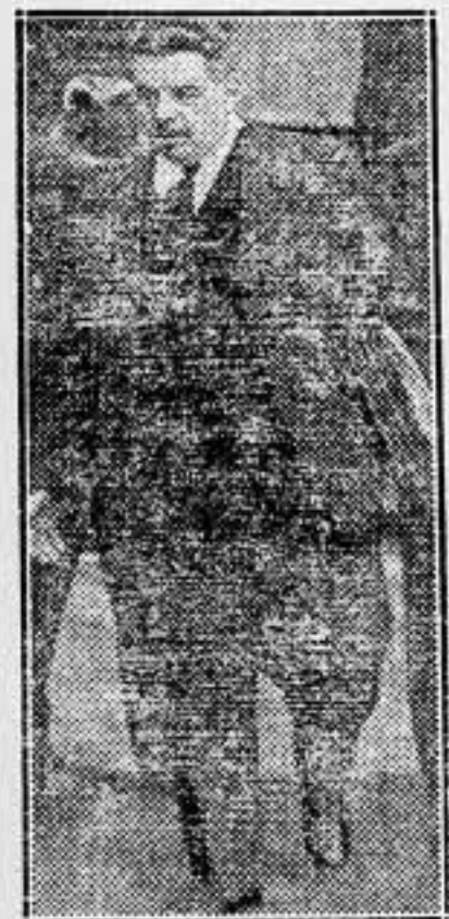
El alcalde de Lyon ha subido en categoría. Ahora es el presidente de la Cámara francesa.