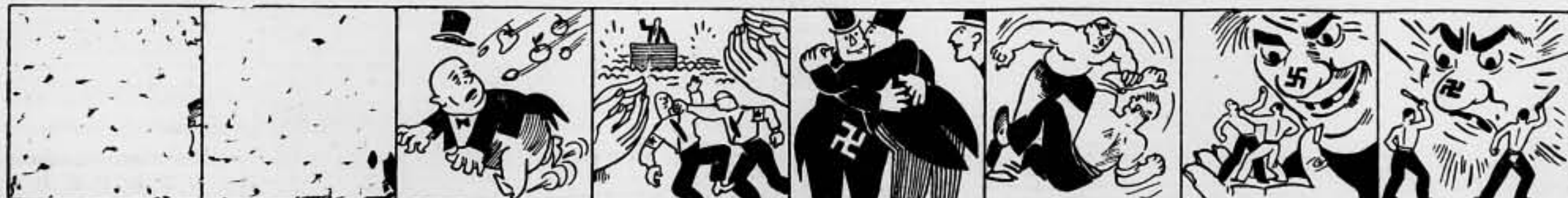
En Kaja, se vio Prieto metido en un gran aprieto