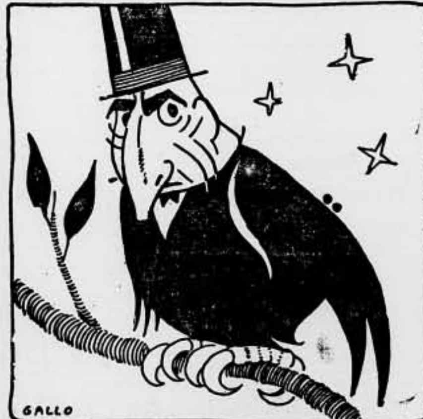
¡Ingratos! Hago el sacrificio de representarlos, y luego me complican la vida con tanta huelga.