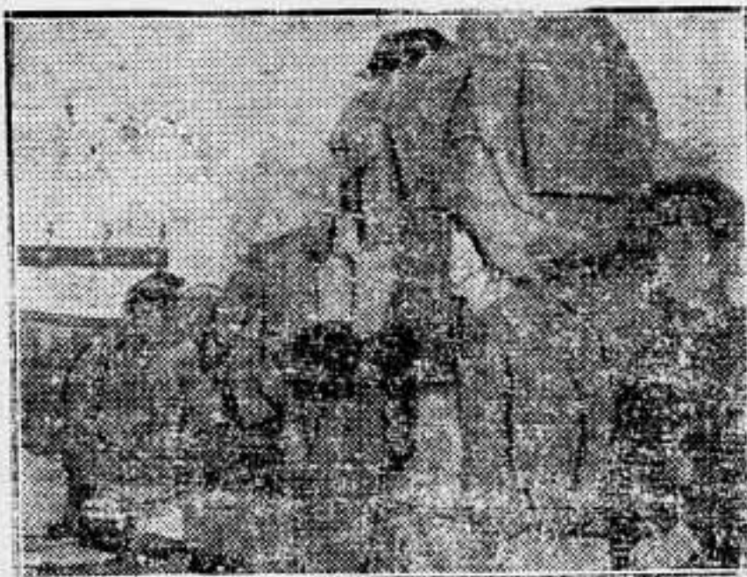
Se ha descubierto un depósito de uniformes de la Guardia civil, preparados por elementos reaccionarios, con vistas a un golpe de Estado. Los uniformes fueron fabricados en Zaragoza y encontrados en Madrid, en casa de un tradicionalista.