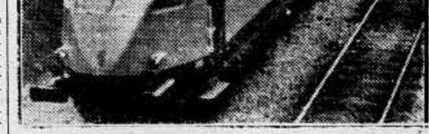
Entre Milán y Bologna ha sido puesto en servicio el primer tren aerodinámico, que alcanza una velocidad de 200 kilómetros por hora.