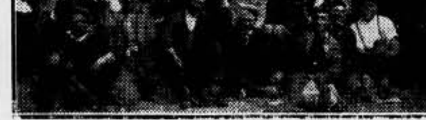
Los obreros que trabajan en la construcción de la Exposición Internacional de 1937 se han declarado en huelga. He aquí un grupo de huelguistas. Al fondo la torre Eiffel.

LOS OBREROS DE LA CONSTRUCCION DE LA EXPOSICION DE 1937 ESTAN EN HUELGA