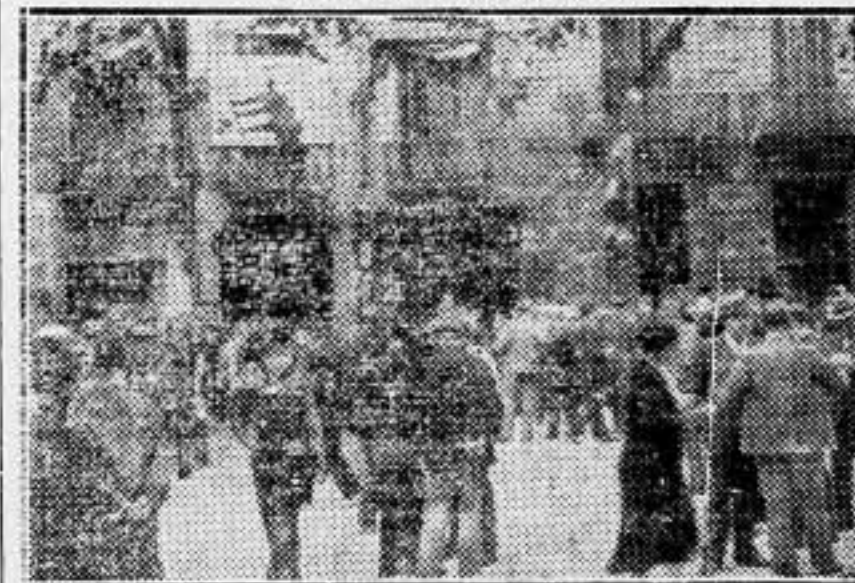
Los huelguistas desfilan y comentan ante el local del C. A. D. C. I., sin ser molestados por nadie.