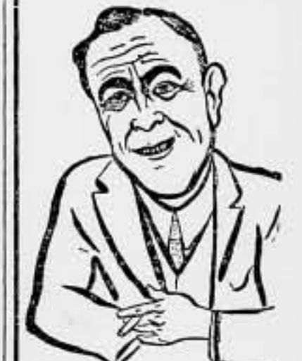
dirse a favor del actual presidente del suelo yanqui.

Durante estos últimos años ha variado ostensiblemente el barómetro de la política norteamericana. La lucha entablada entre los distintos candidatos que aspiran al sillón presidencial, parece deci-