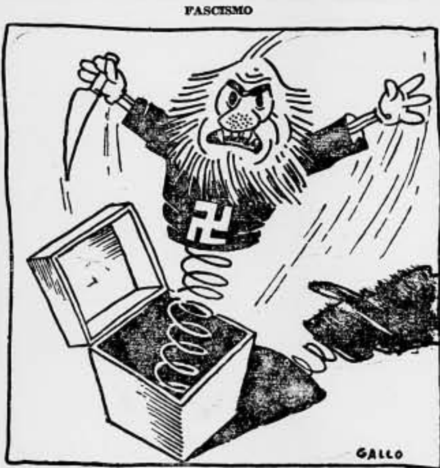
Hay que cerrar la caja, camaradas.

Málaga, 19. — Se han firmado, al fin, las nuevas bases de Prensa, con lo que se ha dado por terminado el conflicto planteado desde hacía diez días. Mañana reaparecerán los periódicos locales, una vez solucionada otra cuestión con los vendedores, a los que se dará mañana el 50 por 100 de la venta, para indemnizarlos de la forzosa inactividad de estos días.