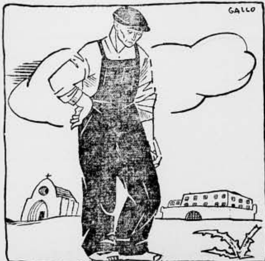
¡Qué desgracia! Dicen que la Anarquía reina en España, y yo no la veo.

Este número de SOLIDARIDAD OBRERA, ha sido visado por la censura gubernativa