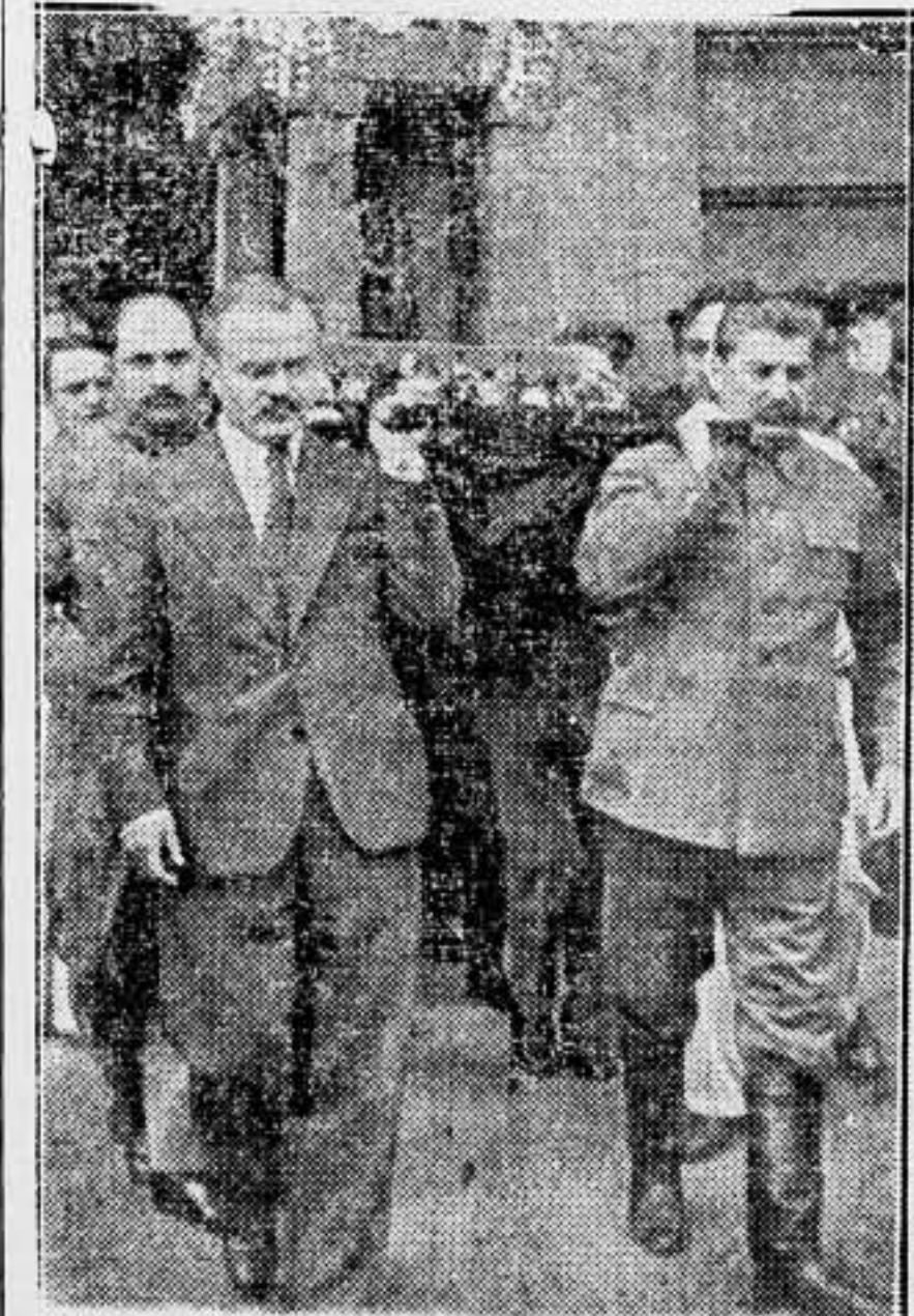
En el traslado de las cenizas de Máximo Gorki intervinieron Sialta y otros personajes de la Rusia soviética.

Sevilla, 24. — Después de las doce de la noche han salido para Huelva, con motivo de haberse declarado allí la huelga general por solidaridad con los obreros huelguistas de Riotinto, fuerzas de la Guardia Civil, de Seguridad