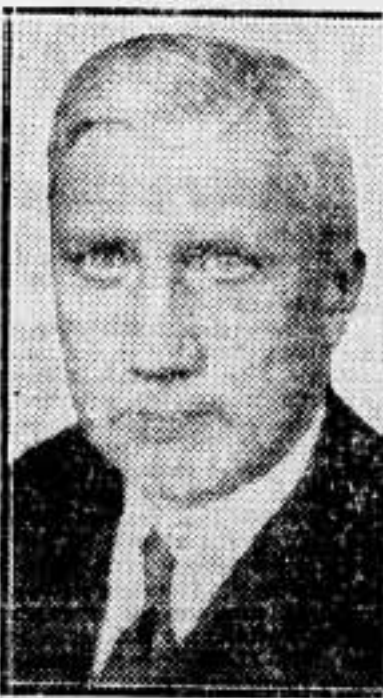
Consejero de Estado alemán, que acaba de fallecer.

Las ideas no se vencen con procedimientos de fuerza. Máximo Gorki