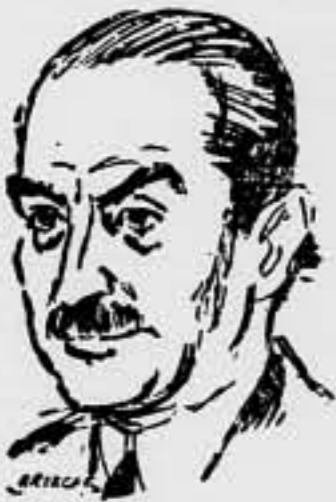
DON MIGUEL MAURA

El jefe del Partido Conservador, ha trazado desde el periódico local, "La Vanguardia", un amplio bosquejo de las incidencias republicanas. Miguel Maura ha hecho un capcioso examen desde el infantamiento de la República del 14 de abril hasta la hora presente.