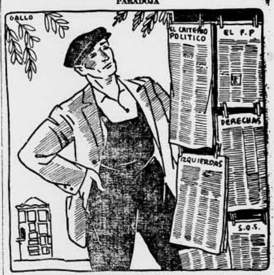
¡Pobre gente! ¡Qué anárquico criterio tienen de nuestra Anarquía!