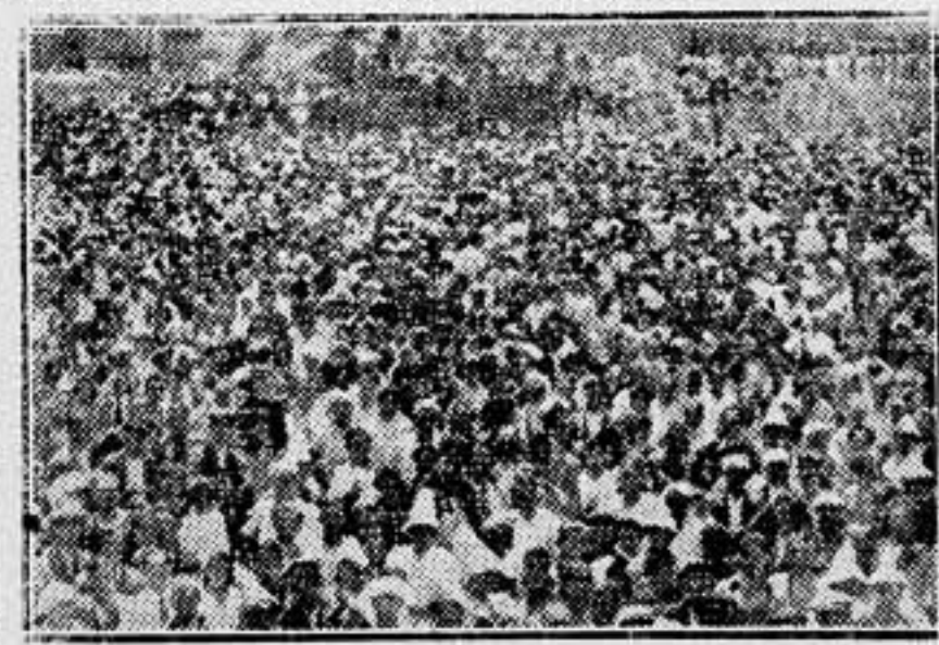
Aspecto del solar donde estuvo el Colegio de las Marnillas, de Madrid, durante la asamblea convocada por la C. N. T. para tomar acuerdos acerca de la huelga de la Construcción.

no comueven su cuerpo de hierro. El proletariado moderno afirma su voluntad de ser, y defenderá su libertad y su vida hasta la muerte. Como los bravos montañeses cantábricos y astures, en su lucha contra el imperio romano, cuando Roma era dueña del mundo, convertirá las montañas de Iberia en el último baluarte de las libertades del pueblo.