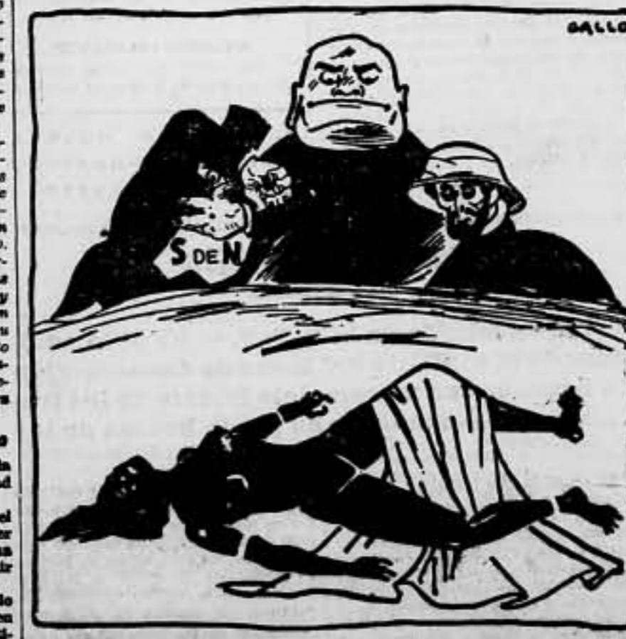
Entra todos lo mataron, y ella sola se quedó.

federación Nacional del Trabajo! ¡Viva el Comunismo Libertario! El Comité Nacional Madrid, 27 de junio de 1936.