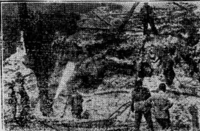
El cuartel de Intendencia ha sido destruido por un voraz incendio, sin que se sepan las causas del accidente.