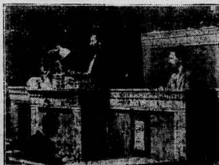
He aquí la figura melodramáticamente seria y grave del que se titula rey de reyes, leyendo su discurso de protesta ante la Sociedad de Naciones.