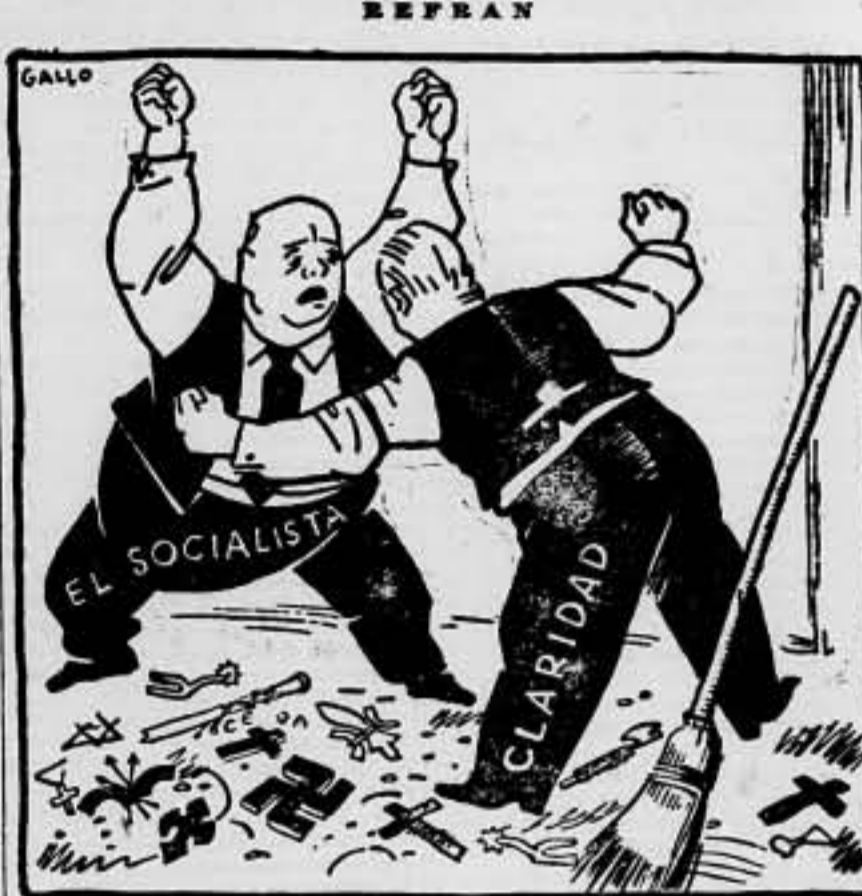
El uno por el otro, la casa sin barrer.

ORAN, 2. — LOS SUCCESOS DE CARACTER POLITICO Y SOCIAL SE MULTIPLICAN EN ARGELIA. EN ESTA CIUDAD SE HA COMETIDO UN ATENTADO FRUSTRADO CONTRA EL ALCALDE ABATE LAMBERT. UN INDEVEDDO, DESDE UNA ESQUINA, LE HIZO VARIOS DESPARGOS DE REVOLVER, PUDIENDO SER DETENIDO POR UN AGENTE DE POLICIA. EN DISTINTOS PUNTOS DE LA CIUDAD SE HAN HECHO DISPAROS DE ARMA CORTA Y SE HA AFREDEADO A DESTACADAS PERSONALIDADES POLITICAS LOCALES.