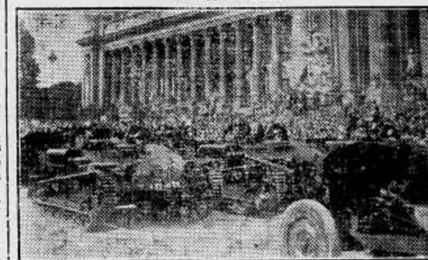
Tanques y soldados armados. La lección bélica. No hay más razón que la de la fuerza; ni otro espectáculo en todas las fiestas.