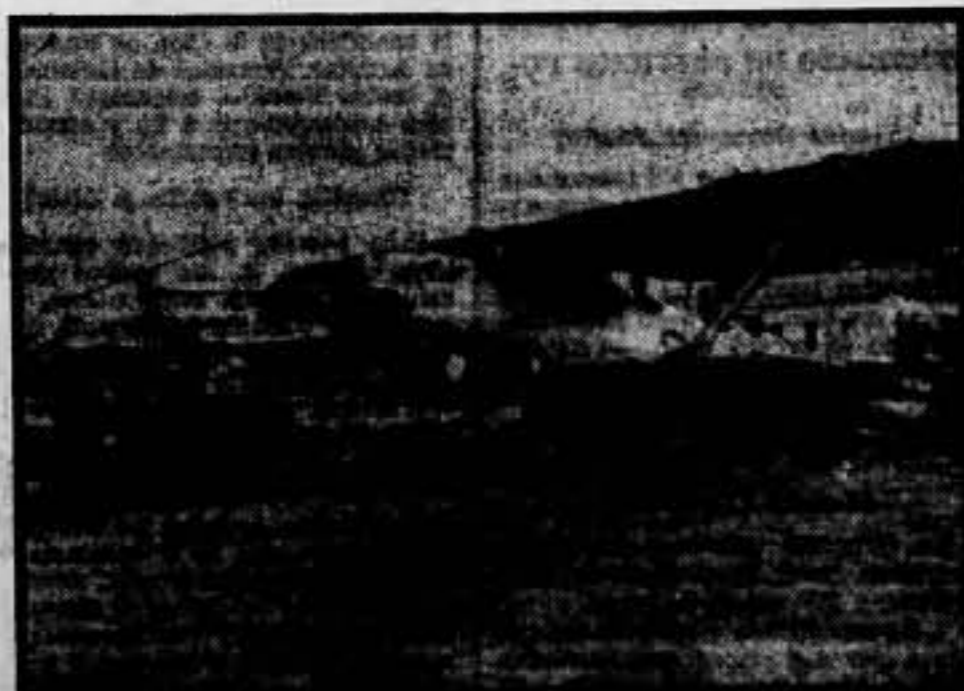
Preparando un avión para salir a bombardear a los rebeldes.

Los pilotos de Lérida y Barcelona luchan de una manera entusiasta y heroica contra el fascismo traidor y criminal.