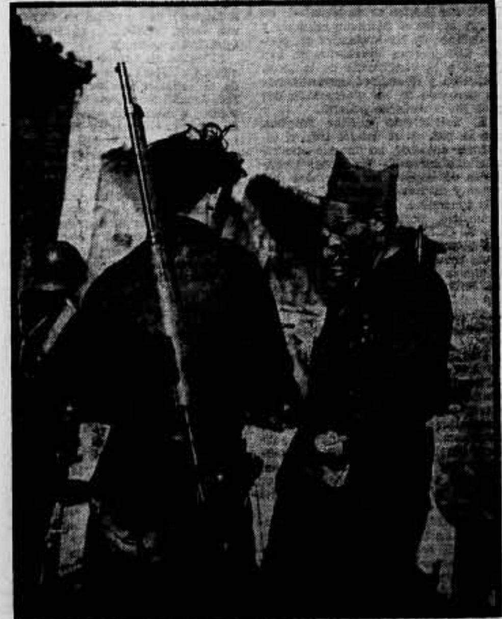
El camarada Durruti habla con los milicianos de su columna en el puente de Fina, camino de Zaragoza.