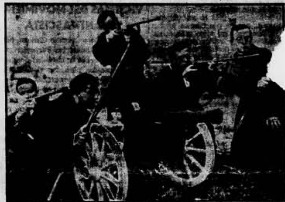
Los "representantes de Dios" en la tierra emplean también las armas. En un pueblo de Cataluña esos frailes hicieron frente al pueblo.