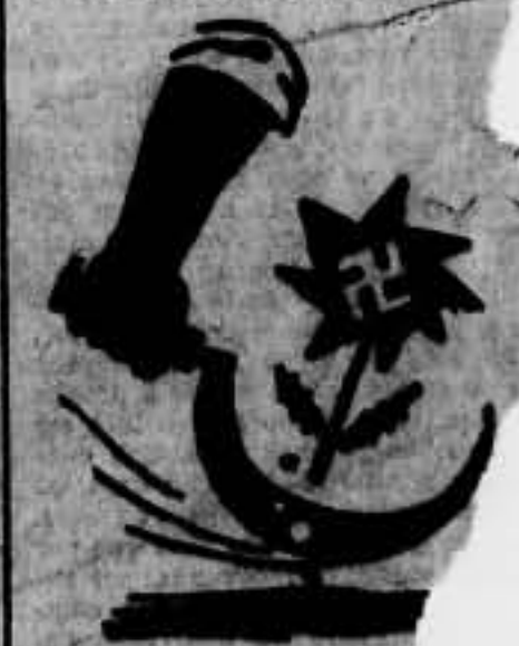
LA MALA NIÑA

Se están forjando las premisas de una guerra. La burocracia fascista chocaría con Francia, Inglaterra y la U. R. S. S. La suerte de Europa es incierta. Y la guerra se avocina a pasos agigantados.