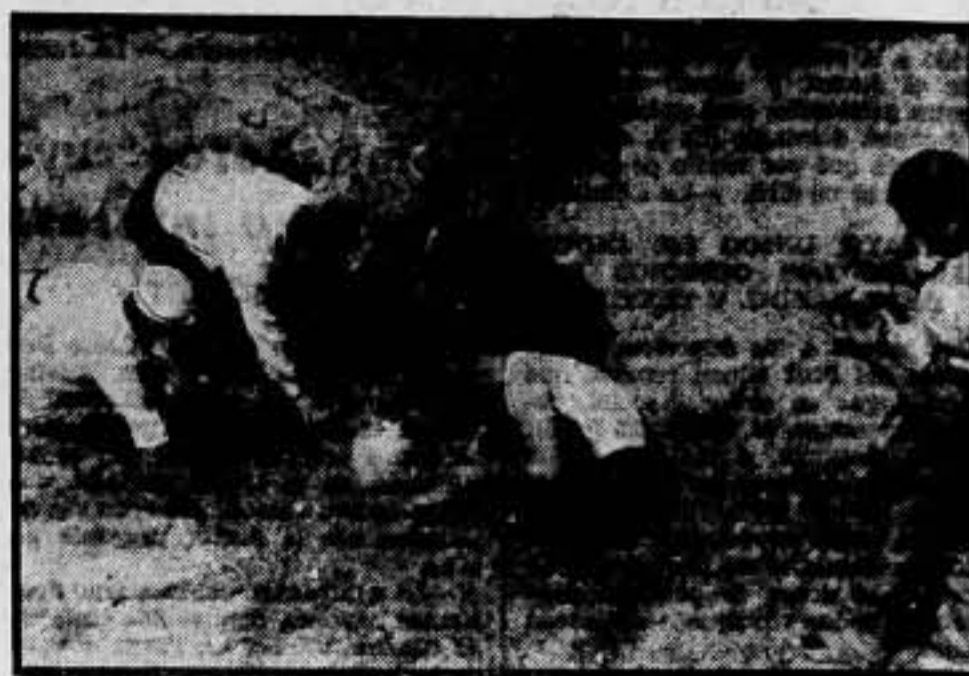
Compañeros bebiendo en un pequeño arroyo. No es que escasee el agua, pero cuando se presenta la ocasión de beber agua que no sea de balsa o de pozo, no hay duda de que se aprovecha.