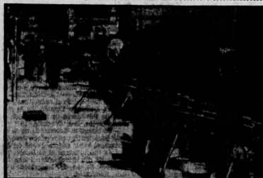
Plaza Mayor de Bujaraloz. — Concentración de ametralladoras en la Plaza Mayor de Bujaraloz.

Piensen y no permitan que les sea arrancado, no el Ritz, considerado como "tabú" máximo, sino otras cosas de mayor envergadura y que no es preciso enumerar.