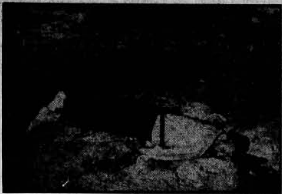
Frente de Bujaraloz. — Este compañero, que iba desarmado y formaba parte del personal de la ambulancia sanitaria, resultó muerto en el bombardeo de la misma.