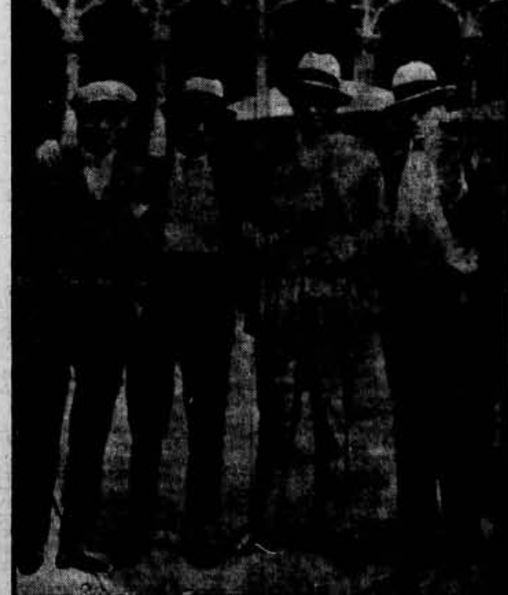
Nuestro malogrado camarada Francisco Ascaso (x), fotografiado en Bruselas (Bélgica), durante su exilio, acompañado de Durruti, Calleja y otro camarada de Madrid.

UNA FOTOGRAFIA DE ASCASO DURANTE SU EXILIO EN BRUSELAS EN EL AÑO 1929