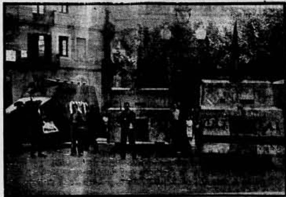
Tres automóviles blindados de la F. A. I.