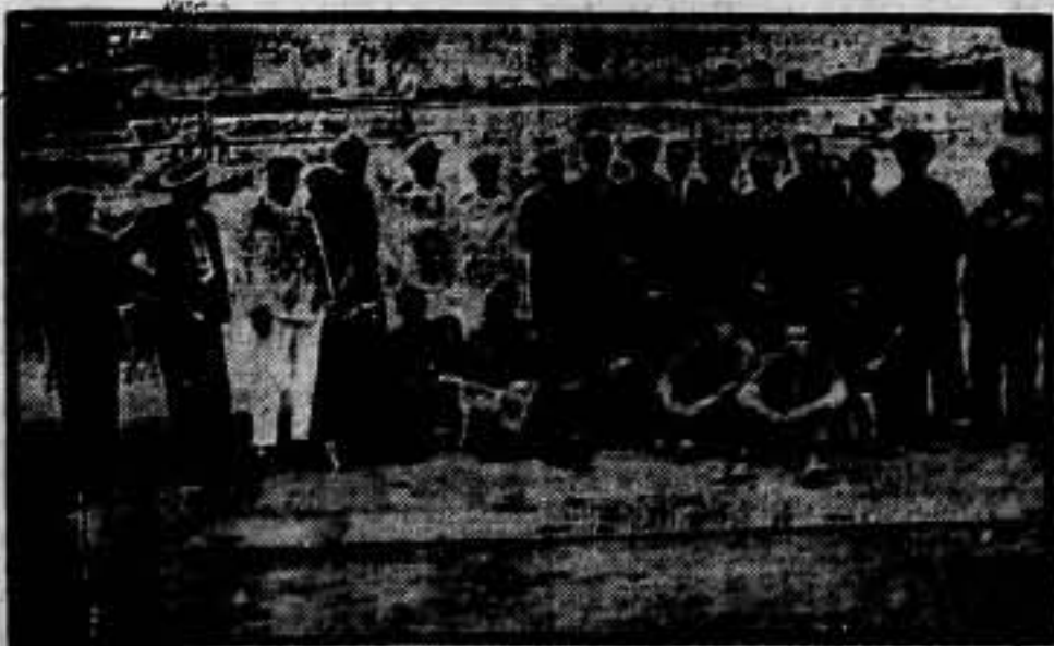
El equipo de la Aeronáutica Naval, que efectúa el bombardeo de Mallorca.