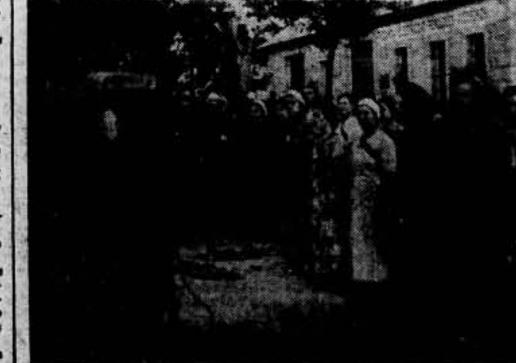
Llegada a Villalba de la columna que viene de Quintanar de la Orden para reforzar a sus compañeros que se encuentran en el frente.