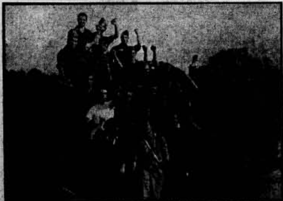
Una batería de milicianos al lado de la segunda pieza, en preparación para la columna.