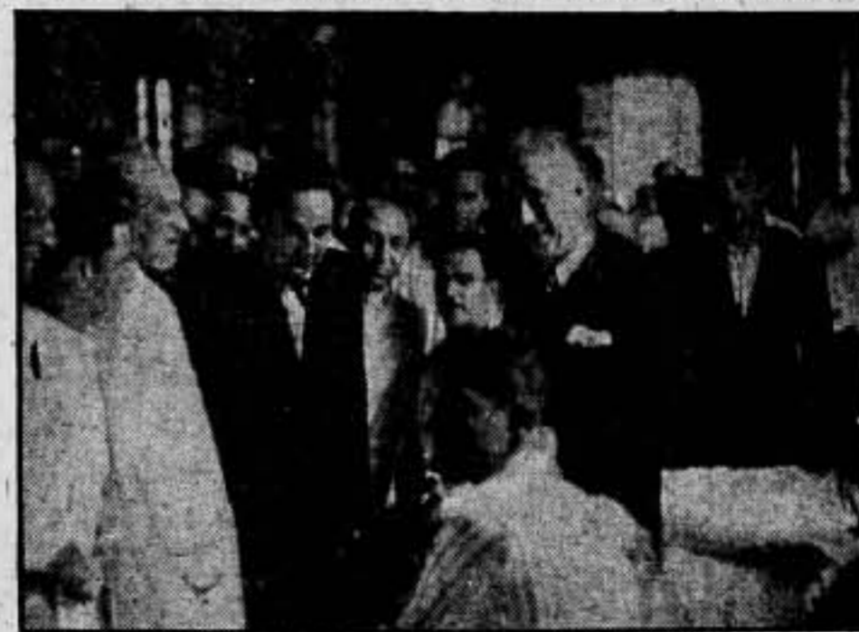
El presidente de la Generalitat, en su visita a los heridos.