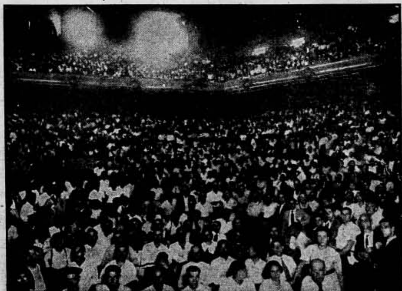
La sala del Olympia completamente abarrotada de compañeros

Republicanos de España; comunistas, hombres sin partido, socialistas, hombres todos, la C. N. T. y la Federación Anarquista Ibérica, con su conducta de sensatez y de comprensión de los problemas del momento,