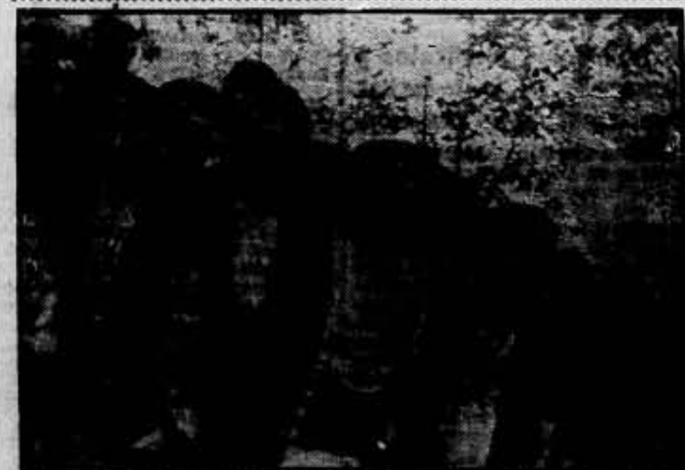
Un grupo de los fugados de Zaragoza, en Sarriena.