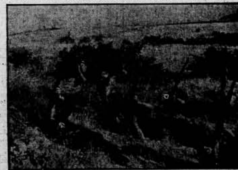
En las avanzadas del frente andaluz, los milicianos hacen fuego contra un avión fascista que volaba sobre nuestras líneas.