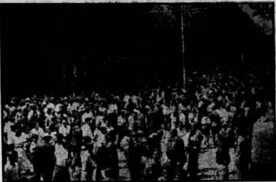
Salida del mitin.