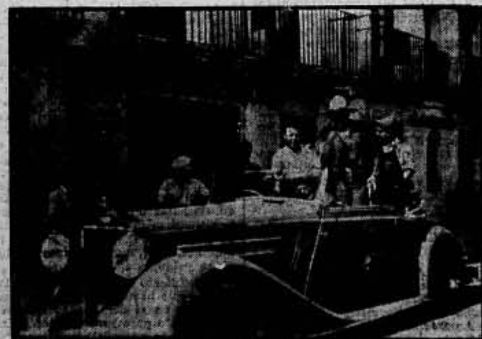
Locustación de la sucursal del Banco de Aragón, en Fraga.