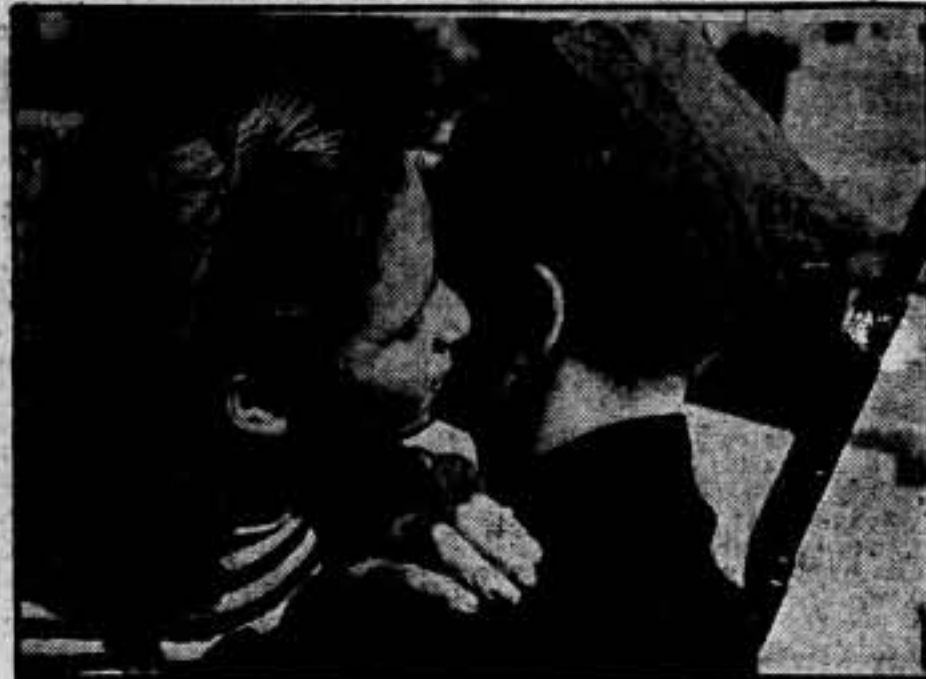
La compañera abraza al ser querido que abandonando hogar hijos y comodidades, va al frente de batalla, a ofrendar su vida por la libertad y por la justicia