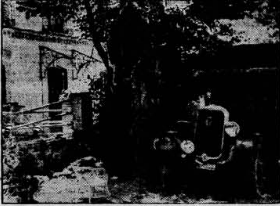
Destrozados causados en un árbol y un camión por el bombardeo de la aviación republicana.

LOS BOMBARDEOS DE LA AVIACION ANTIFASCISTA EN GUADARRAMA