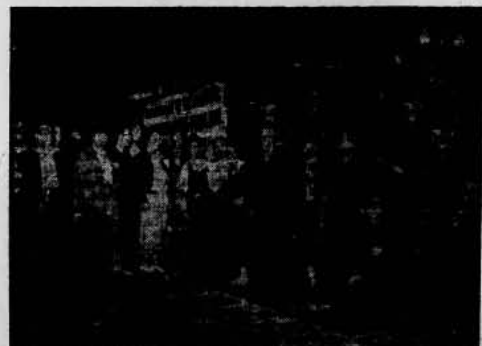
Llegada a nuestra ciudad de los dos camiones con víveres, por valor de 64.000 francos, y donación de los propios camiones, ofrecida que hace el Frente Popular Francés.