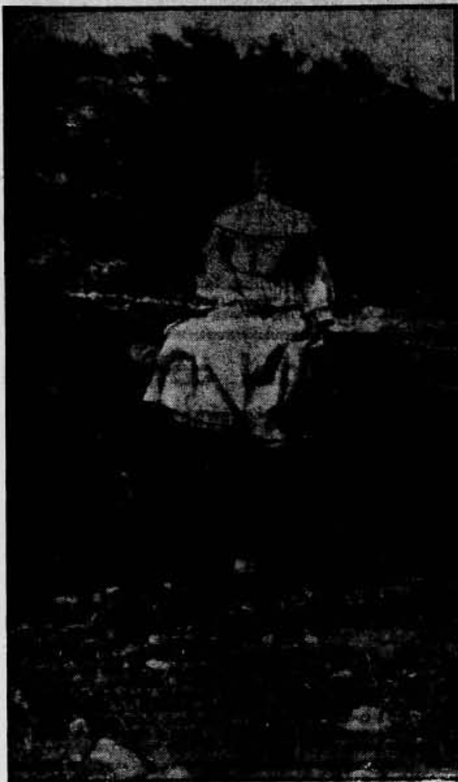
En un registro efectuado en un convento se encontró esta fotografía. Estaba dedicada a la hermana de la fotografiada, y acababa diciendo: "¡Verdad que estoy linda?" No todo era misticismo en los conventos. Había sus ratos de humorismo...