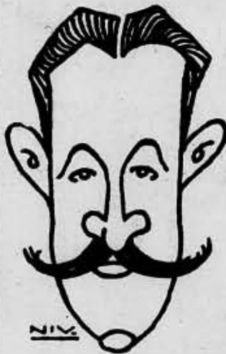
GONZALO QUEIPO DE LLANO

Es un generalote republicano. Así reza su hoja de servicios. Ocupó el cargo de jefe militar de la residencia del primer presidente de la República. Se ha levantado en armas contra la clase trabajadora.