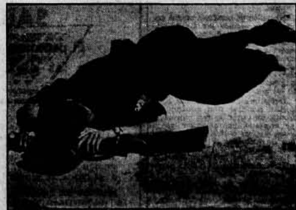
Un miliciano quedó así tumbado para siempre en la refriega del domingo, día 19 de julio.