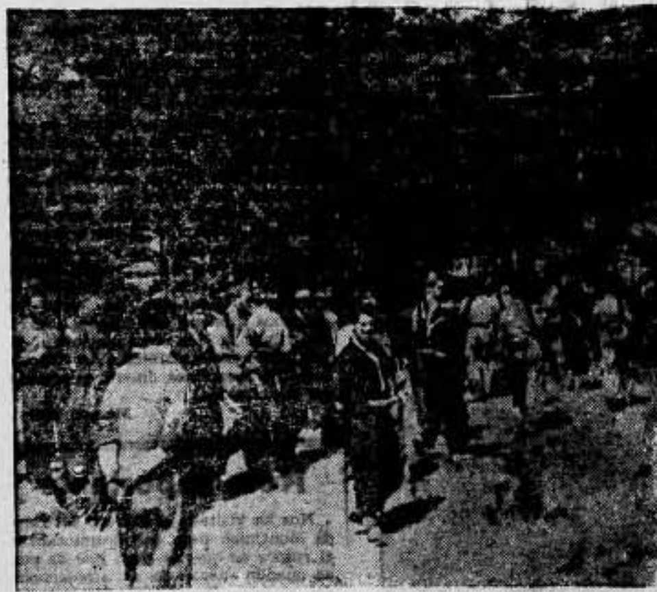
Milicianos que suben a relevar a los que se encuentran en las líneas de avanzada, dirigiéndose hacia ellas. (Express-Foto).

DIRIGIENDOSE A RELEVAR A LOS QUE LUCHAN (PEGUERINOS)