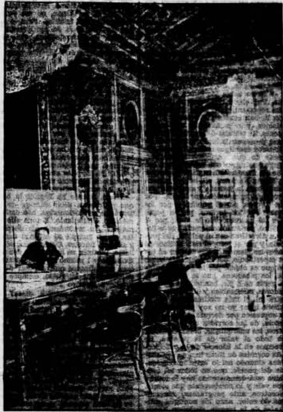
Un aspecto de la sala del Consejo. Antes gran salón del trono.

Se rindió Goded. En uno de los rincones de la fotografía que publicamos del patio de Capitanía fué rodeado por nuestros milicianos el general que capitaneaba las fuerzas sublevadas. Nuestros camaradas fueron muy generosos. Respetaron la vida de la mayoría de los detenidos. Un montón de capitanes y tenientes fueron escoltados por los guardias de Asalto y conducidos a lugar seguro. En aquel instante debían ser ejecutados.