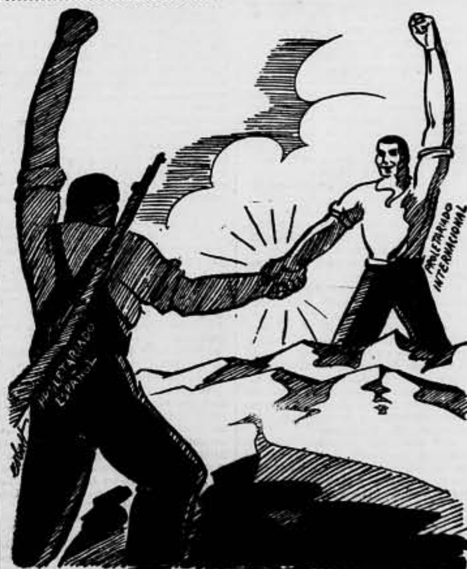
¡Solidaridad!, arma invencible del proletariado.

Sin embargo, el proletariado español, el de todo el mundo, movido por altos ideales humanos, no siente estas venganzas tremendas. Su gloria mayor será, después, poder pregonar a los cuatro puntos cardinales que ha sabido vencer sin crueldad y sin sadismo de ninguna especie. He aquí lo indestructible de sus principios perfectos; la eternidad inmensa de sus esencias inmortales. Al liquidarse estas cuentas de sangre y de ferocidad, el mundo entero sabrá quiénes fueron las víctimas y quiénes fueron los victimarios; quiénes fueron los mártires, y quiénes los pretores. Y el oprobio universal caerá, como el fuego impenitente y execrable, sobre los que en la plaza de toros de Badajoz, masacraron a los héroes con un refinamiento de crueldad, no conocido ni sospechado en las interminables listas de suplicios que registra la España inquisitorial de Calomarde y de Arlegui.