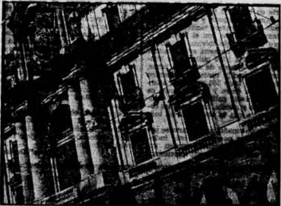
Los principales desperfectos ocasionados por los asaltos de la vieja Capitanía.