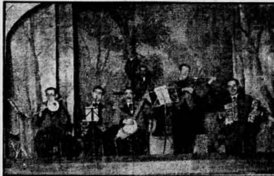
Orquesta de Roda de Ter, que amenizó los bailes que se celebraron en dicha localidad para recaudar fondos para los hospitales de sangre, y obteniendo la bendita suma de 328'70 pesetas.

en la lucha con los facciosos criminales.