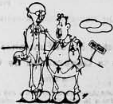
MARCHE Y GIL ROBLE

Palabras de censura no han de faltar para aquellas otras que, con deseos deamedidos y propósitos indignos, se enrolan en las milicias para llevar a cabo una obra destructora y repuliva en las filas de nuestros bravos. A ésa, nuestra condenación por su conducta indigna; a ésa, nuestra más enérgica protesta y solicitando se ausenten de esos frentes donde la labor abnegada, heroica y sublime de nuestros camaradas, puede verse mancillada por los aptos repulivos que cometen esas mujeres indignas.