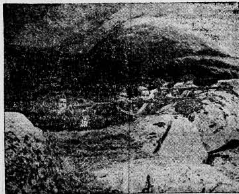
Milicianos parapetados bajo una de las curvas del frente de Peguerinos, haciendo fuego sobre los facciosos.