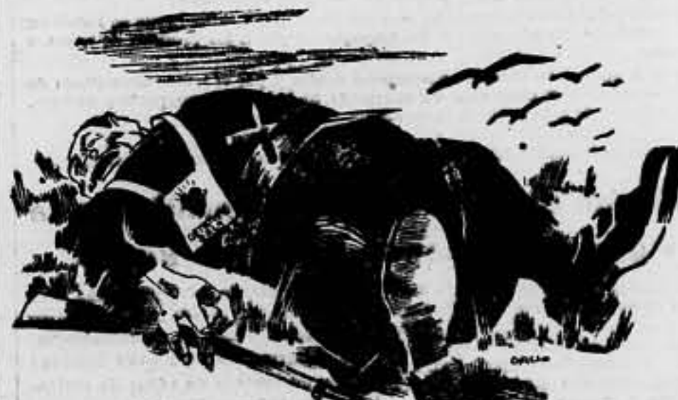
Se le envió al "cielo", y no dió ni las gracias.