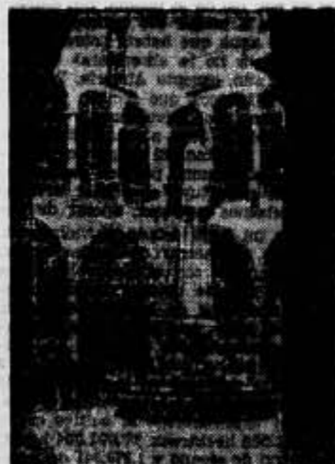
El patio de la Capitanía, de donde salieron detenidos los cabecillas del movimiento fascista.

Nuestros lectores podrán constatar por las fotografías que publicamos la pericia de nuestros improvisados artilleros. Los impactos son visibles. Una columna está casi cuarteada.