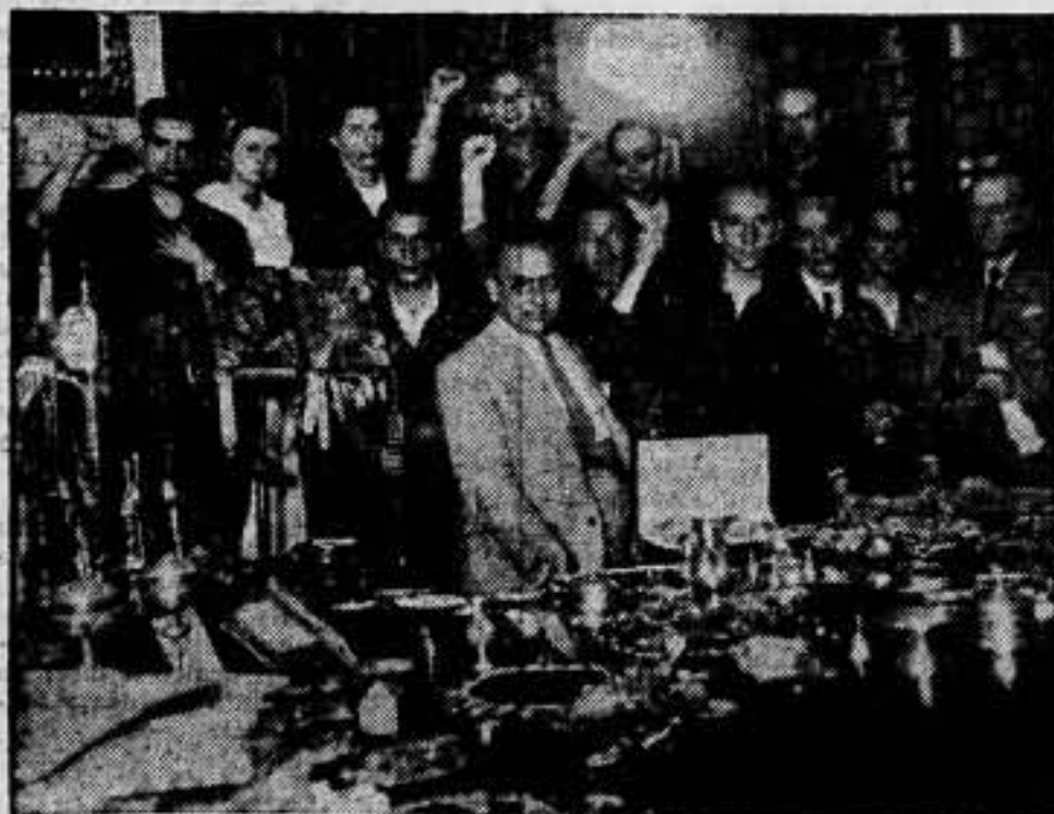
En los registros efectuados por las milicias del Circulo Socialista del Sur en el convento de las Hijas de la Caridad de San Vicente de Paúl, han sido hallados tres millones de pesetas en papel del Estado, billetes de Banco, objetos de culto y otros valores. El presidente de la Diputación y los milicianos en el momento de realizar el inventario del hallazgo.