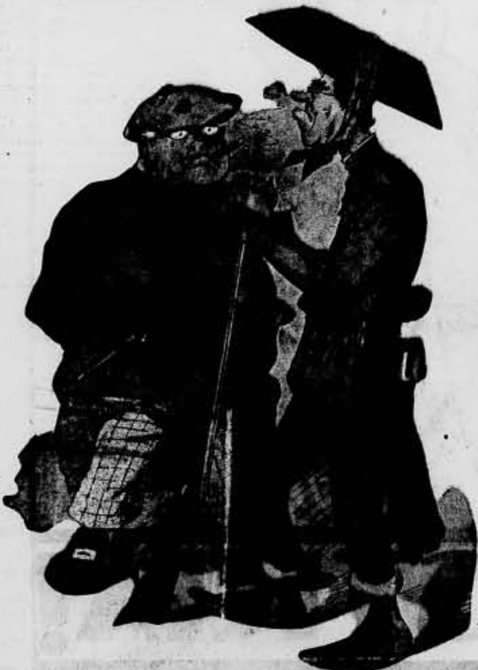
—Dispuestos a mandar alma al otro mundo, con el piadoso fin de que no paguen en éste.