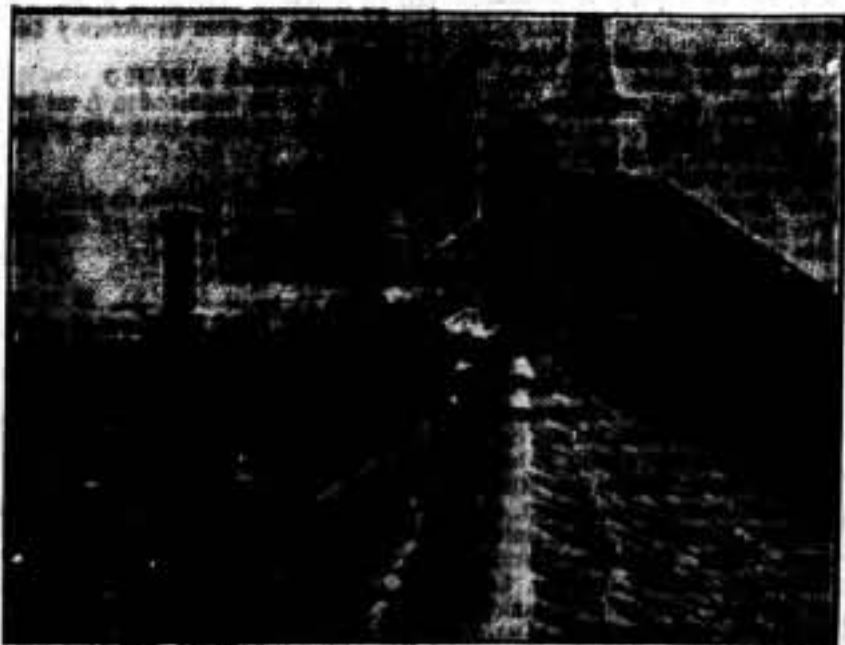
Desde los tejados de las casas más altas de las ciudades extremas, nuestros soldados hostilizan sin cesar al enemigo.