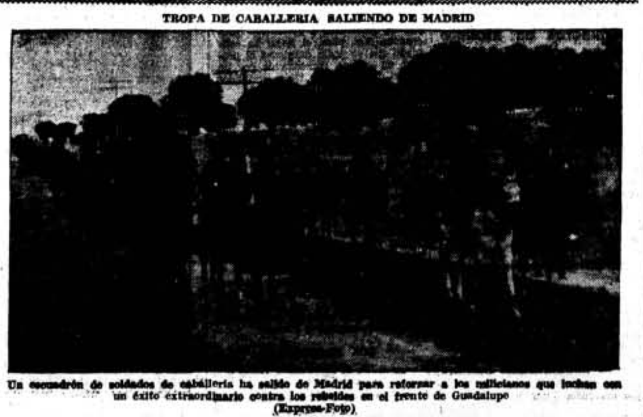
Un escuadrón de soldados de caballería ha salido de Madrid para reforzar a los milicianos que luchan con un éxito extraordinario contra los rebeldes en el frente de Guadalupe.

Nos comunica el Comité del F. C. Barcelona que con objeto de dar las máximas facilidades a todos aquellos simpatizantes de dicho Club para que puedan ingresar como socios del mismo, que durante el presente mes quedan suprimidos los derechos de entrada, y que la cuota para los infantiles, hasta la edad de 15 años, será la mitad de la ordinaria. Con estas ventajas se continúa manteniendo y acrecentando la popularidad del F. C. Barcelona, que así abre sus puertas a todos los deportistas y admiradores.