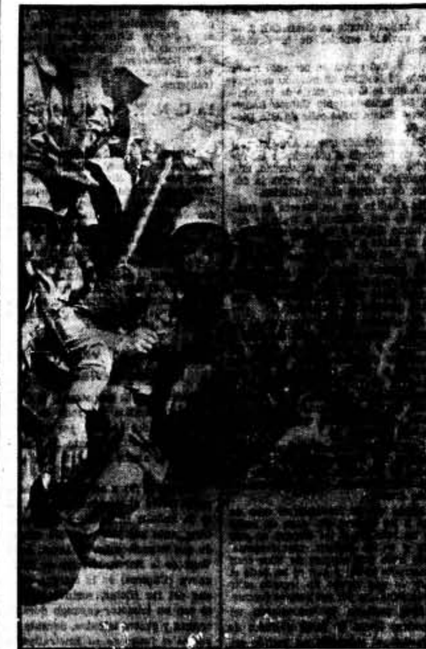
Amor, guerrera nueva, marca francesa, que un sargento de Chiciana tomó a un fascista...