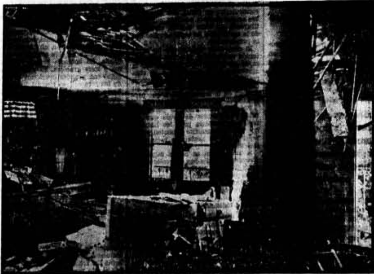
Cómo ha dejado una casa de Irún la furia fascista

Importe del quince por ciento de los jornales, 3,594'10 pesetas; los obreros de la fábrica Miret, 7,224'90; el Comité Local, 536'20 pesetas. Total, 6,365'20 pesetas.