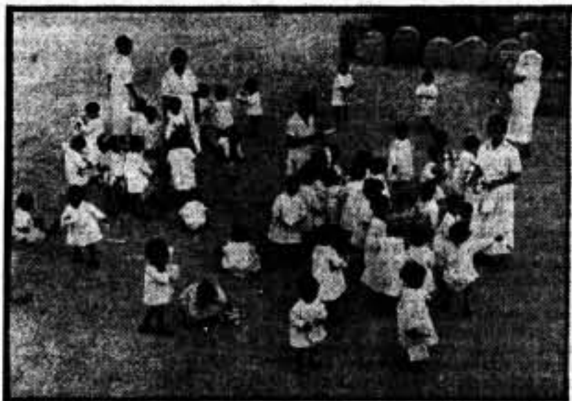
Los chiquitines con sus juguetes. No les faltan solicitudes. Ellos no vivirán ya la era inquisitorial, que murió para no volver...

Han mejorado mucho los novecientos chiquillos que se cobijan en estos