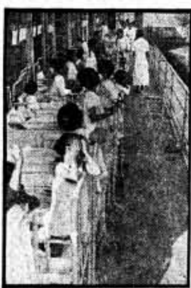
Galería de nuestros niños pretuberculosos, recibiendo las curaciones del sol y las solicitudes de nuestras compañeras anarquistas

diaba la "sociedad cristiana" y el único recurso de estas muchachitas, que querían vivir, era este: hacer la