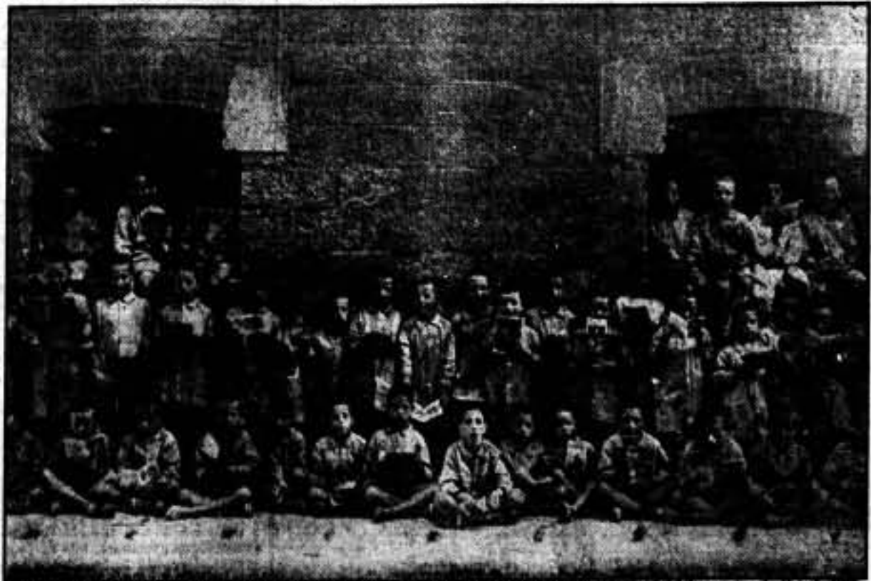
Los niños que formamos fuertes, borrando de su espíritu aquella pesadilla que las monjas fomentaban para impedir que los niños se desarrollaran, más hermanos y el mundo es nuestro.

Un hermano baluarte cayó en nuestro poder: este es nuestro mejor victoria.