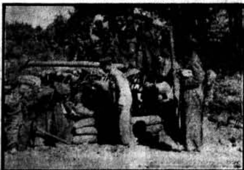
Los ingenieros construyendo parapetos en el puerto de Navarra.