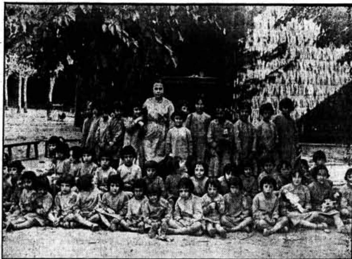
Las niñas que no supieron hasta ahora lo que fué amor de madre

—Las monjas regían esta Casa de Maternidad; las esposadas del Cristo (según decir suyo) habían olvidado por completo las lecciones de Jesús de Galilea, cuando, acusada la mujer adúltera por los sacerdotes de