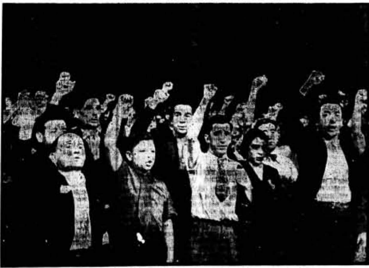
En el Velódromo de Invierno se ha celebrado un gran mitin en favor de los revolucionarios españoles. He

"The Daily Telegraph", diario londinense, comunica que el general Franco ha propuesto a una potencia extranjera fascista, la colonia española de Río de Oro, vecina en Marruecos de la zona francesa. Esta proposición, según el periódico inglés en cuestión, sería hecha a cambio de municiones. Asimismo Franco protege el movimiento nacionalista rifeño para obtener mediante esta protección, el apoyo de todas las tribus del Rif español. El fascismo, en su lucha salvaje, recurre a todos los procedimientos de chantaje-conocidos.