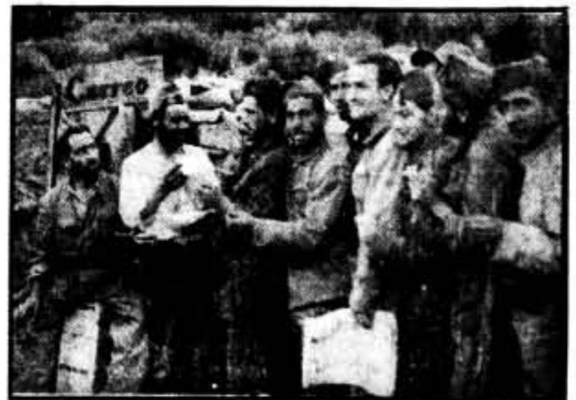
La hora del correo en las avanzadas del puerto de Navarría.