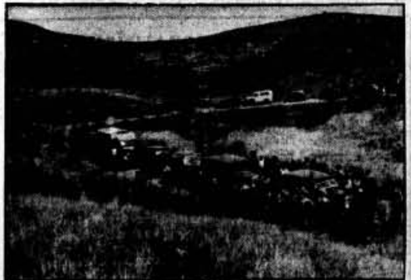
El avance de nuestras columnas.