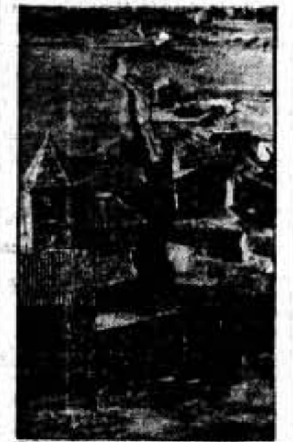
Vista de Angüés, otro pueblo donde se hizo un descanso

EL AVANCE DE LA COLUMNA DURRUTI HACIA ZARAGOZA