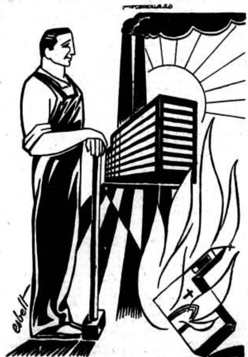
Por cada iglesia quemada, dos fábricas levantadas.