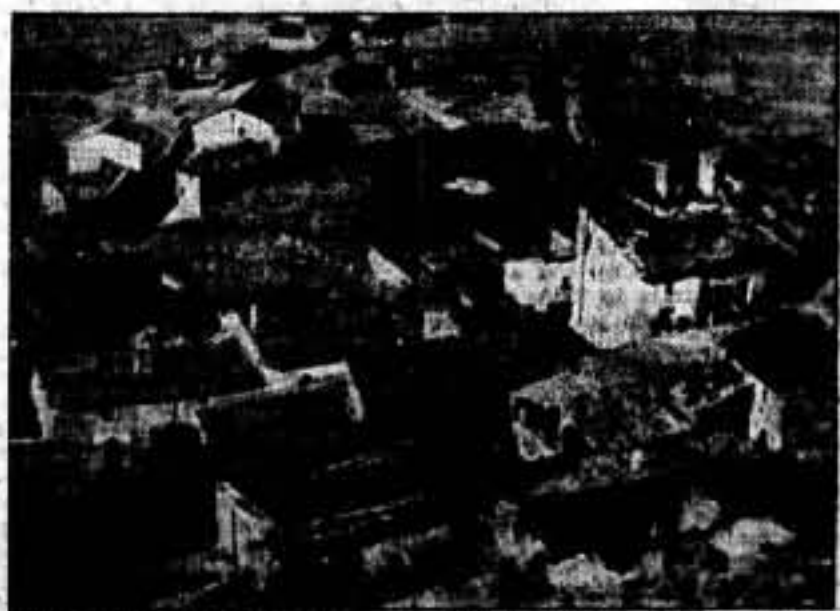
Una vista del pueblo de Vaila, desde el cerro de San Mateo.