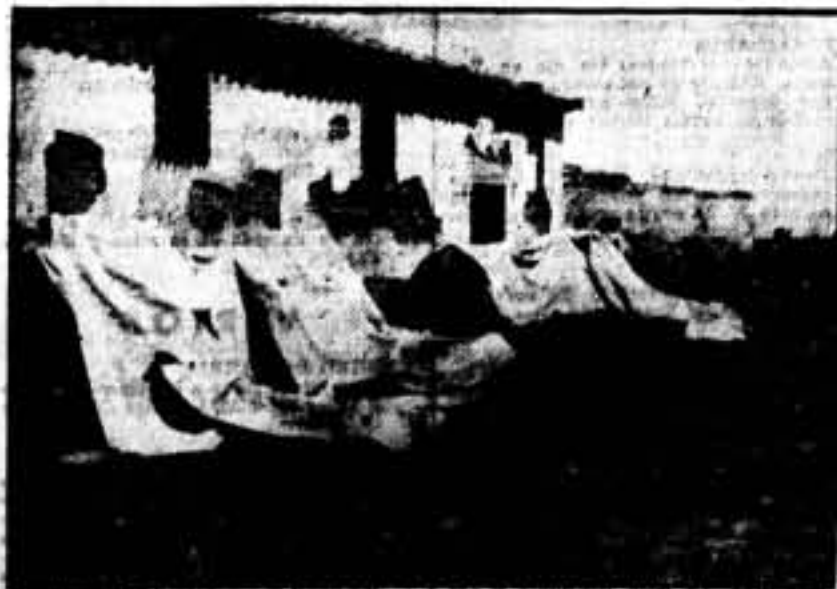
Figura. — Unas baterías escondidas, en preparación a los ataques aéreos.