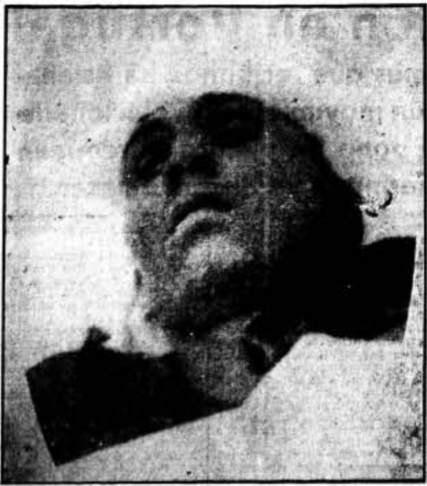
El Sindicato Nacional del Transporte Marítimo, ruega a todos los camaradas la identificación de este compañero, que fué herido en Punta Amer y murió en Mahón. Informar al referido Sindicato, Plaza del Teatro, 3. Barcelona.