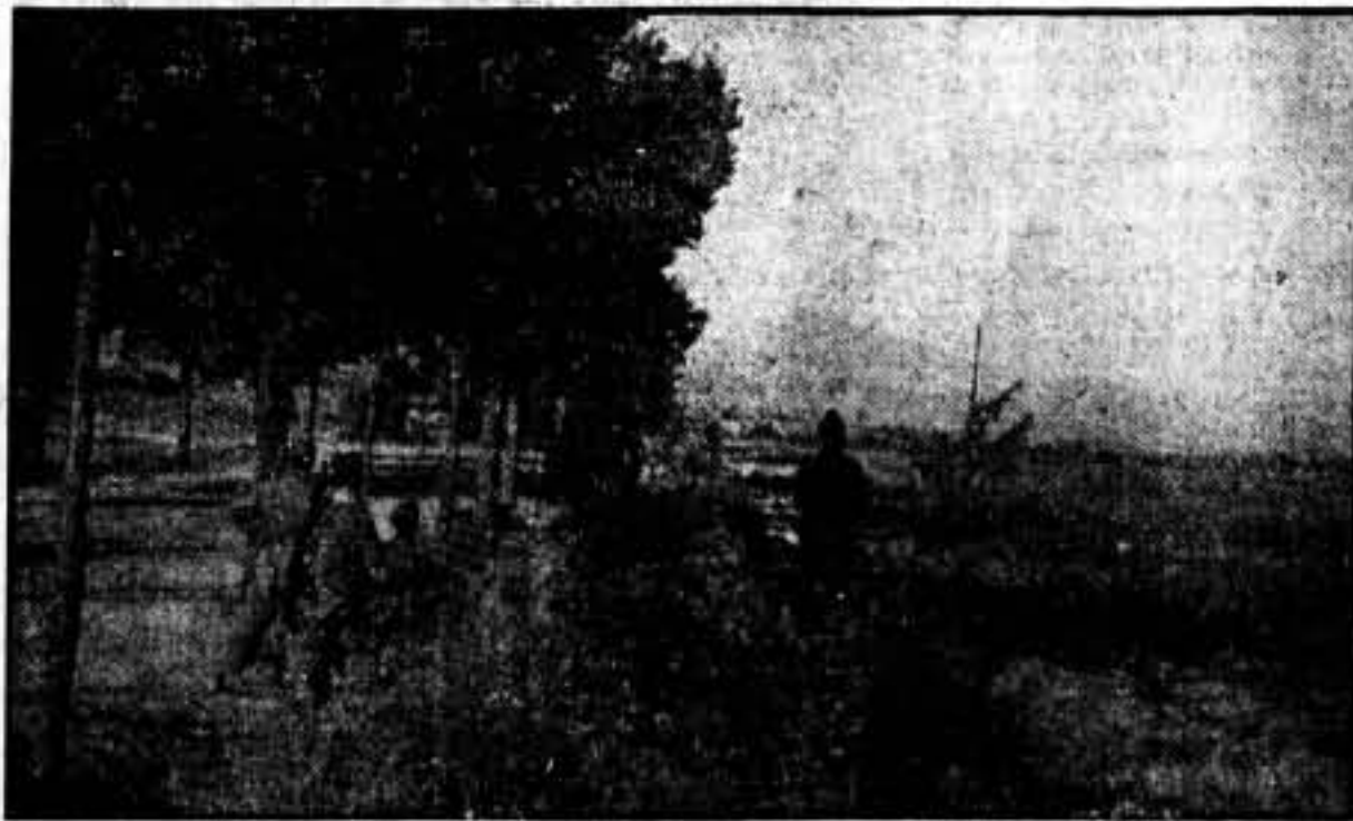
A selcientos metros de Huesca, los observadores vigilan alegre