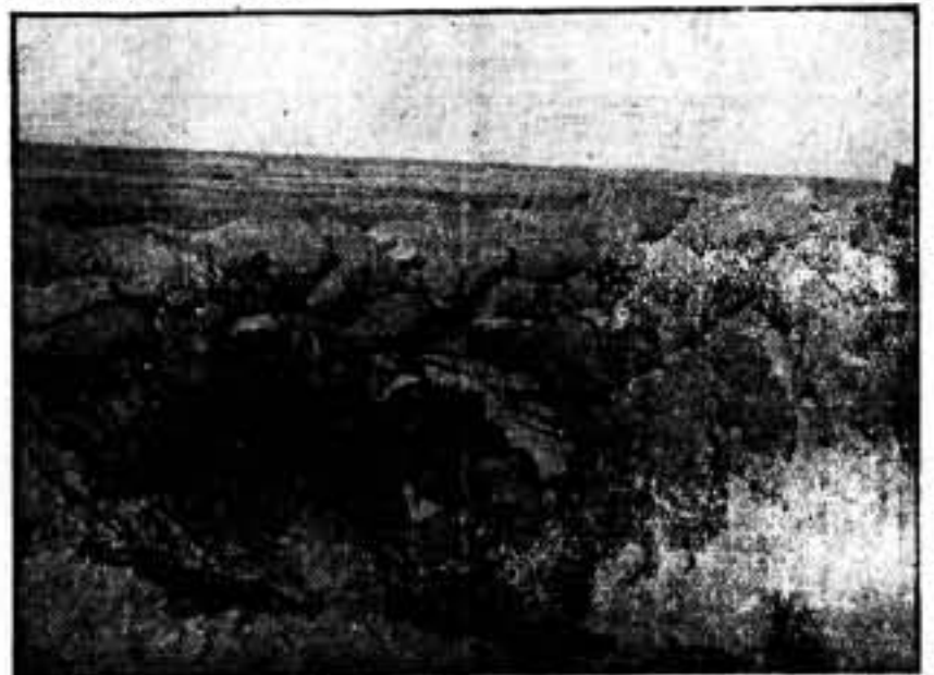
En las avanzadillas de Almudévar.