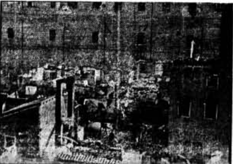
Vista panorámica del Alcazar de Toledo y Gobierno Militar, destruido.