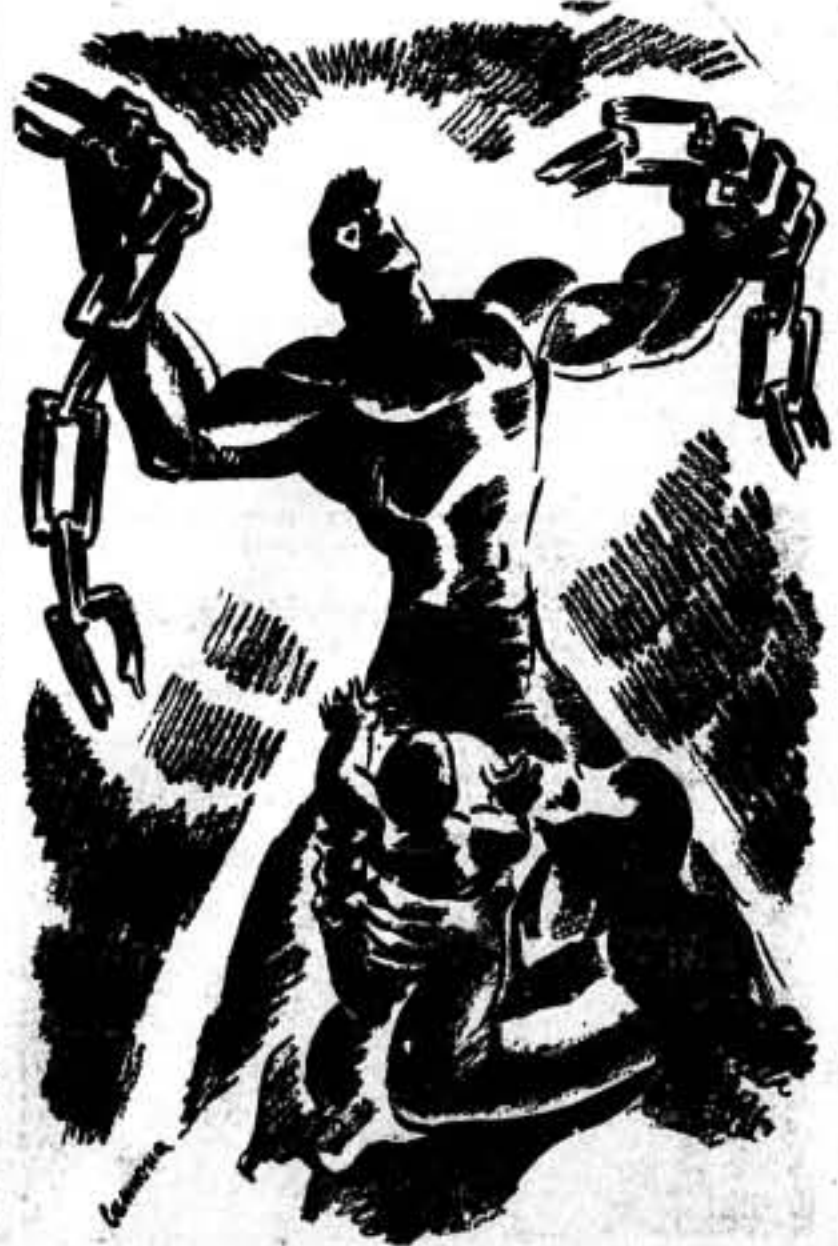
¿Para qué rompiste las cadenas que te oprimían? Completa tu obra con la absoluta liberación de España. Esta lámina-dibujo, todo amor y ternura, te lo recordará. Madre e hijo te piden justicia y venganza.