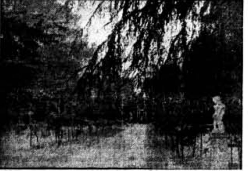
Este paseo, de frondosos y altos árboles, de la Alameda de Osuna, que en otros tiempos fué capricho de una encopetada dama muy conocida en Madrid, no por su vida honesta, precisamente, servirá ahora para goce de los niños madrileños.

Dado el carácter de estos festivales, todos los artistas actuarán desinteresadamente. Ficalizará el espectáculo con un gran baile de sociedad.