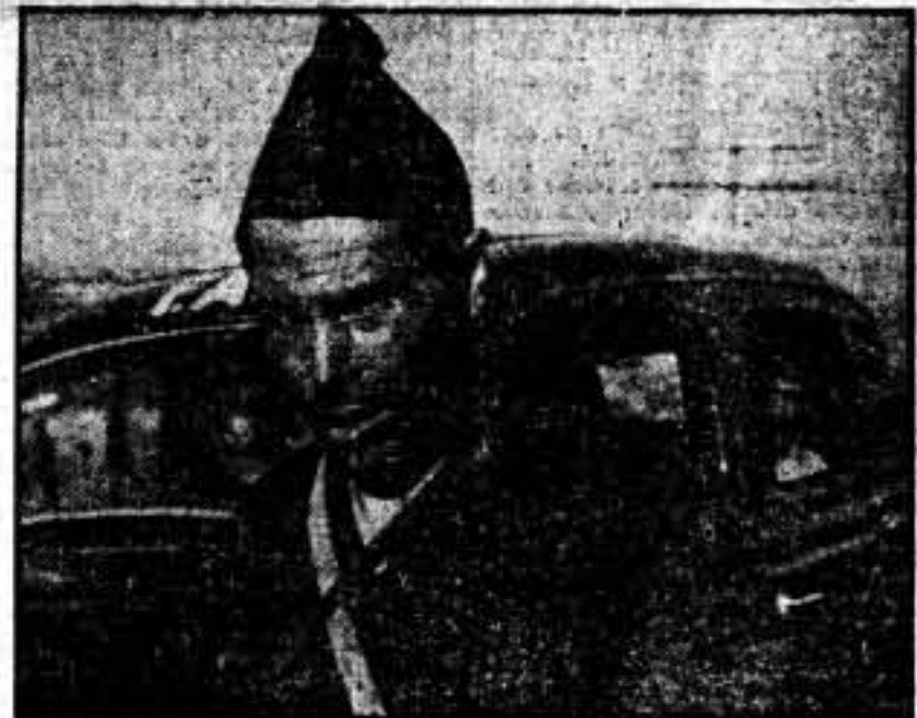
"Al fascismo no se le discute, se le destruye".

Los soldados que hemos copado se han dirigido a nosotros al grito de: ¡hermanos, no matarnos!, y con los rostros sonrientes se han entregado a nuestros milicianos, a los que va-