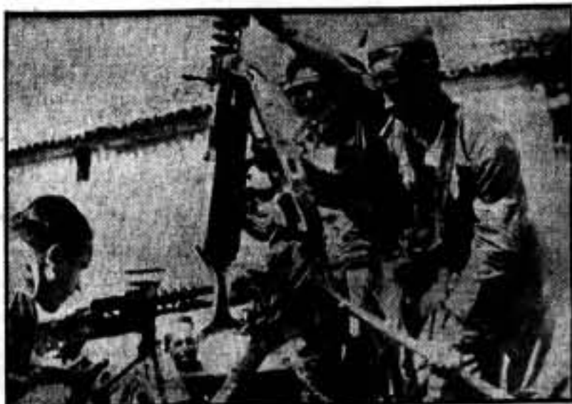
Preparando un cañón antiaéreo.