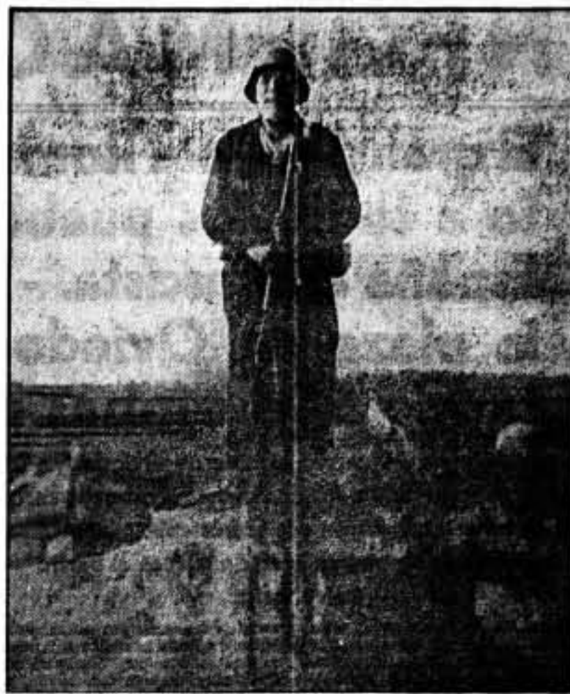
Un viejo de setenta y tres años, que luchó contra los carlistas en la guerra pasada, figura ahora en las avanzadas de Almodóvar.

Ahora que los fascistas han sido batidos y dominados en varios frentes y que nuestras avanzadas se encuentran ya a veintidós kilómetros de la capital, el cuartel general en Guadix resulta lejos del frente, pero, por otra parte, es donde ofrece mejores garantías de comunicación. Guadix se encuentra en las proximidades de Jaén, Almería y Granada.