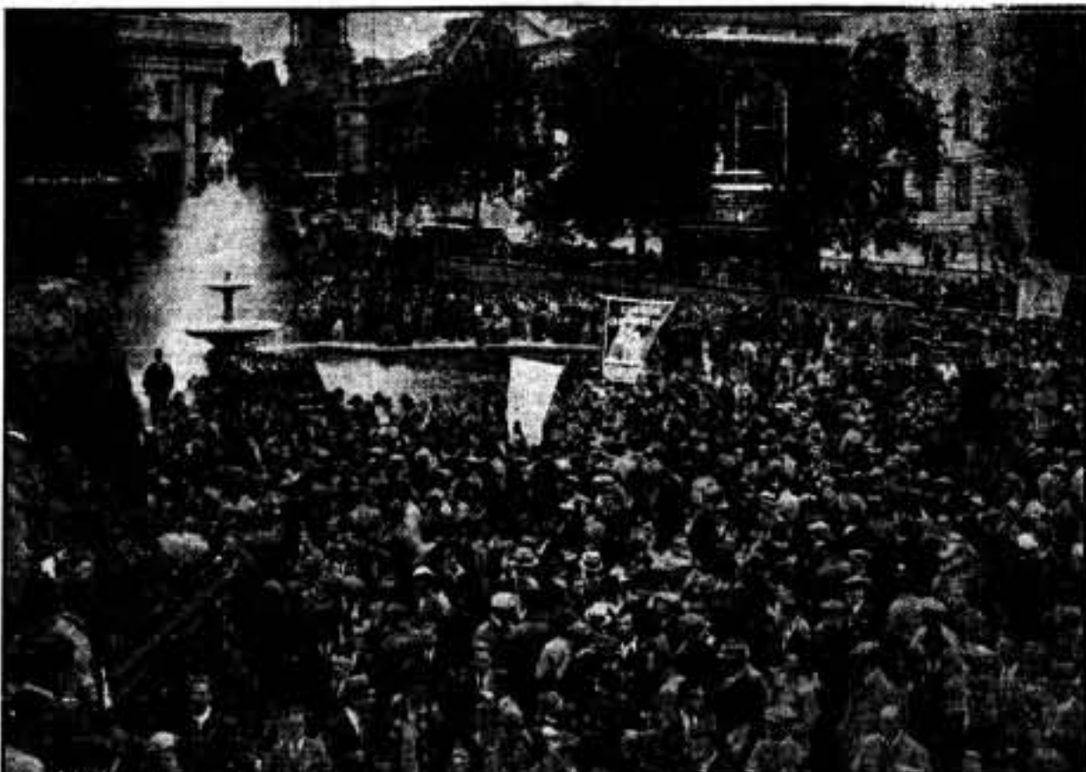
Una imponente multitudinaria hizo demostración de su simpatía para el pueblo español en la Plaza Trafalgar, en Londres, con el fin de obligar al Gobierno inglés a tomar partido y ayudar a España. Muchachos y hasta los niños asistieron a la demostración, que era una de las más grandes asambleas populares que se ha registrado en Londres desde hace mucho tiempo. Aspecto general de la enorme multitud rodeando el pie de la columna de Nelson en la Plaza Trafalgar, de Londres.