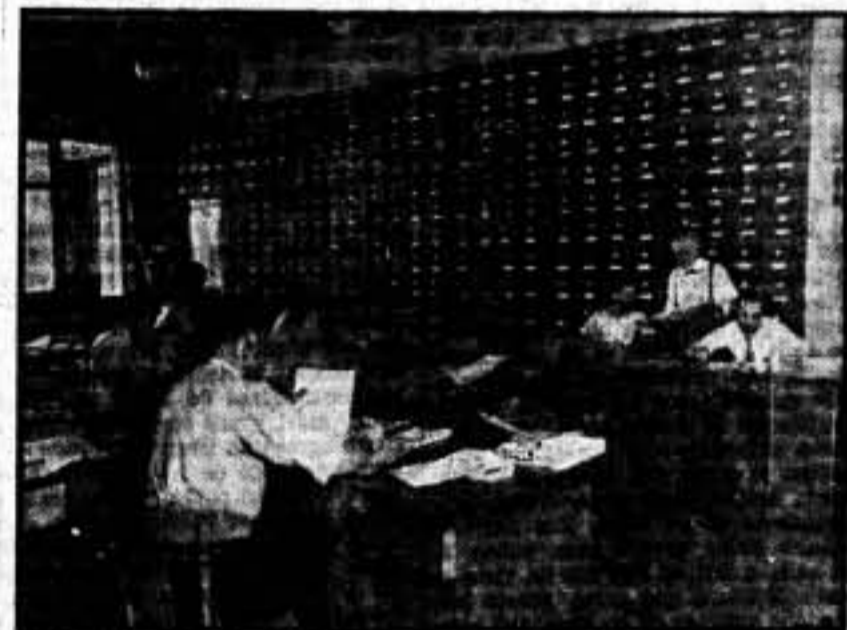
Exportación del Comité Industrial Algodonero.

fraternizado en las horas de penuria con todos los que en otros tiempos hicieron más que no vernos, pero ahora decimos que todas las posibilidades se cifran en que nos volvamos a ver con la victoria en nuestras manos y habiendo implantado un régimen nuevo que ha de ser indefectiblemente el Comunismo libertario.