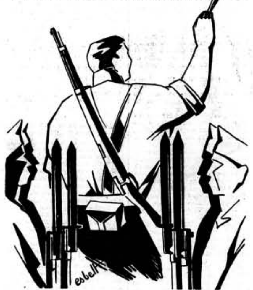
El gran avance revolucionario.