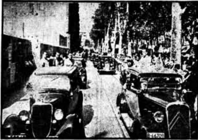
El paso de los autotaxis de la C. N. T. por las Ramblas, entre ovaciones del pueblo.