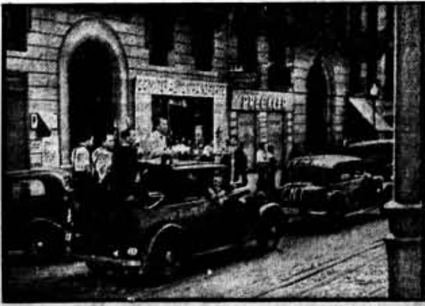
Los socios de los Comités, estacionados frente al local del Autotransporte.

En los diferentes coches, aparte del grandioso número de camaradas