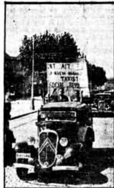
Dice así la pancarta: "C. N. T. - A. I. T. - F. A. I. La nueva organización Taxista Social y Revolucionaria". ¡Es el grito de guerra en esta retaguardia histórica!

lumnas organizadas, partieron ciento veinte coches.