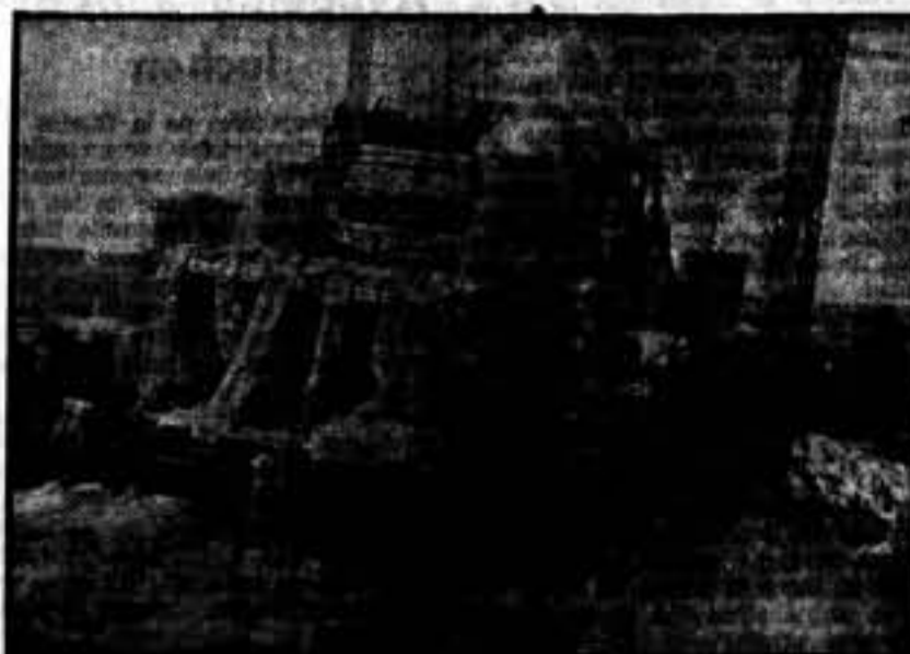
Sección de molinos.