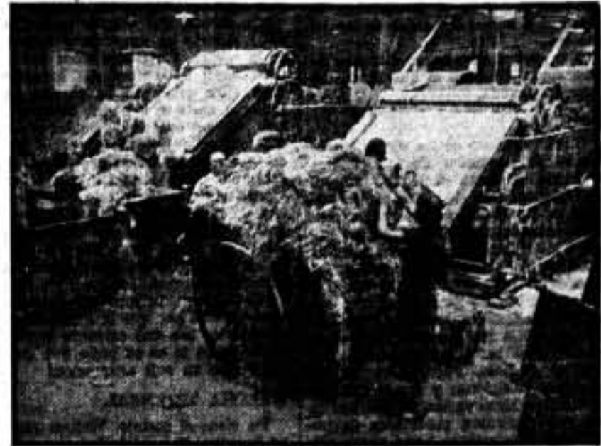
Sección de molinos.

El Comité Nacional de Relaciones del Fabril y Textil no puede dejar de cumplir la alta misión que tiene encomendada de los Sindicatos, como tampoco puede ni quiere alejarse de la verdadera aspiración de todo un pueblo, y frente a ello debe hacer constar, para que todo el mundo lo sepa, para que se percate, que seguirá, como lo ha hecho, luchando a brazo partido contra los detractores de los derechos, como también velará constantemente para que la industria se enriquezca, para que ella