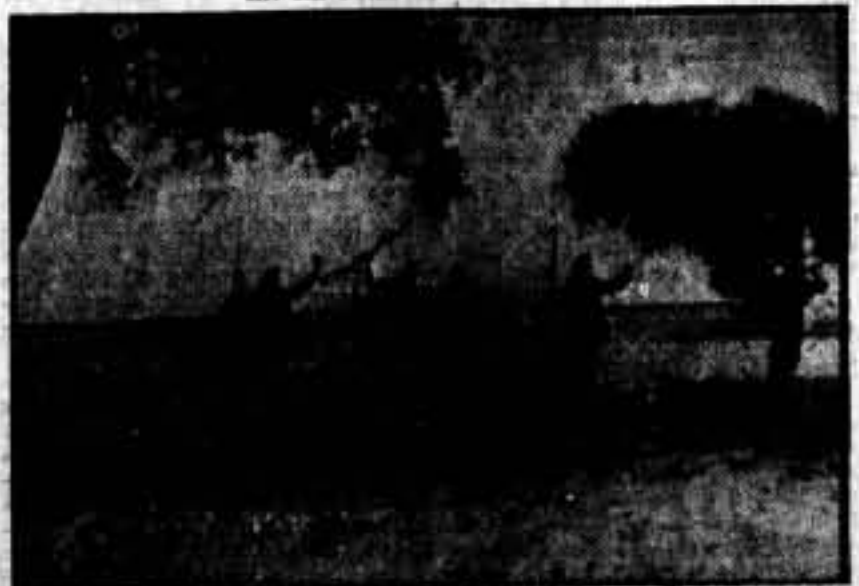
Una de nuestras avanzadillas se dispone a penetrar en una nueva posición, de donde ha conseguido traer hasta el enemigo...