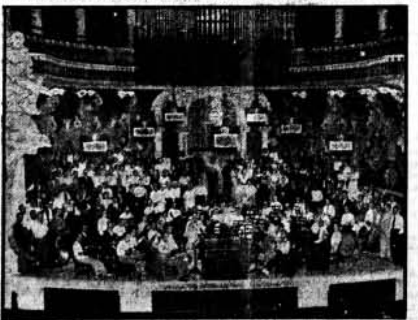
Orfeó Catalá, que ha contribuido a impresionar en los libros Odeón los himnos "Hijos del pueblo" y "A los herriedos".

te, ametrallándolos y derribándolos a los pocos momentos. Los tres aparatos facciosos cayeron en llamas y arrojados en llamas.