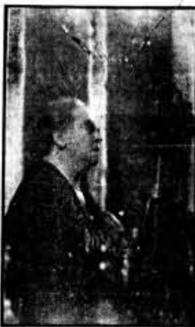
Camarada Emma Goldman, inglesa

Sea o no compañero, quien nos pueda escuchar, que vea en nuestras aseveraciones o afirmaciones un elevado sentido de responsabilidad. Cada palabra nuestra es una sentencia de muerte contra el régimen capitalista. Hoy no se trata de votar o no votar, ni de hablaros de anarquismo, comunismo o sindicalismo. No venimos a nada de ello, porque es hora de hechos concretos, de realidades, de veracidad. Aquellas promesas de ayer, han adquirido una elocuente realidad.