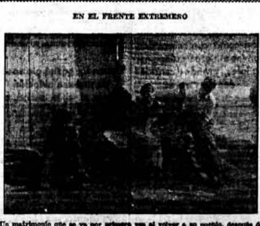
Un matrimonio que se va por primera vez al volver a su pueblo, después de haber sido desalojado de fascistas.