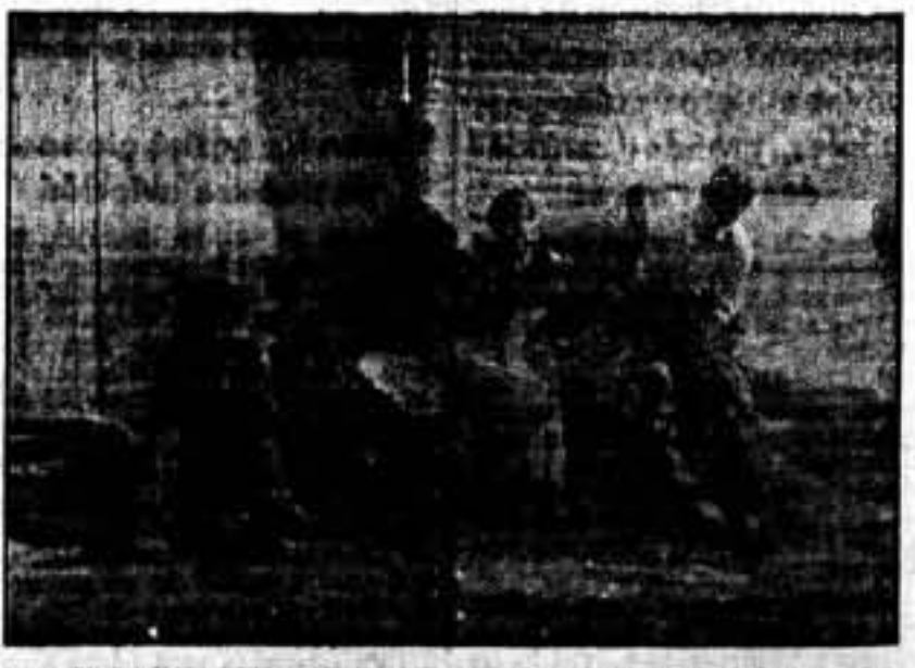
Un matrimonio que se va por primera vez al volver a su pueblo, después de haber sido desalojado de fascistas.

De la Sección de Auxiliares de Radiólogos del Sindicato Unico de Sanidad, nos ha hecho entrega de un paquete de libros para los militantes del frente.