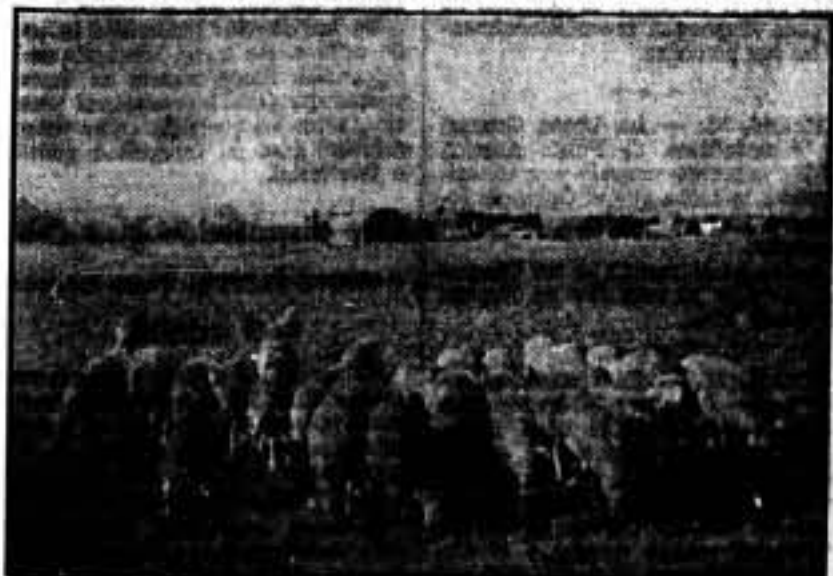
Uno de los campos de aviación, con abundante ganado.

Guadalajara está invadida de campesinos. Son gentes del campo anérgico, incluso de la parte aragonesa, que se vienen a luchar con nosotros. Muchachotes fornidos, llenos de entusiasmo, que quieren un fusil, y día