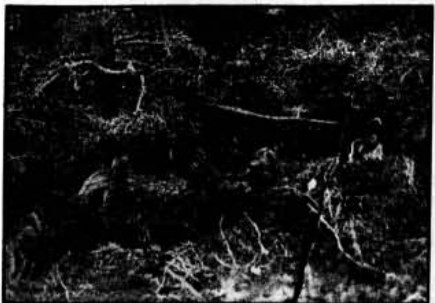
Por entre la maleza, nuestros bravos milicianos disparan contra los facciosos.