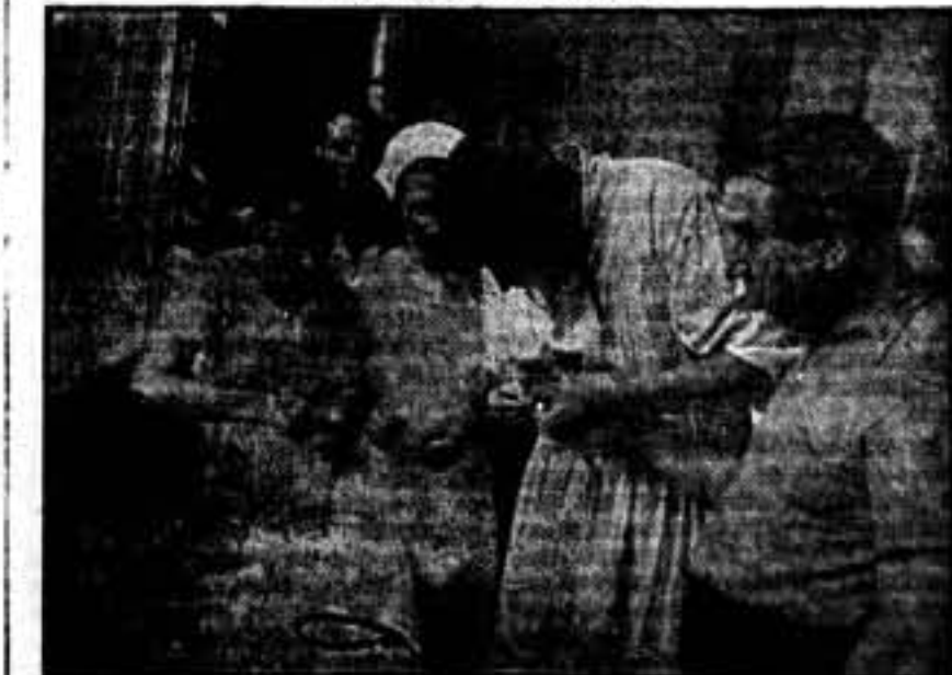
También en la retaguardia, hombres y mujeres se dan sangre; con ella salvarán la vida del hermano que cayó en las avanzadas, luchando por la libertad. Miles de ciudadanos, como un nuevo ejército de milicias, se presentaron en el Hospital General de Cataluña, para alistarse a estos servicios de transfusión de sangre.