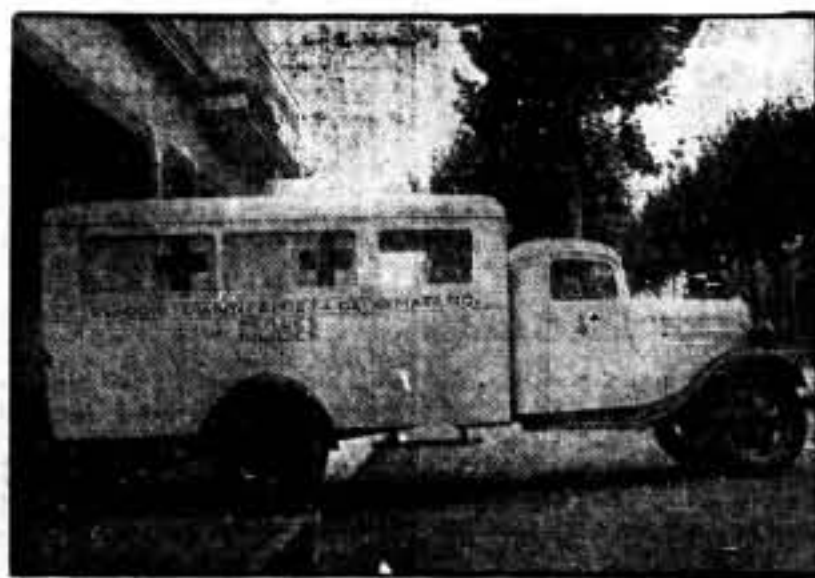
Ambulancia ofrecida por la ciudad de Mataró, al Consejo Sanitario de Guerra. Aspecto exterior.