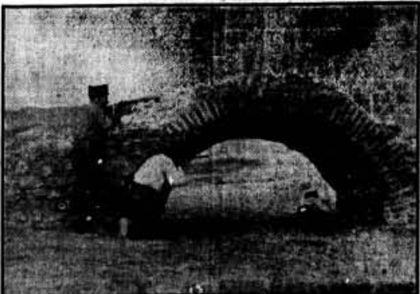
En cualquier sitio se parapetan nuestros bravos luchadores, para hacer huir por los campos exterminados a los gorbales.