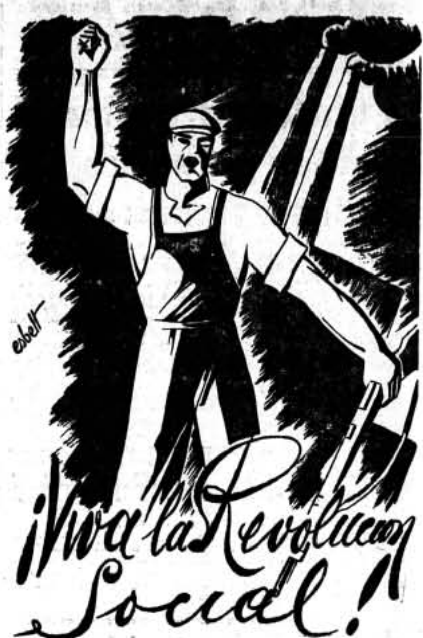
El grito que hace vibrar a los nobles corazones en pos de la libertad de los pueblos.

EL EQUIPO NUMERO 1 POR TIERRAS DE LEVANTE Ayer se celebró, con gran éxito, un mitin en Vechi. En este pueblo, en cuanto llegamos, la población, al vernos llegar, hula y se emocionó, porque tenían temor a los anarquistas. Es que siempre, en todos los tiempos y todos los sectores, han hecho creer a los ingenuos que los anarquistas lo destruimos todo, que todo lo arrasábamos y que se habían de cuidar de nosotros. Pero se ha demostrado que no es así. El acto que celebramos resultó brillante; todo el pueblo se volcó en el local al darse cuenta de que todo lo que contra nosotros habían dicho era incierto. Y todo ello a pesar de que no se había hecho propaganda apenas. Al día siguiente nos pasó lo mismo en Lucena. A la salida del pueblo, todos los trabajadores nos aclamaban entusiasmados. Les llevamos el optimismo que necesitaban. Hemos estado en ocho pueblos, aunque sólo hayamos informado de unos pocos. En todos igual. La Confederación Nacional del Trabajo y la F. A. I. es aclamada. Antes nos temían; ahora nos veneran. Se han deshecho las mentiras. La verdad resplandece por doquier para la Confederación Nacional del Trabajo y la F. A. I. Equipo de Propaganda Número 1 Por tierras de Levante, septiembre de 1936. ... La compañera de Riquer Palau, debe presentarse a la mayor brevedad posible, en estas Oficinas de Propaganda C. N. T.-F. A. I. Via Layetana, núms. 32 y 34, cuarto piso. Por las Oficinas de Propaganda.— El Secretario.