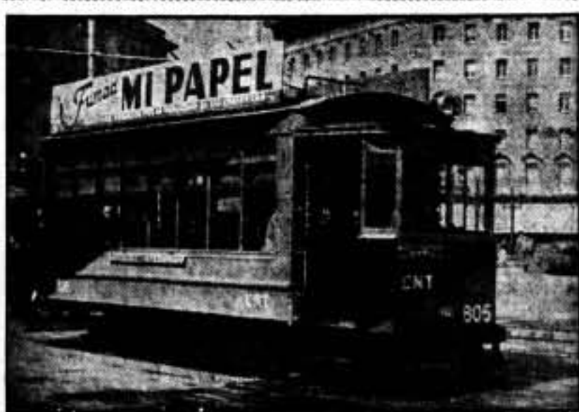
El primer tranvía, rojo y negro, que circuló por las Ramblas, construido por los obreros de la CNT.