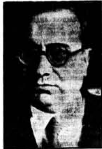
D. Luis Araquistain, nuevo embajador de España en Francia

Federación Local de Sindicatos Unicos. Barcelona, 21 de septiembre de 1936.