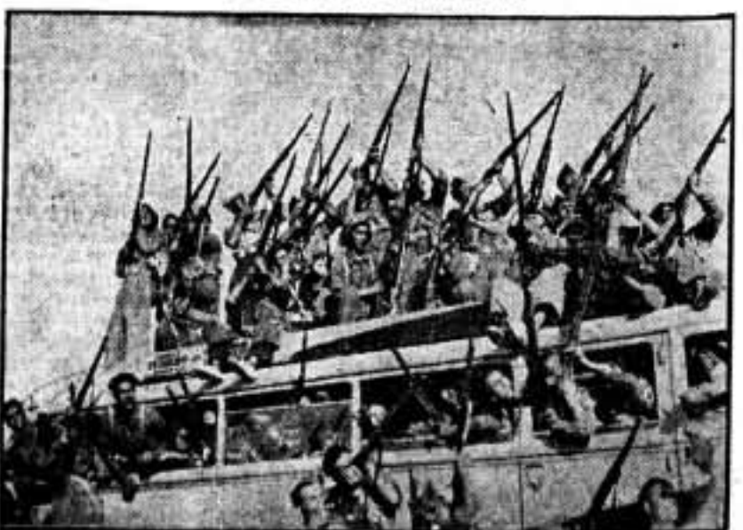
Nuestros bravos soldados muestran el armamento cogido ayer a los rebeldes, en la toma de un pueblo extremeño.