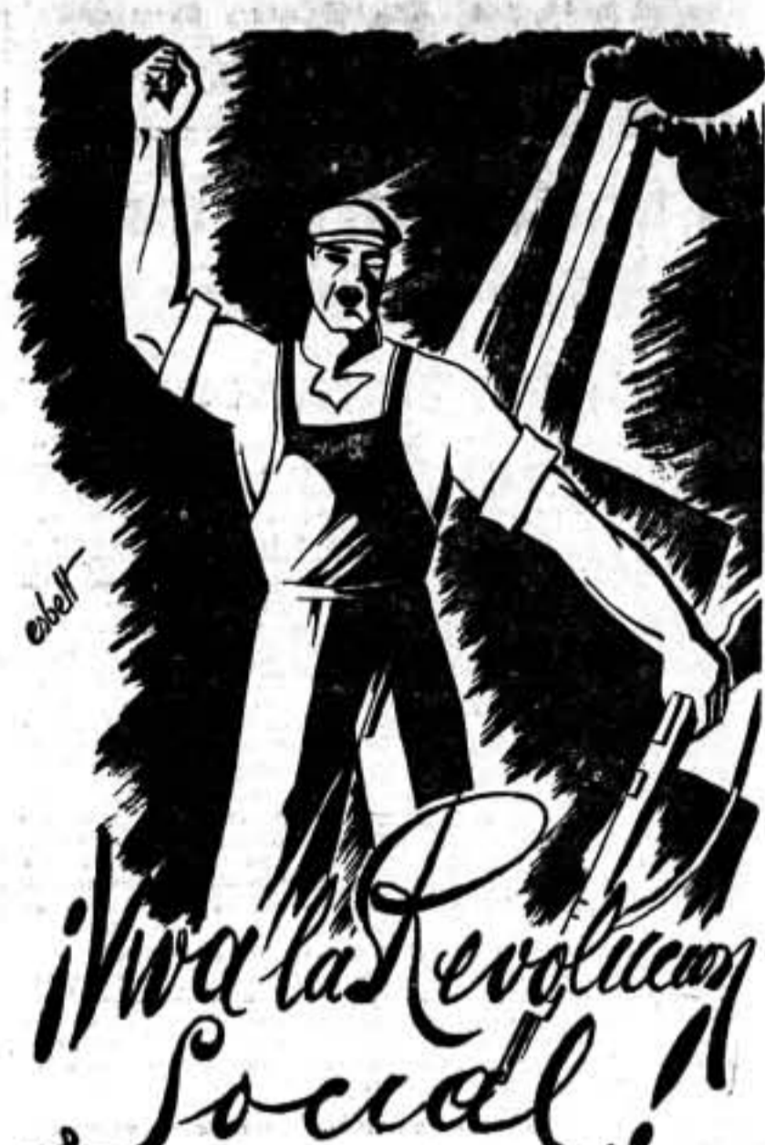
El grito que hace vibrar a los nobles corazones en pos de la libertad de los pueblos.

De la Sección de Auxiliares de Radiólogos del Sindicato Unico de Sanidad, nos ha hecho entrega de un paquete de libros para los milicianos del frente.