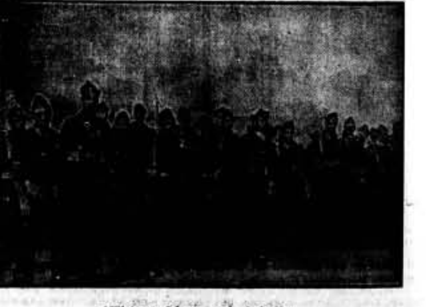
Milicianos del cuerpo de Aviación.