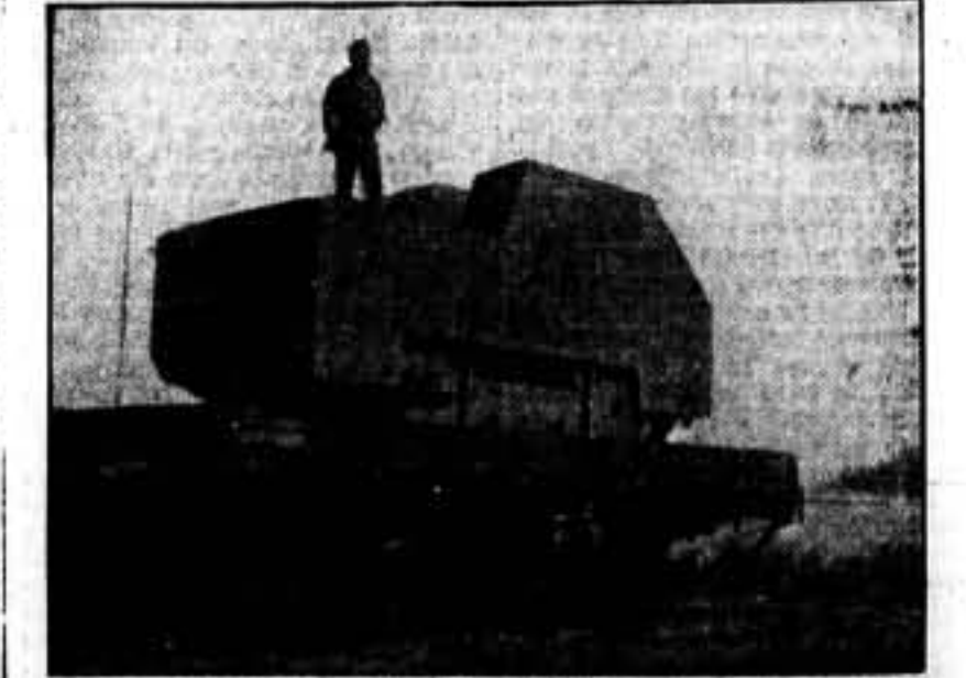
Tanque construido por los camaradas metalúrgicos de San Sadurn de Noya.