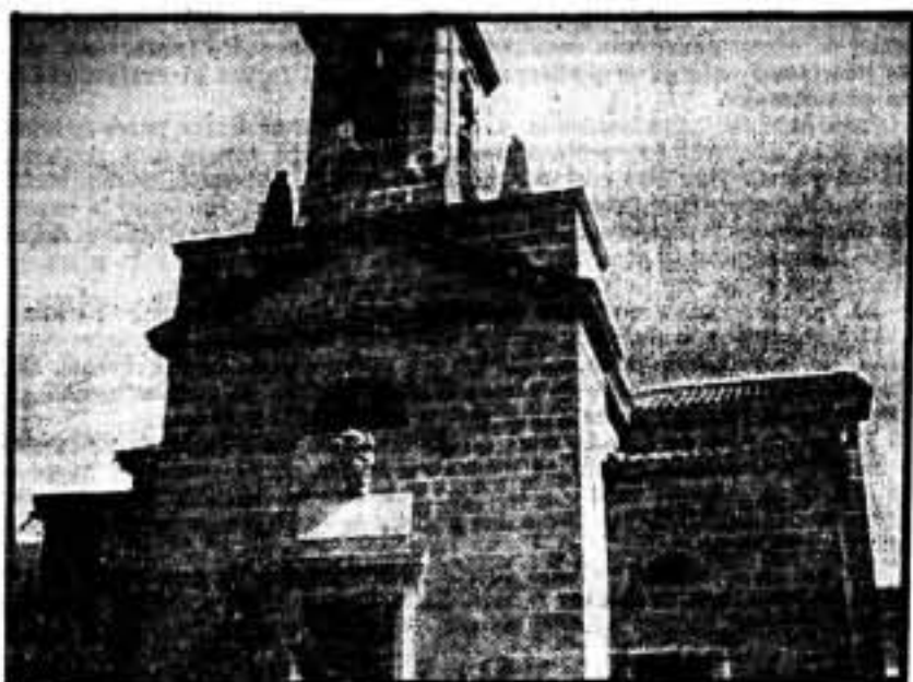
En la más alta del campamento de lo que fué la Iglesia de Vélez Benaudalla, varios milicianos y carabineros vigilan los movimientos de la aviación enemiga

Después de haber pasado casi toda la noche en vela esperando el bombardeo con que los fascistas de Granada habían amenazado a la ciudad de Motril en caso de no entregarse dentro del término de veinticuatro horas, y de haber tenido que escribir la crónica diaria con la cual se ilustran los lectores de SOLIDARIDAD OBRERA sobre los acontecimientos de la región andaluza, apenas ha salido el sol nos dirigimos a Vélez Benaudalla, vanguardia del sector Motril, donde días pasados se desarrollaron los más lamentables sucesos.