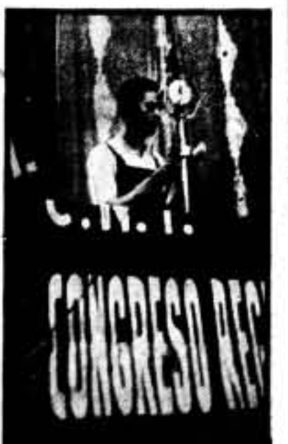
Un miembro de la Regional leyendo las credenciales de las delegaciones