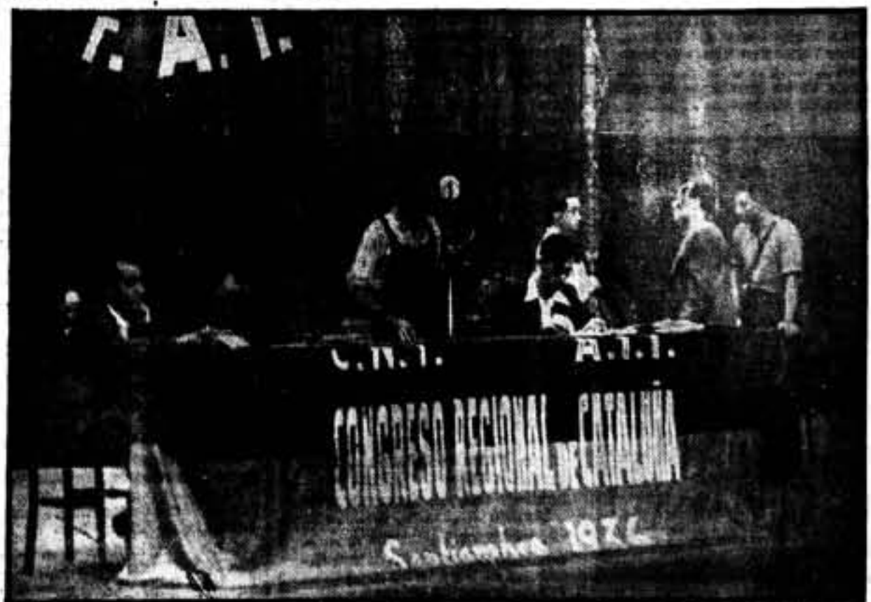
Residencia del acto

¡Adelante, camaradas del pleno, que vuestra labor sea fructífera. Todo lo fructífera que la C. N. T. y la revolución española necesitan!