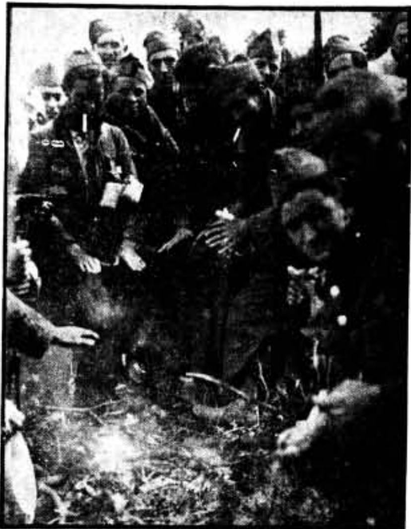
A pesar de ello, buen humor y fogata grande...