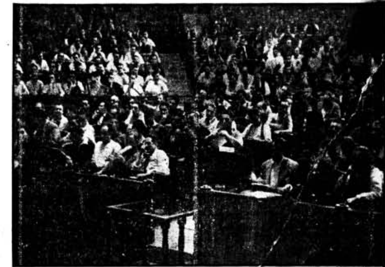
Un aspecto del público