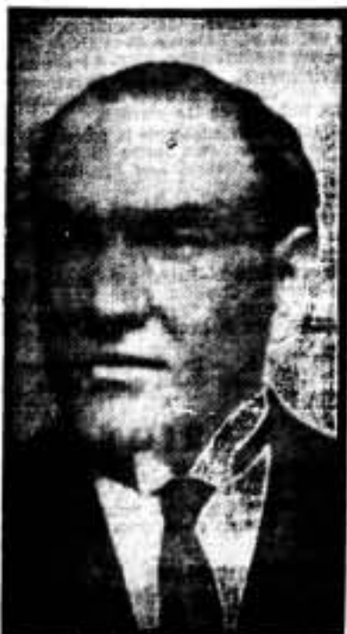
D. Marcelino Pascua, embajador de España en Rusia

Y como a los bravos revolucionarios del noventa y tres, en Francia, la causa que defienden multiplica el entusiasmo y el valor de nuestros milicianos, abriéndoles camino para la victoria final.