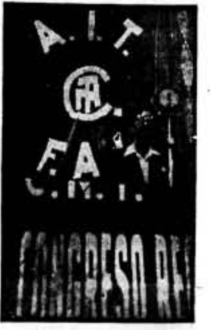
El delegado de la Fabril, de Hospitalet, presidente de la asamblea, durante su discurso