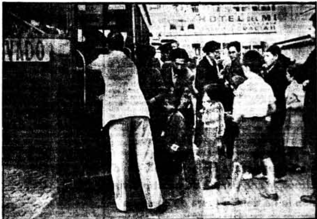
He aquí el humanista perfil del camarada Paig, acondicionando paternalmente a los niños de los pueblos de la reconquista aragonesa

gión se haya creado una situación bastante delicada y angustiosa.