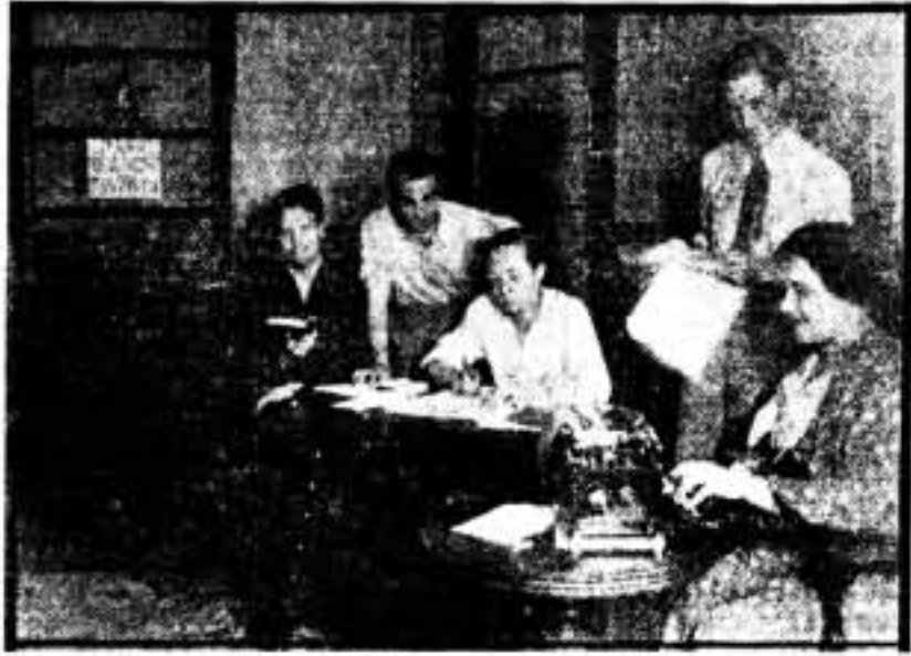
Los compañeros del departamento de Esperanto.