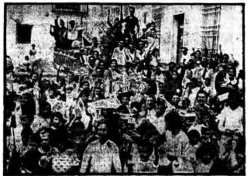
En primera línea, niños y jóvenes. Al fondo, soldados de la Libertad.

Caso contrario, este Comité se verá obligado a darlos de baja de la colectividad.