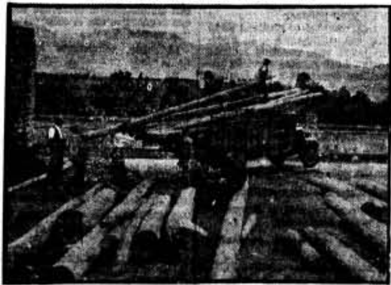
Madera para puntos y parapetos.