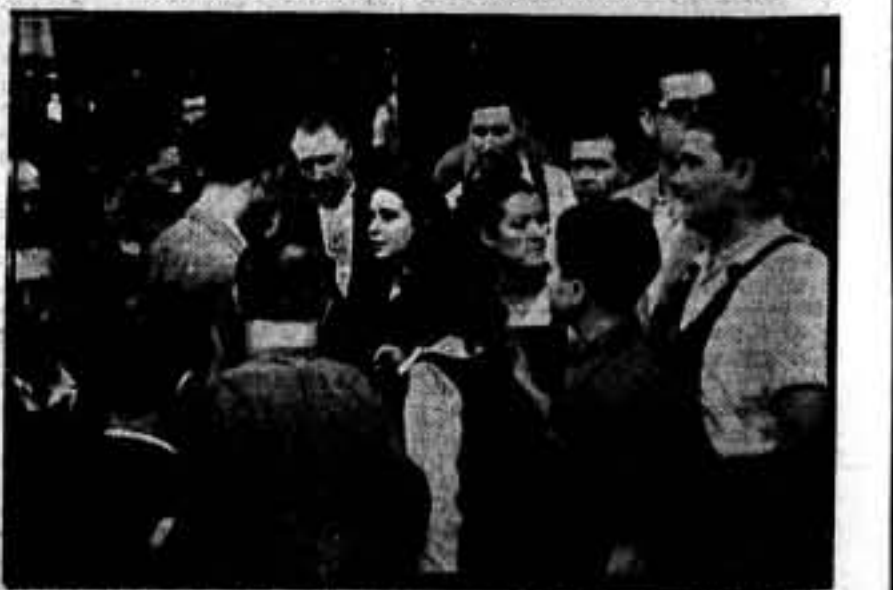
Nuestras damas blancas del anarquismo, transformadas en madres de los pequeños, oyen las indicaciones de Puig.

En e... rriada inmensa y texti nombre activid un gru esos m do de r ni por propios rativo. Por instant convert orden do La l de que cosas econom lución La h de las y quiz socialis industr fábrica industr A trav vicos a brica s ne par cializac y texti HABL. En u España unido a La ma camara faltos a mité c tantes de Hile las cal por los uno II Comité de Sab los obr ciones res. —De do nos dicen le ro—, o recido como e una au la casa la fábr de ince dirigtes de la den— ciones: Person ción O