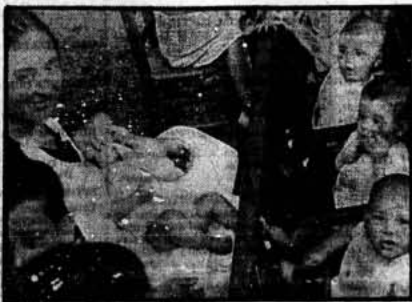
Los pequeños toman el sol en la Guardería, mientras sus madres trabajan

La revolución social ha de recibir el impulso definitivo en fábricas y talleres. Nada habríamos adelantado con destruir los podridos fundamentos de la economía burguesa y aplastar el sistema coercitivo en que éste se apoyaba, si instantáneamente no se tratase de crear un nuevo orden económico. Esto lo saben todos los trabajadores, y porque lo saben se apresuran a plasmar