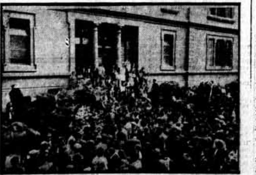
Momento en que se puso en marcha la comitiva. Público y familiares, con las representaciones sindicales, rodean los féretros de los cuatro héroes de la Vanguardia. ¡Solidaridad ante la muerte!

Las características del "Canarias" eran las de un barco modernísimo, dotado de todos los elementos combativos del día, lo mejor de la marina de guerra.