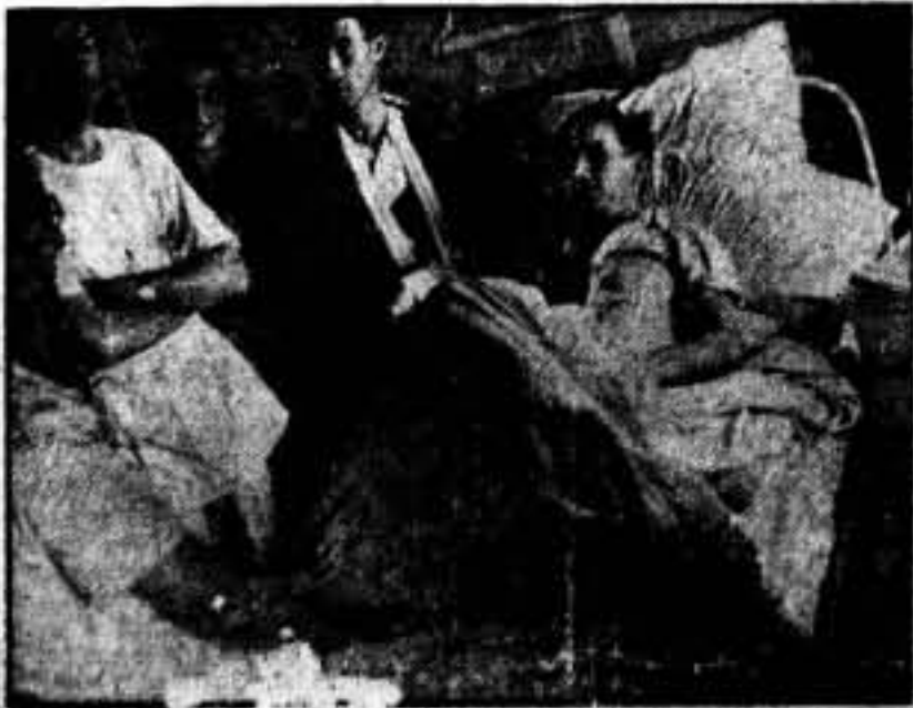
Este bravo miliciano curó a nuestro redactor cómo le practicaron las múltiples heridas que sufrió.

La contemplamos con una jeringuilla en la mano. Estaba preparando una inyección. Su perfil tenue y la albuza de la bata de enfermera resaltaba la belleza de la ex «miss» que paseó triunfalmente sus dones naturales por las salas de festejos. Pero hoy es una enfermera que prodiga sus ternuras a los hospitaliza-