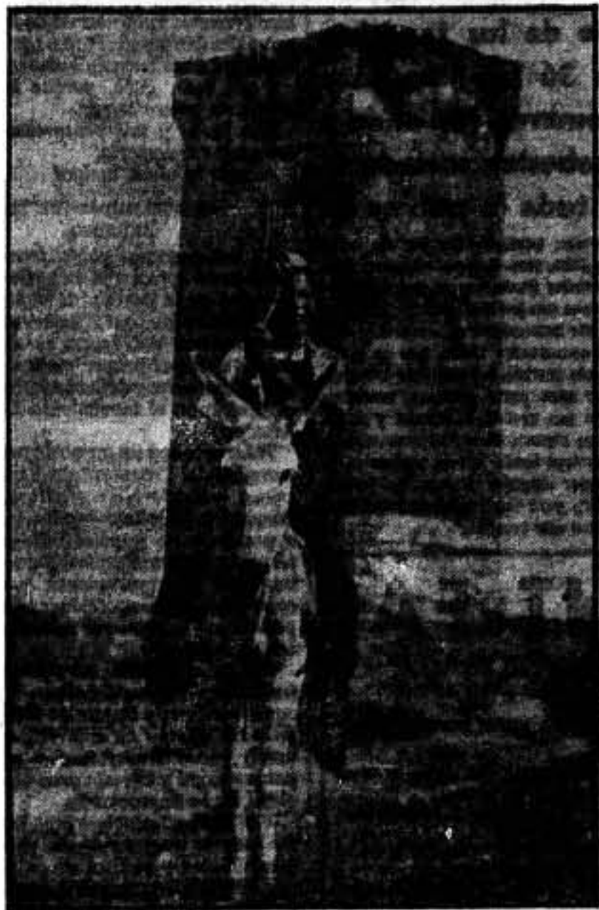
La guardia en un fortín reconquistado.

A seis kilómetros de Siétamo y cinco escasos de Huesca, Loporzano. Un pueblo chiquito con fuertes casas de piedra ocultas en una hondonada entre viñedos y frutales. Alrededor, lomas pedregosas labradas por los campesinos en horas de paz. Enfrente, los fortines rebeldes de Montearagón y Estrechoquinto. Para venir desde Siétamo hay que dar un rodeo, porque las ametralladoras facciosas barren la carretera directa. Sobre Loporzano también tiran con excesiva frecuencia. Pero desde Loporzano se les da siempre una réplica contundente, rápida y definitiva.