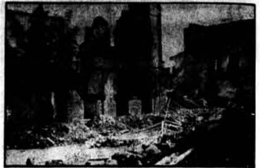
Incendio en Guadix, por los efectos de la dinamita.

Eran las dos de la tarde cuando tuvimos el gusto de saludar, en nombre de SOLIDARIDAD OBRERA, al militar que tantos deseos demuestramos