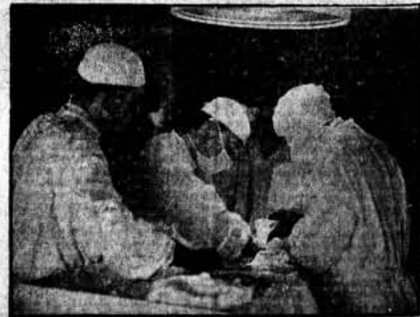
En la sala de operaciones de urgencia. Unos minutos y... libre de todo peligro.