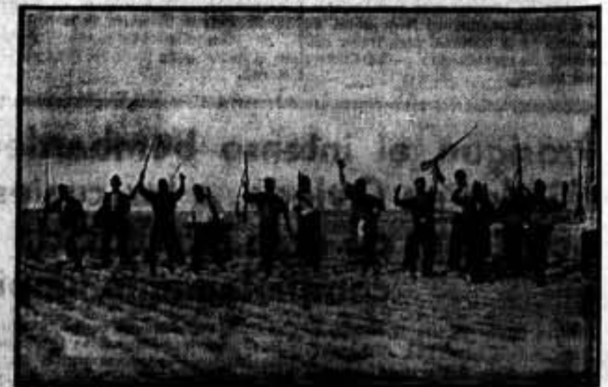
Público en nuestras seccionales, al tomar una posición enemiga.

En las páginas 4 y 5, importante reportaje sobre los servicios sanitarios que desarrolla el Hospital Clínico de Barcelona