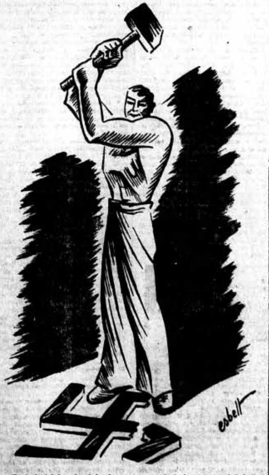
Destruir totalmente al fascismo, para construir la nueva sociedad.

Camaradas taxistas: ¡Salud! ¡Viva la Confederación Nacional del Trabajo! ¡Viva la Federación Anarquista Ibérica!