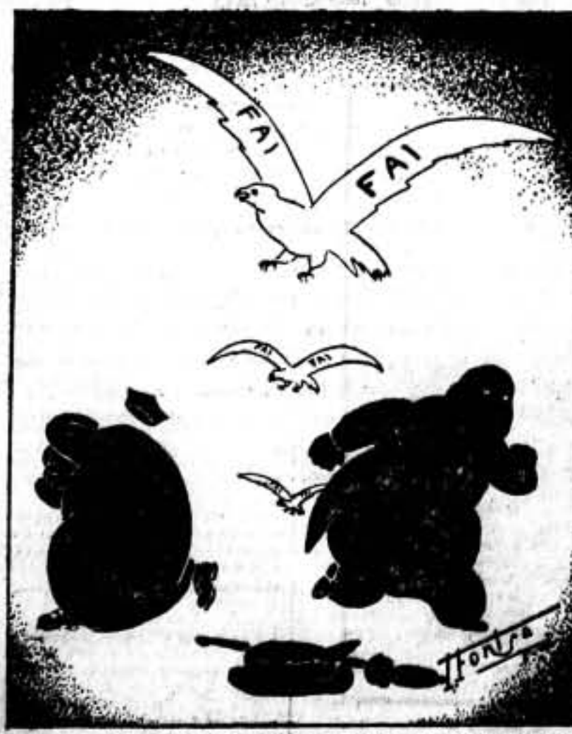
Agüinchos de la F. A. I., os señalamos en ese vuelo hacia la victoria.