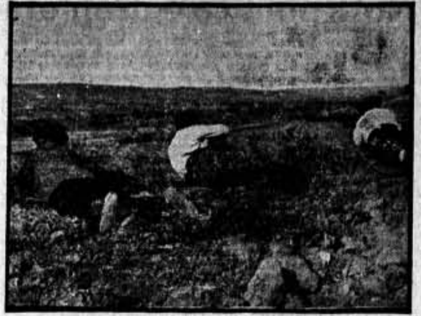
Una de nuestras avanzadillas atacando al enemigo, que lo domina desde una altura.