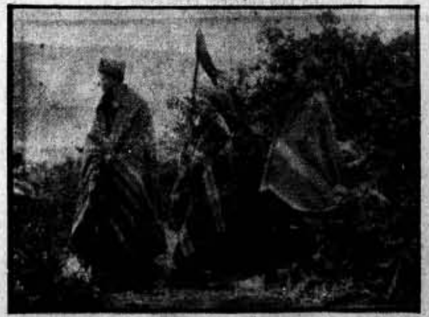
Un puesto de vigilancia, en nuestras avanzadillas, en las primeras horas de las frías mañananas serranas.