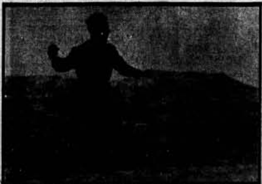
Uno de nuestros bravos soldados, lanzando bombas de mano contra las avanzadas enemigas.