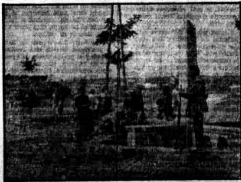
Tranquilidad absoluta en los poblucitos reconquistados por nuestras tropas. La fuente, enclavada en las afueras del pueblo, es vigilada por un veterano miliciano.