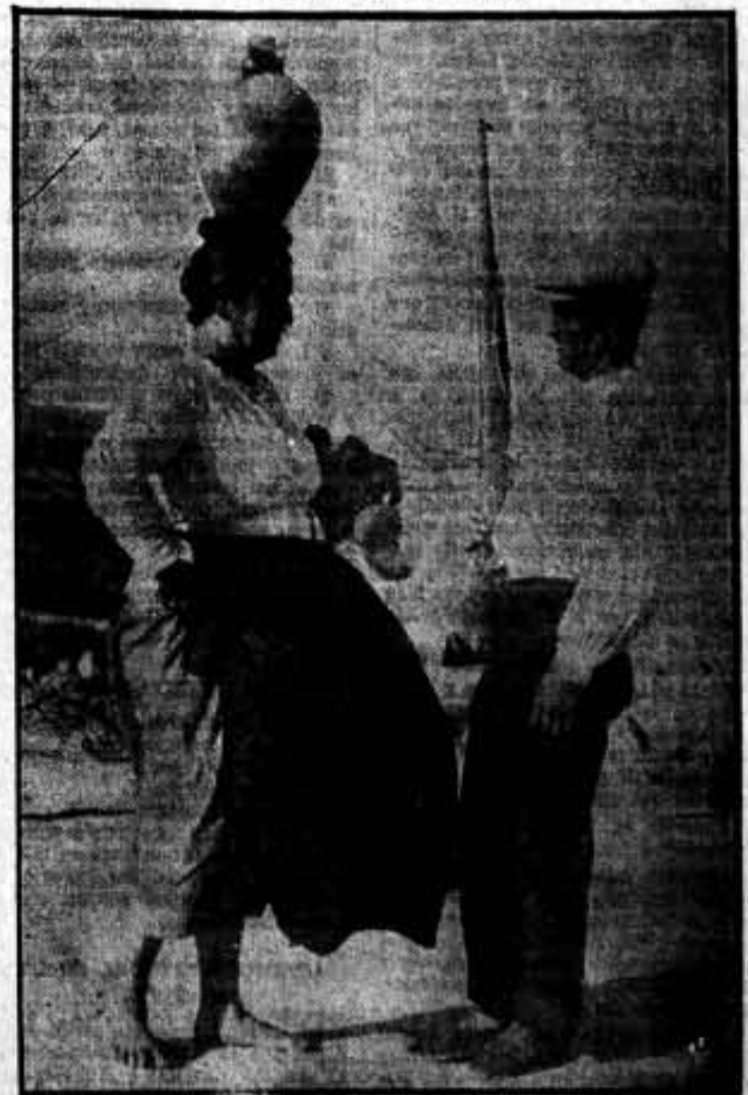
Una escena del frente.