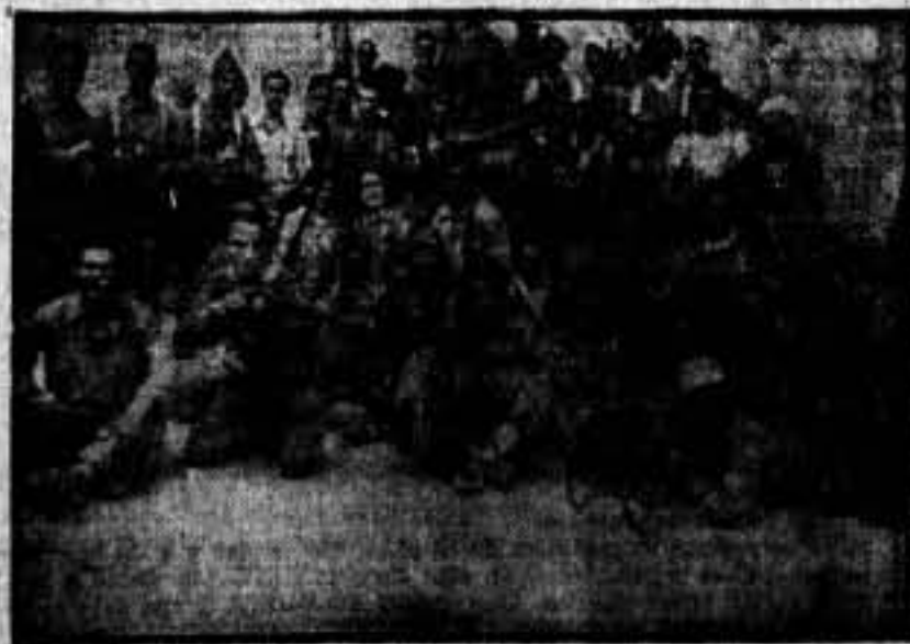
Un grupo de la columna "4 de Septiembre", formada por el Sindicato de la Construcción.