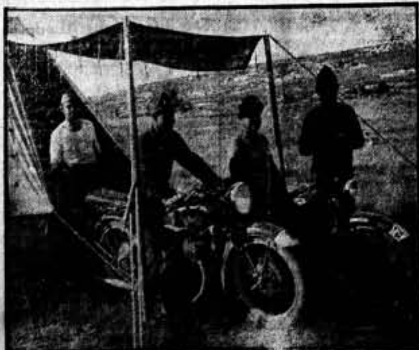
Sección de motos.