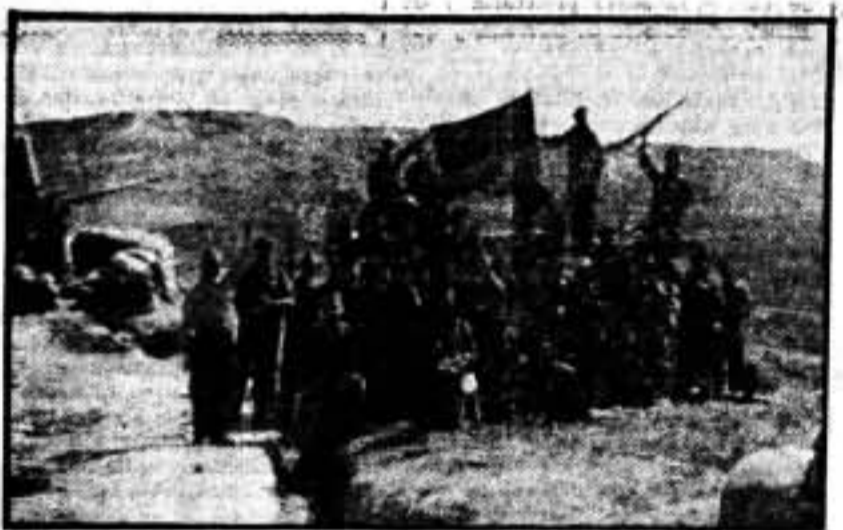
Pieza del 155, tomada al enemigo, en donde ondea la bandera de la F. A. I.