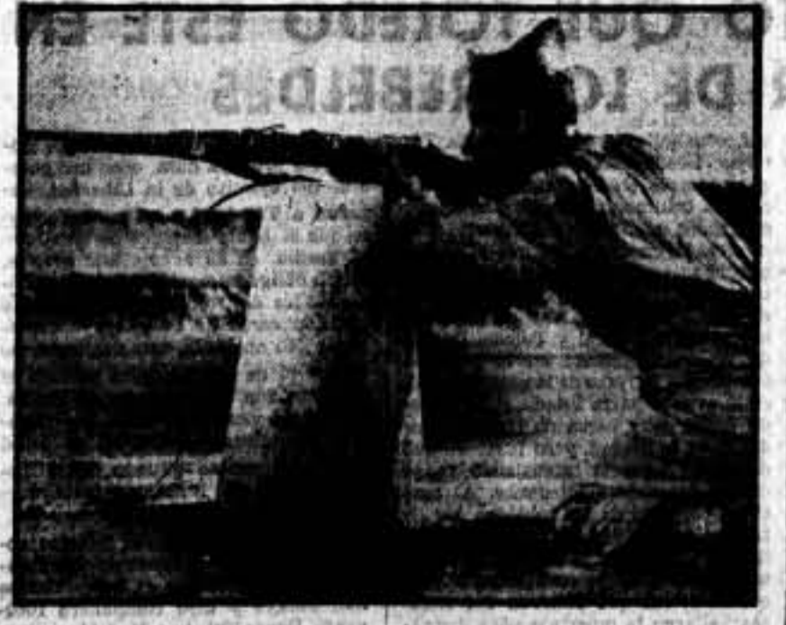
Un soldado de la Libertad, disparando contra los facciosos.