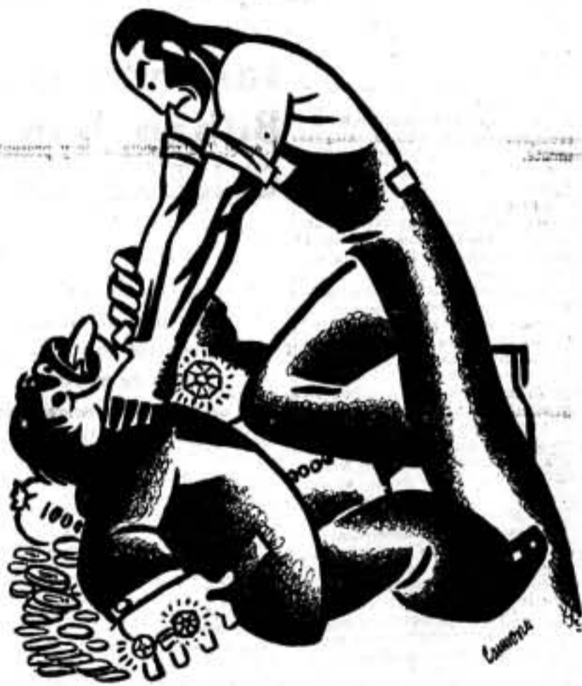
¡No aprietes, "camarada"!

Con ese nuevo ingreso, la C. N. T. refuerza aún más sus efectivos con federales.