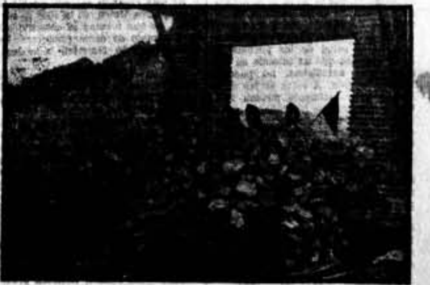
El Fortín de Guasmas, defendido por bravos milicianos.

Serán sancionadas las fábricas que dejen de cumplir dicha orden. — El Comité de Relaciones.