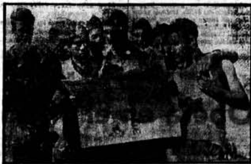
En los ratos de descanso, los bravos milicianos leen su periódico.