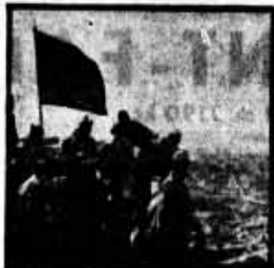
La bandera de la columna "Roja y Negra", mirando hacia Huesca

Comenzamos a recibir visitas de compañeros que han tomado parte personal y activa en las últimas y gloriosas operaciones que han determinado la caída definitiva de Estrecho Quinto y Monte Aragón.