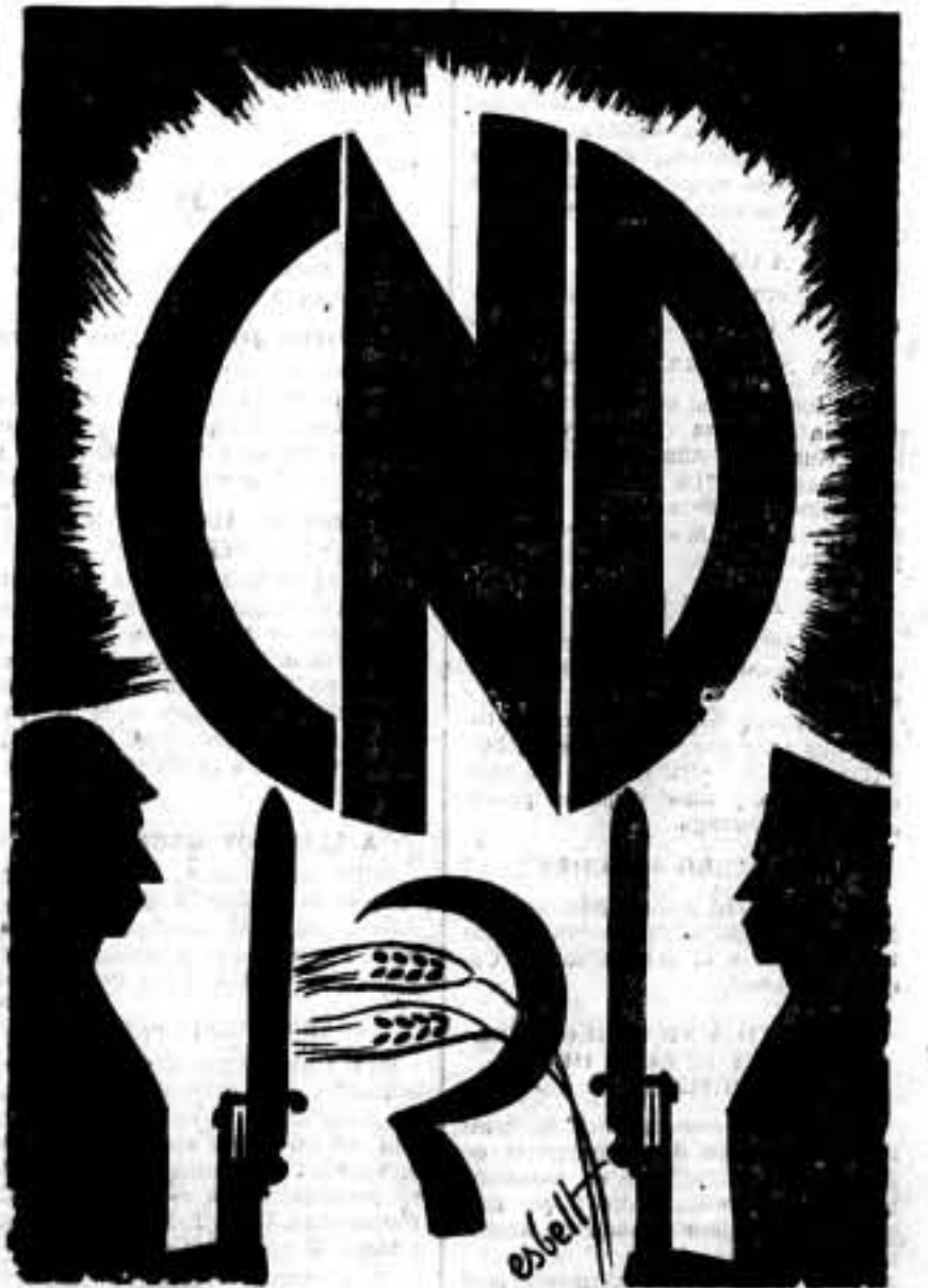
El Consejo Nacional de Defensa es el único organismo que verdaderamente representa las aspiraciones populares.

Si Largo Caballero desea que se realice una sólida alianza revolucionaria y se pretenda que todas las fracciones antifascistas actúen de común acuerdo, ha de reconocer que sin la estructuración de un nuevo órgano, que no puede ser otro que el Consejo de Defensa, será muy difícil plasmar el reto revolucionario nacido al calor de la calle.