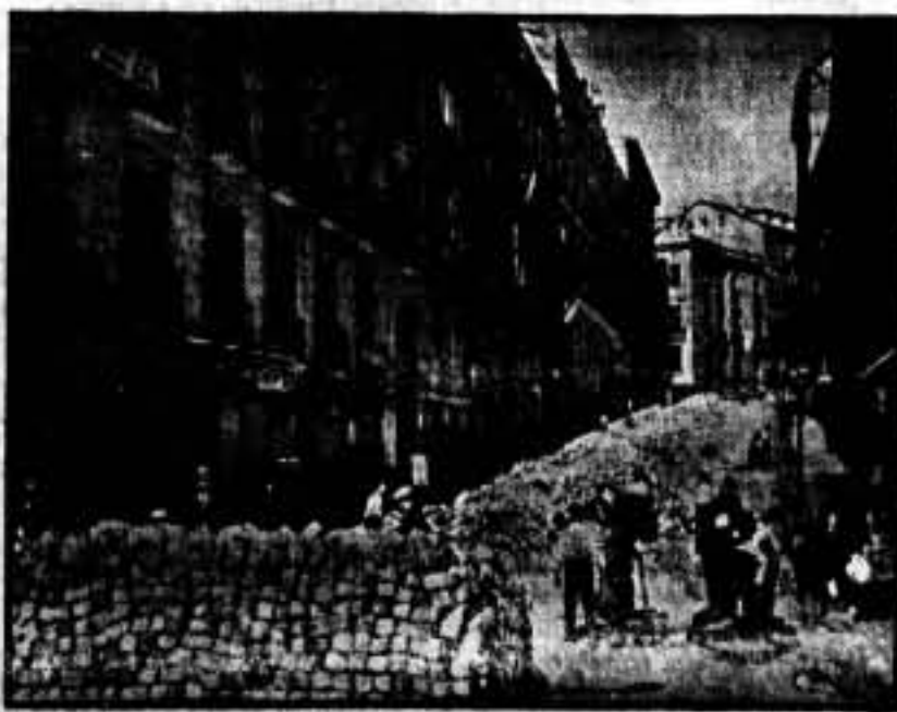
Trinchera en la Cuesta de Santo Domingo y Plaza de la Opera.