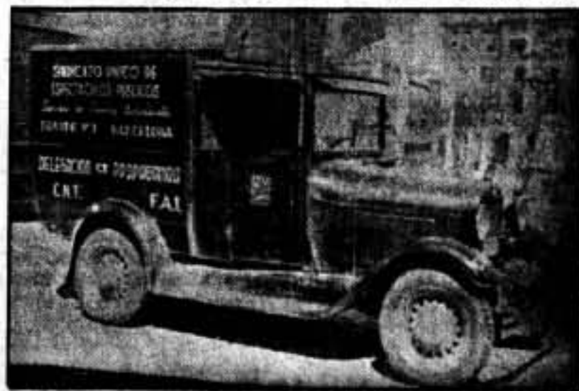
Uno de los coches en el que van los computadores que filman en los frentes.

Marcelino Domingo ha de perseverar en sus concreciones contra el fascismo internacional. Y su voz ha de ser enérgica, pues, de lo contrario, el Comité de ayuda al pueblo español terminaría con una pantomima más. No lo olviden.