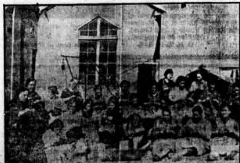
Trabajadoras de la Industria Vidriera, aprovechando las horas para confeccionar tarjetas de identificación.