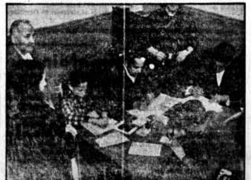
Empleados municipales extendiendo al vecindario la tarjeta de aprovisionamiento, creada por el Ayuntamiento madrileño.